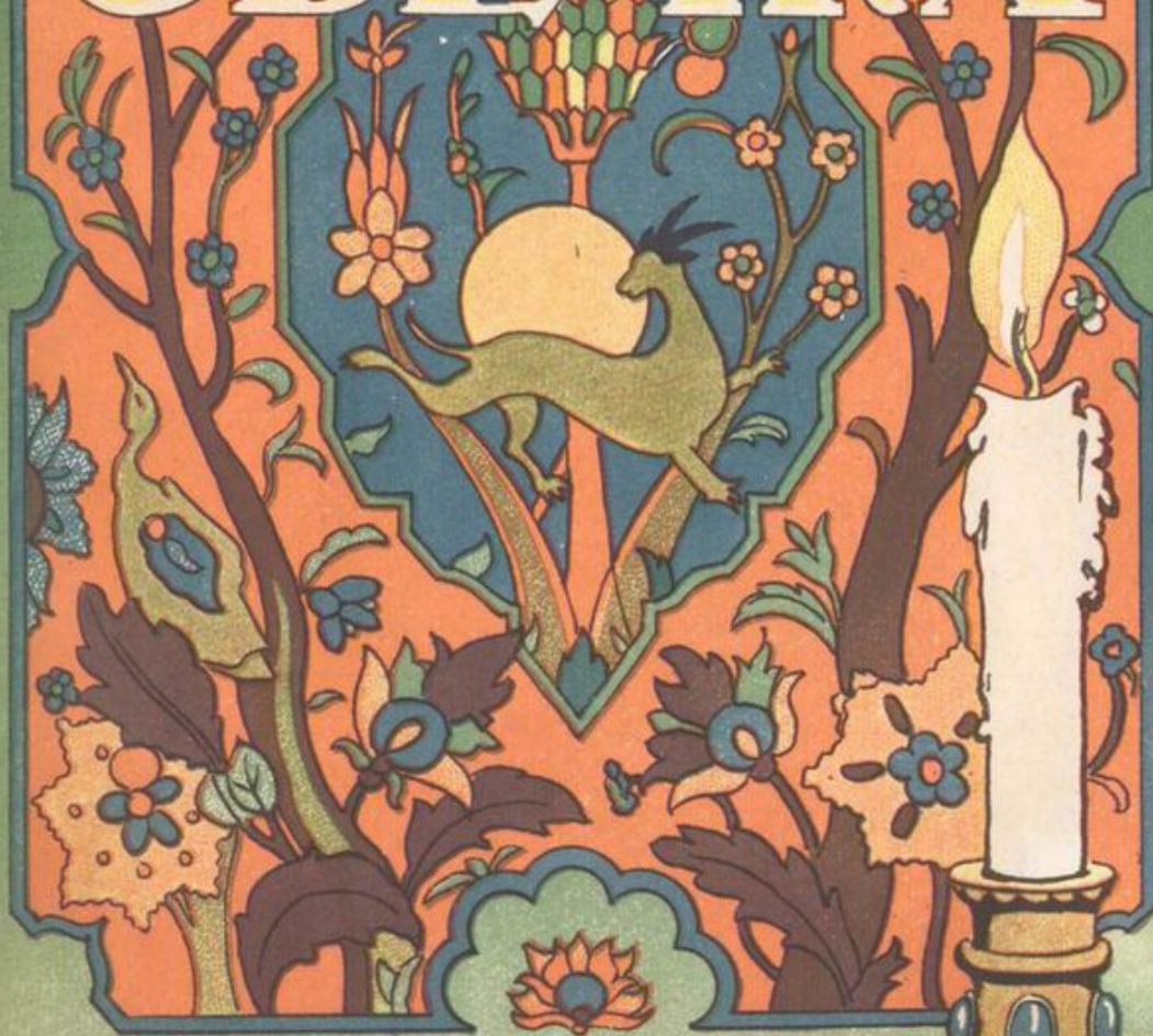
рис. В. АПОСТОЛИ