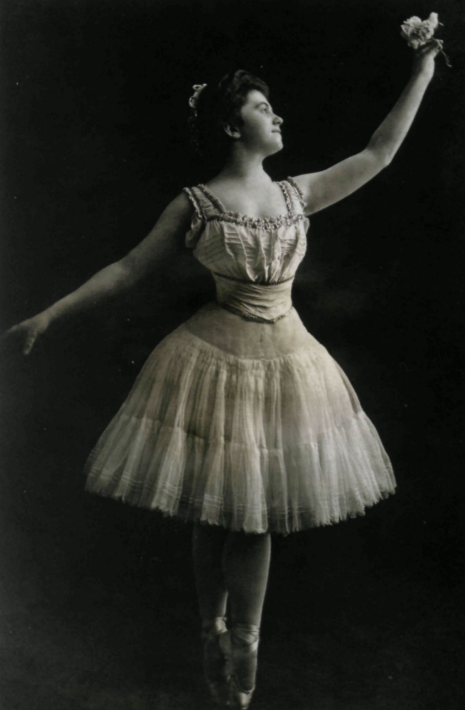
Ольга Хохлова, балерина Дягилевского балета, жена Пабло Пикассо, СПб., 1909 Olga Khokhlova, Ballet Russe dancer and Pablo Picasso's wife, St. Petersburg, 1909