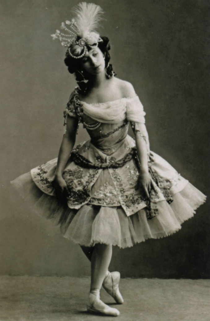
Анна Павлова в балете «Павильон Армиды», СПб., 1909 Anna Pavlova in "Le Pavillion d'Armide", St. Petersburg, 1909