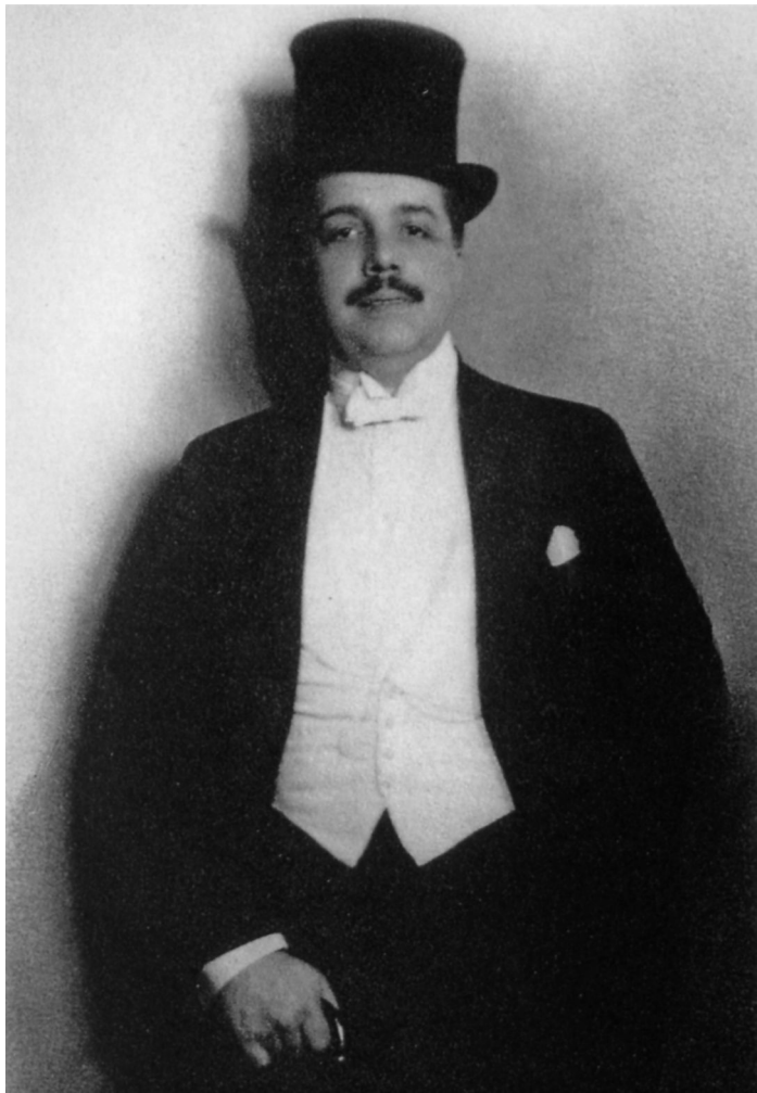
Сергей Дягилев - создатель «Русских сезонов», Нью-Йорк, 1916 Serge Diaghilev - founder of the "Ballet Russe", New York, 1916