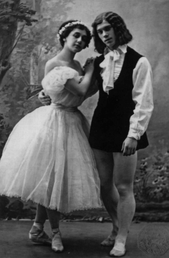
Тамара Карсавина и Вацлав Нижинский в балете «Сильфиды», СПб., 1909 Tamara Karsavina and Vaclav Nijinsky in "Les Sylphides", St. Petersburg, 1909