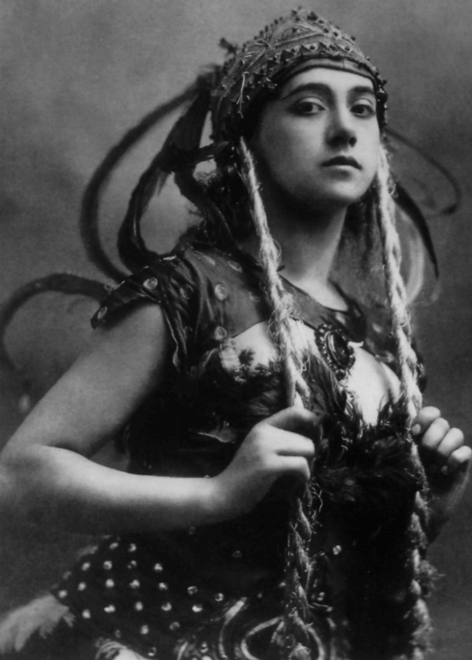
Тамара Карсавина в балете «Жар-птица», Париж, 1910