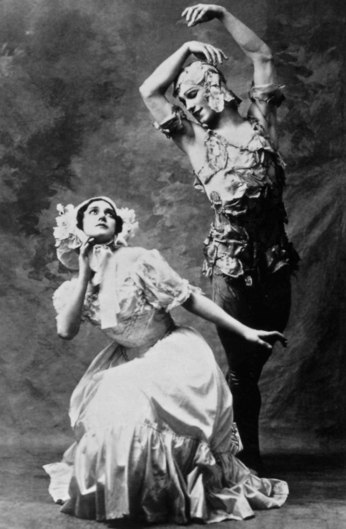
Тамара Карсавина и Вацлав Нижинский в балете «Призрак розы», Париж, 1911 Tamara Karsavina and Vaclav Nijinsky in "Le spectre de la rose", Paris, 1911