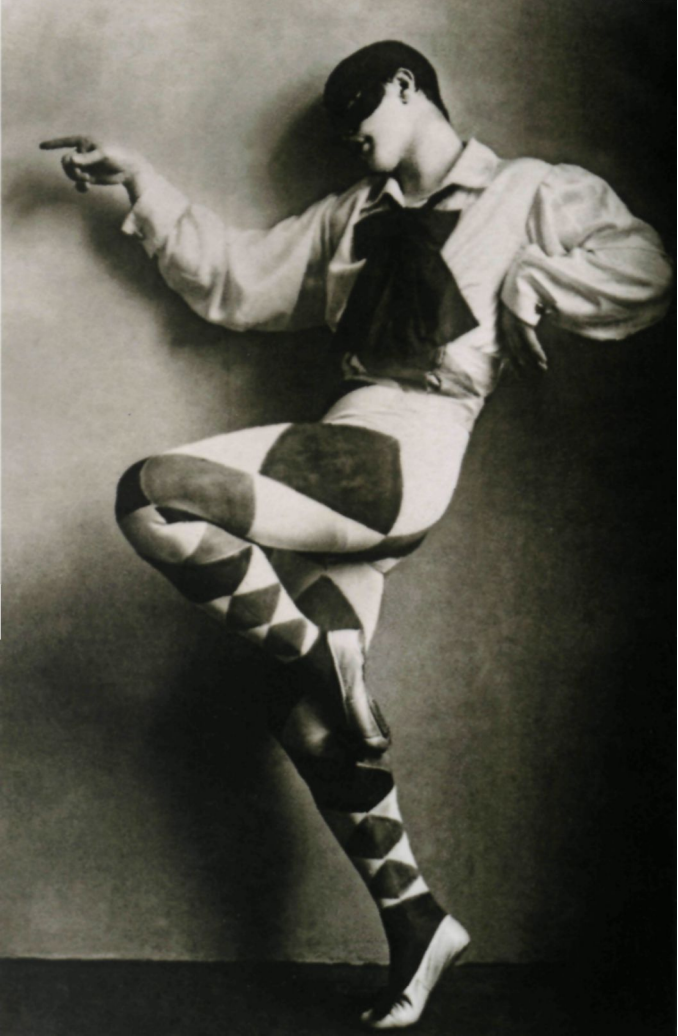
Михаил Фокин в балете «Карнавал», Париж, 1910

Michael Fokin in "Carnival", Paris, 1910