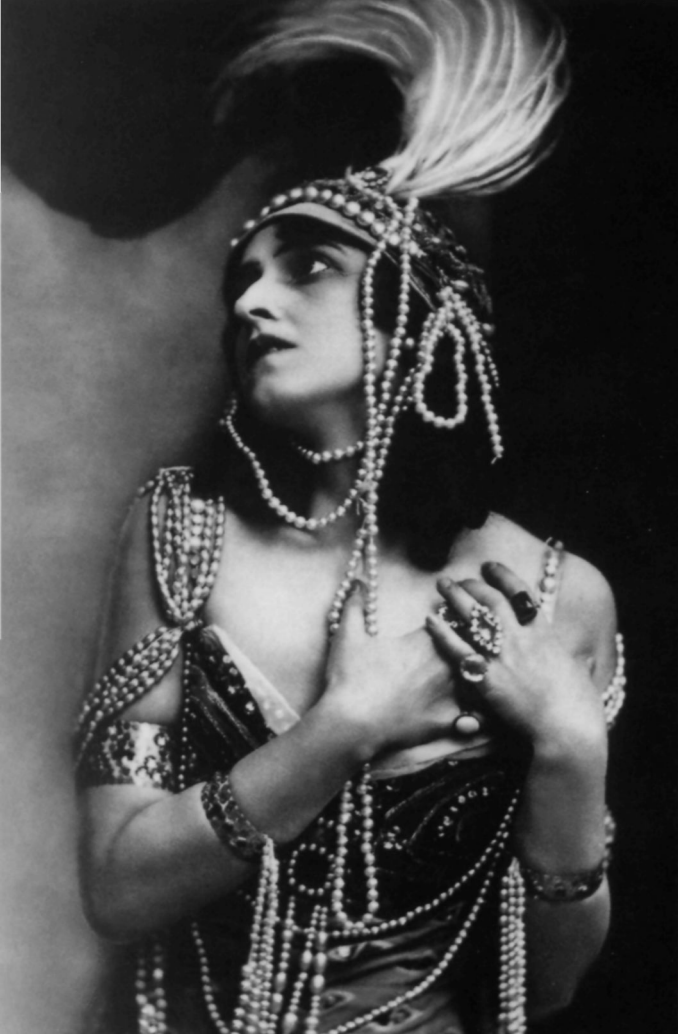
Вера Фокина в балете «Шехерезада», Вена, 1910