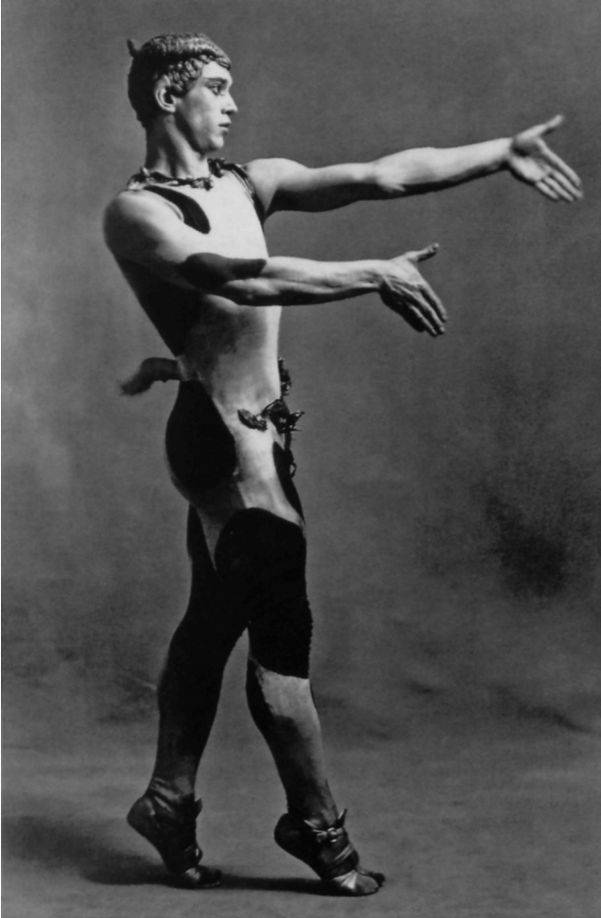
Вацлав Нижинский в балете «Послеполуденный сон фавна», Париж, 1912 Vaclav Nijinsky in "L'après-midi d'un faune", Paris, 1912