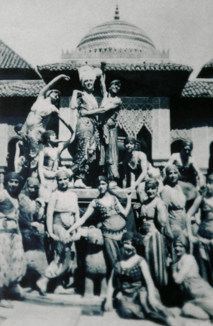
Любовь Чернышёва с артистками кордебалета в костюмах к балету «Шехерезада», Гренада, 1916 Lubov Tchernisheva with the corps-de-ballet in the costumes for "Sheherazade", Granada, 1916