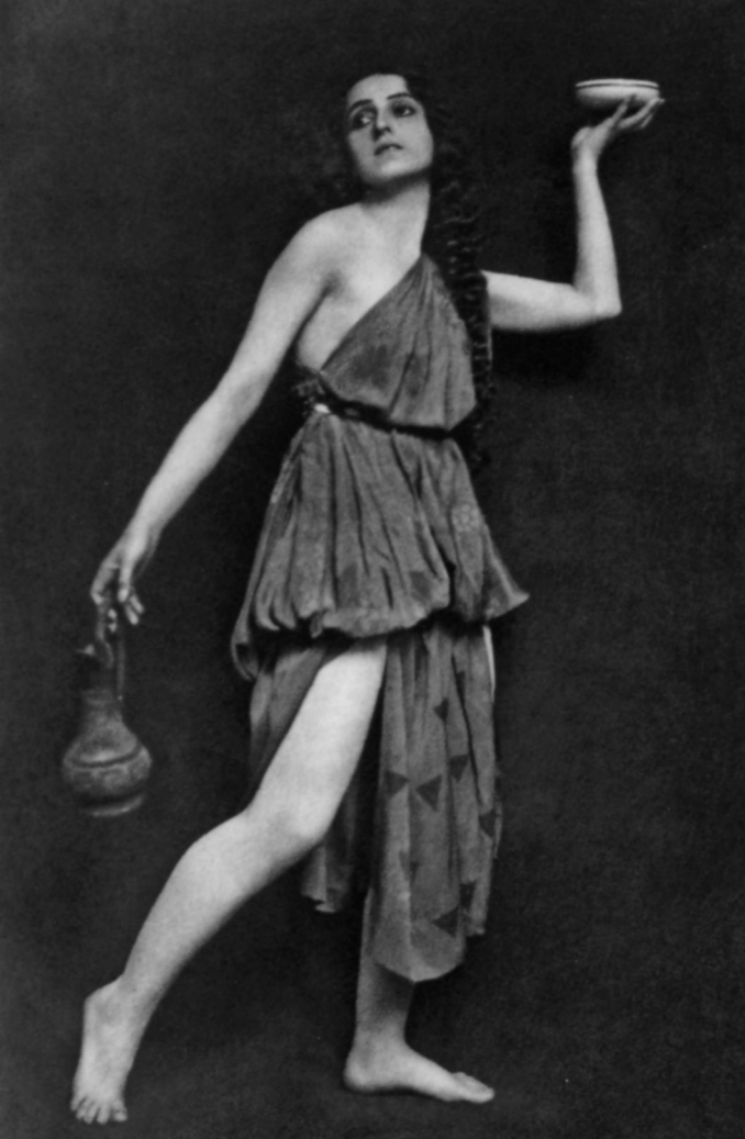
Вера Фокина в балете «Дафнис и Хлоя», Париж, 1911 Vera Fokina in "Daphnis and Chloe" Paris, 1911