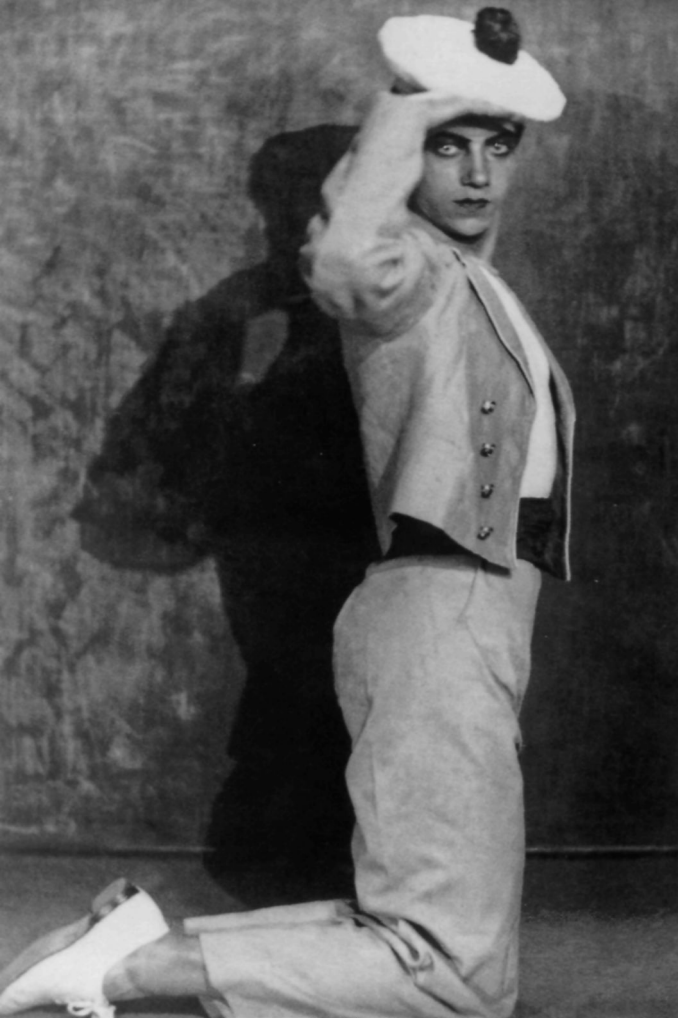
Серж Лифарь в балете «Матросы», Париж, 1925 Serge Lifar in "Les Matelots", Paris, 1925