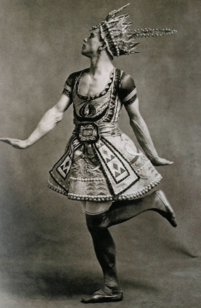
Вацлав Нижинский в балете «Синий Бог», Париж, 1912 Vaclav Nijinsky in "Le dieu bleu", Paris, 1912