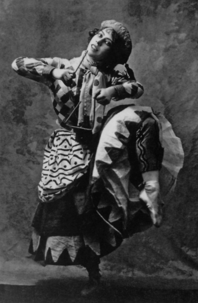
Бронислава Нижинская в балете «Петрушка», Париж, 1911 Bronislava Nijinskaya in "Petrushka", Paris, 1911