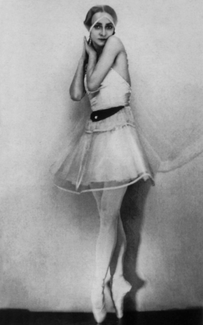
Ольга Спесивцева в балете «Кошечка», Монте-Карло, 1927 Olga Spessivtseva in "La Chattel", Monte Carlo, 1927