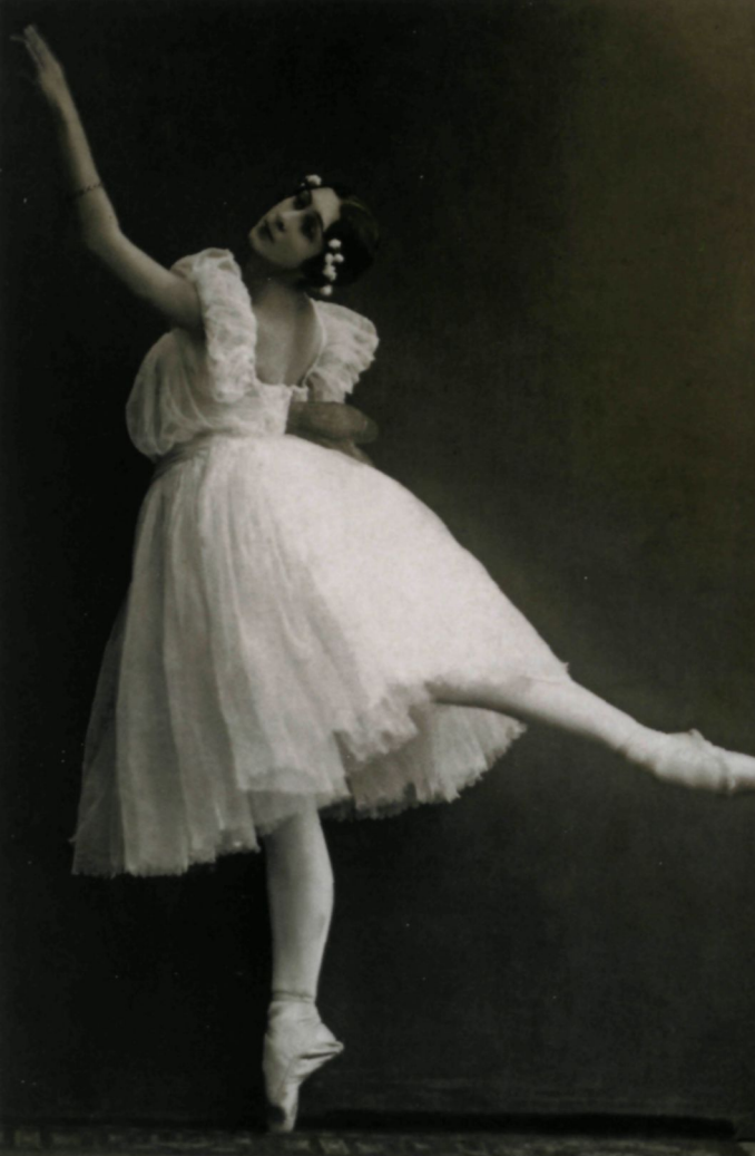
Фелия Дубровская в балете «Сильфиды», СПб., 1917 Felia Dubrovskaya in "Les Sylphides", St. Petersburg, 1917