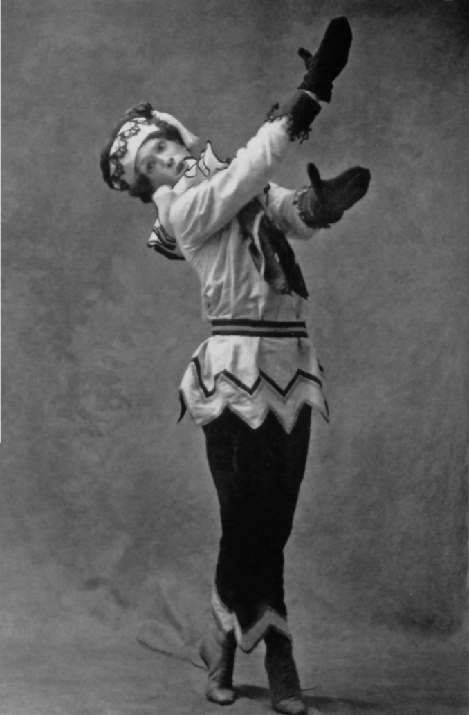
Вацлав Нижинский в балете «Петрушка», Париж, 1911 Vaclav Nijinsky in "Petroushka", Paris, 1911