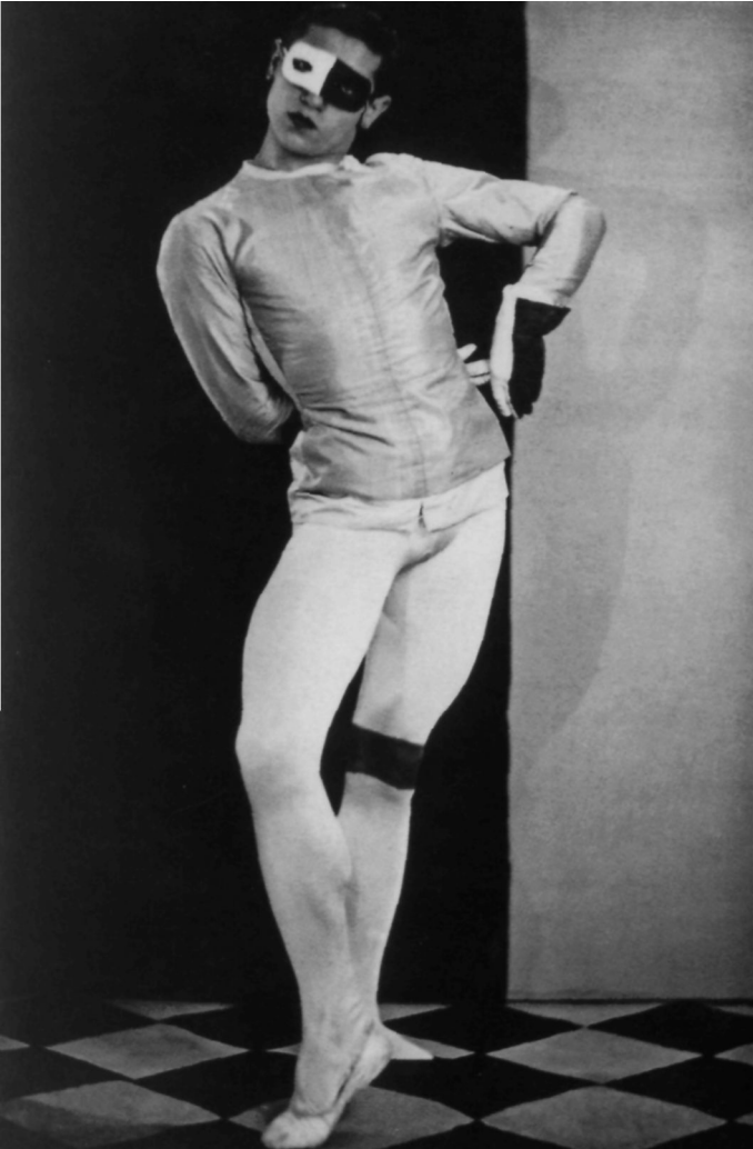
Серж Лифарь в балете «Ромео и Джульетта», Монте-Карло, 1926 Serge Lifar in "Romeo and Juliet", Monte Carlo, 1926