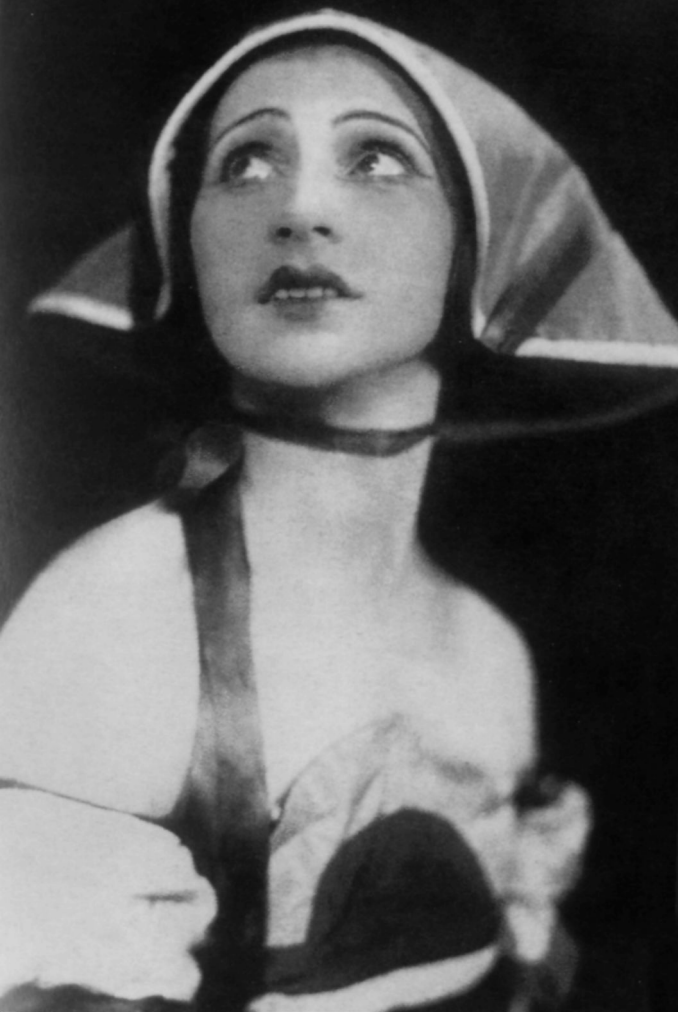
Вера Немчинова в балете «Искушение пастушки», Лондон, 1923 Vera Nemchinova in "Les tentations de la bergere", London, 1923