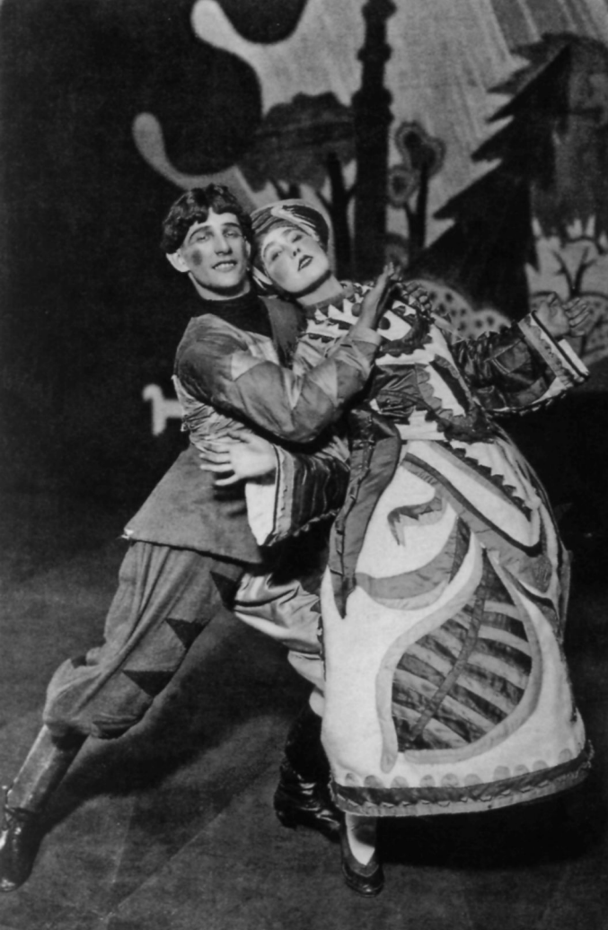
Тадео Славинский и Лидия Соколова в балете «Шут», Лондон, 1921

Thadeo Slavinsky and Lydia Sokolova in "Le Chout", London, 1921