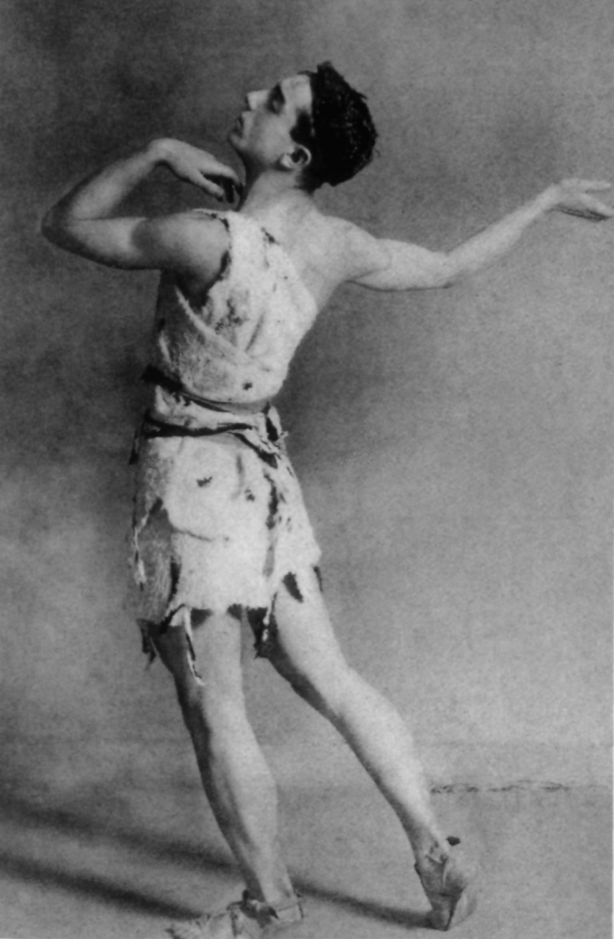
Леонид Мясин в балете «Легенда о Святом Иосифе», Париж, 1914 Leonid Massin in "St. Joseph's Legend", Paris, 1914