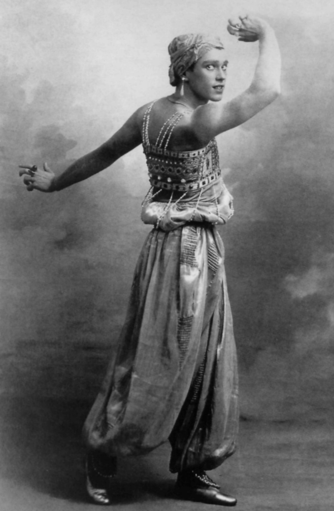
Вацлав Нижинский в балете «Шехерезада», Париж, 1910 Vaclav Nijinsky in "Sheherazade", Paris, 1910