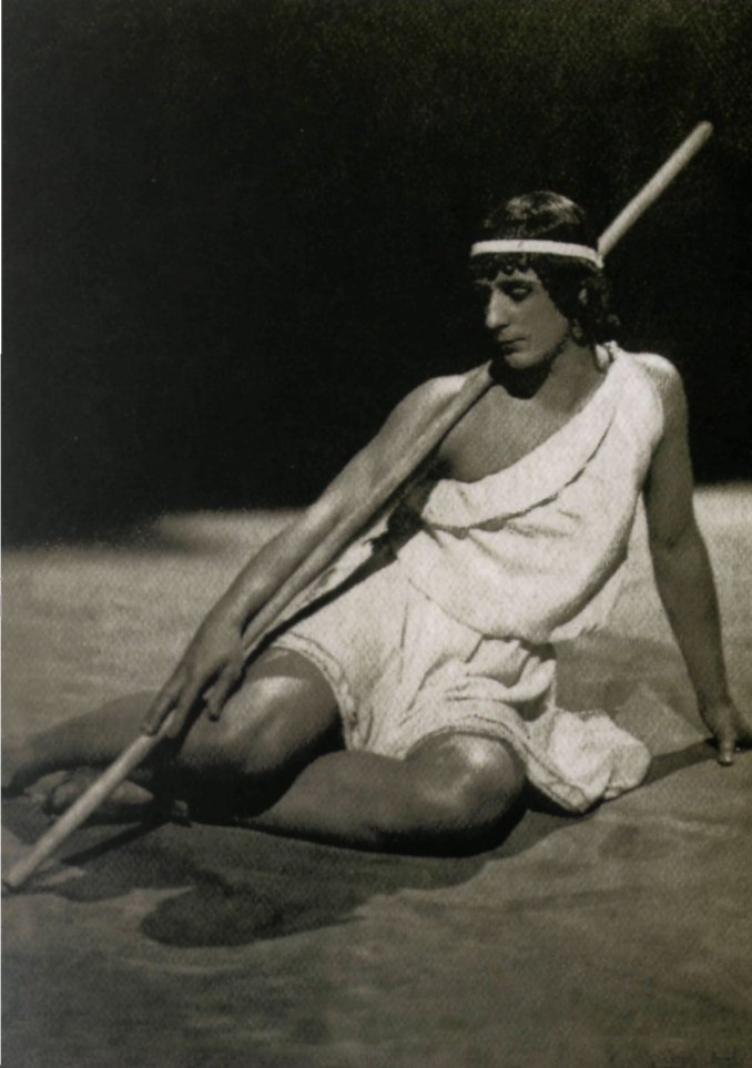
Михаил Фокин в балете «Дафнис и Хлоя», Париж, 1911 Michael Fokin in "Daphnis and Chloe", Paris, 1911