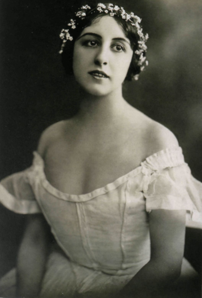
Любовь Чернышёва в балете «Сильфиды», Нью Йорк, 1916 Lubov Tchernisheva in "Les Sylphides", New York, 1916