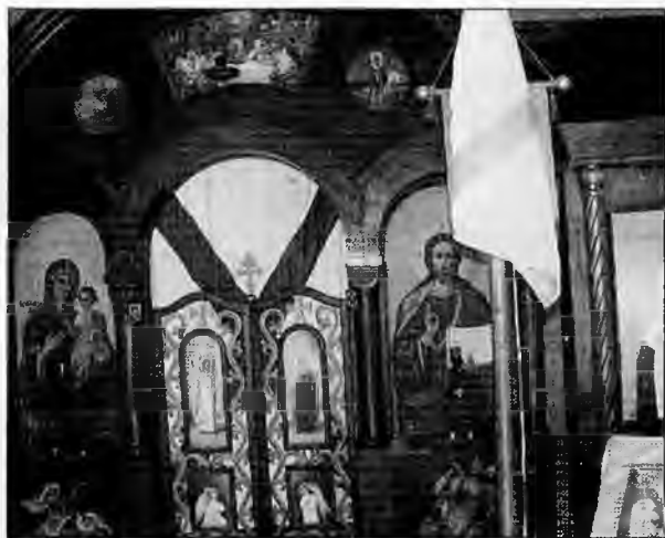
Внутреннее убранство храма Святого Благоверного Великого Князя Александра Невского в Бизерте