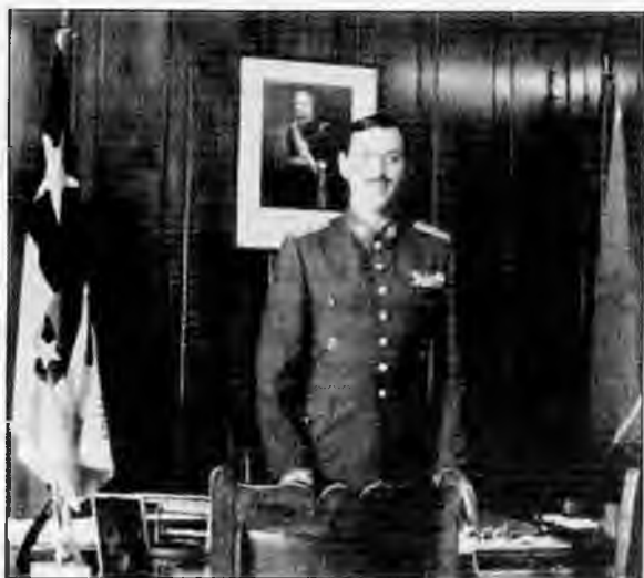
Бригадный генерал армии Чили казак Мигель Краснов