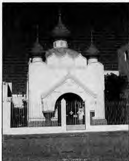
Храм Святого Благоверного Великого Князя Александра Невского в Бизерте