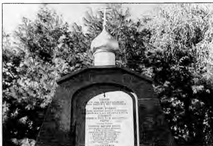
Памятник кадетам на Ново-Дивеевском кладбище в штате Нью-Йорк, США