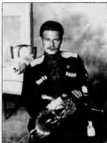
А.Г. Шкуро в 1920-е гг.