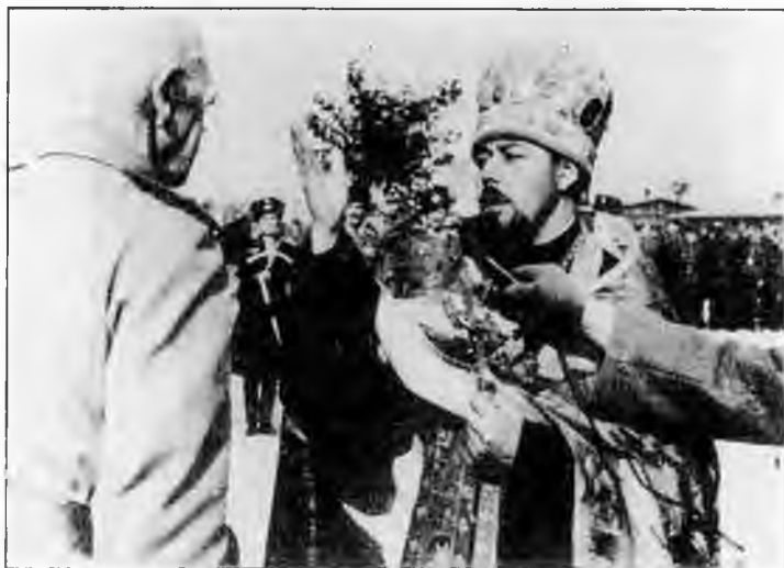
Генерал Краснов и дивизионный священник 1-й Казачьей дивизии