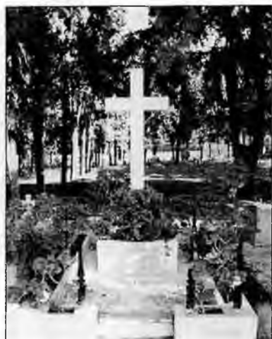
Памятник русским морякам в Бизерте