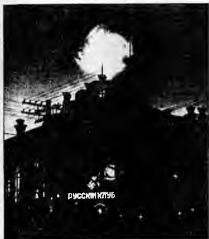
Штаб-квартира Всероссийской фашистской партии (ВФП) в Маньчжурии