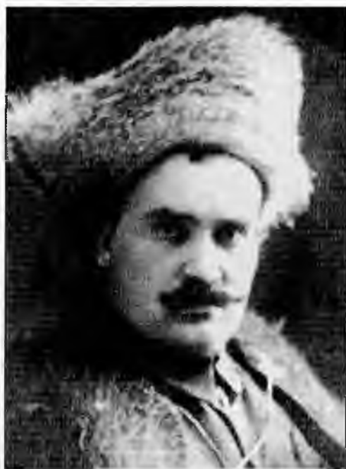
Г.М. Семенов в 1920-е гг.