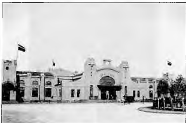
Станция Харбин в 1924 г.