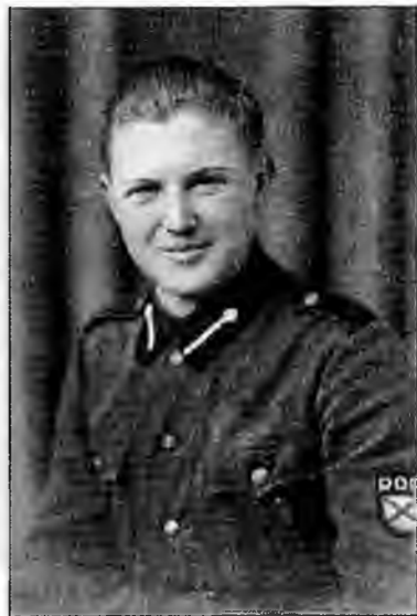
Рядовой Русской освободительной армии (РОА)