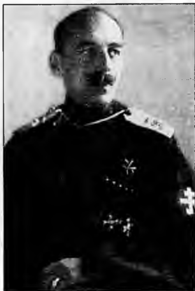
П.Р. Бермонт-Авалов — один из руководителей Центральной организации русских националистов (ЦОРН), возникшей в Германии в 1933 г.