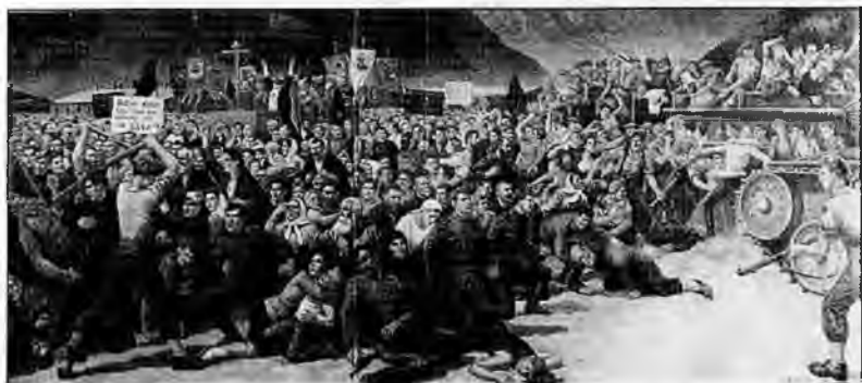
Картина «Выдача казаков в Лиенце». Художник С.Г. Корольков