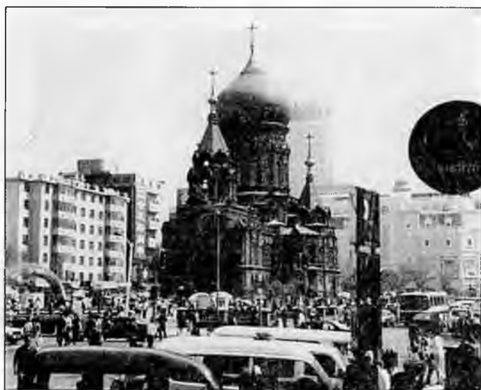
Современный Харбин — самый русский из китайских городов