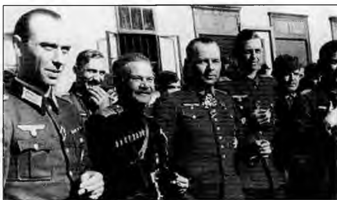
А.Г. Шкуро и Г. фон Панвиц