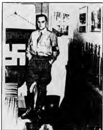
А.А. Вонсяцкий в оружейной комнате