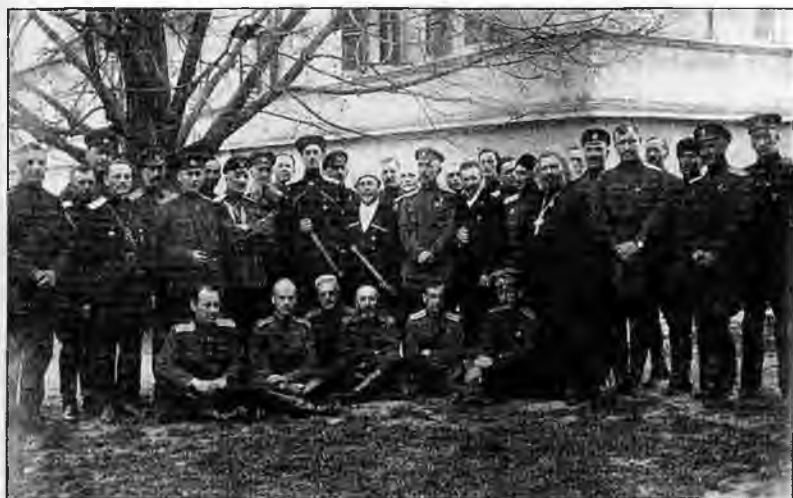
Генерал Врангель со своим штабом. Смоленские Карловцы. 1925 г.