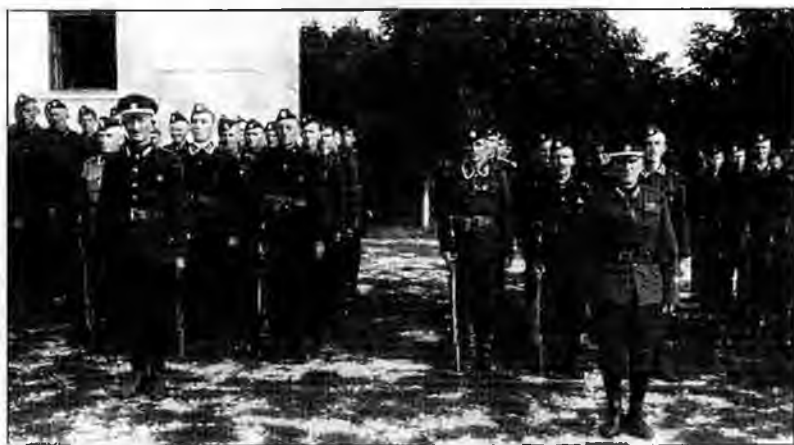
Смотр 5-й сотни 4-го полка Русской охранной группы. Белград. Август 1942 г.