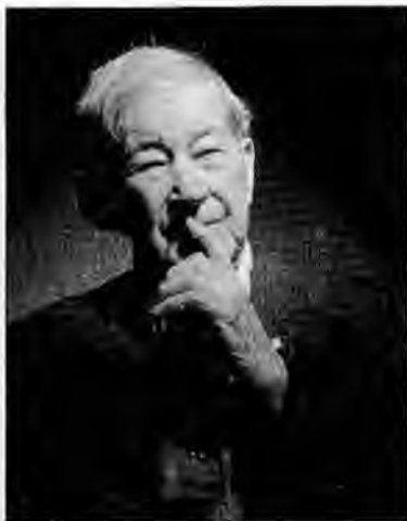
Федоров Н.В. (1901—2003) — последний белый воин