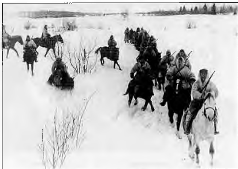
Белые казаки снова в строю