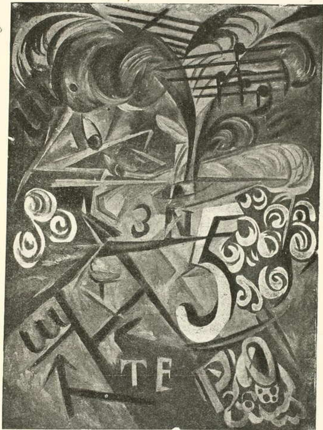
Дама въ шляпѣ.