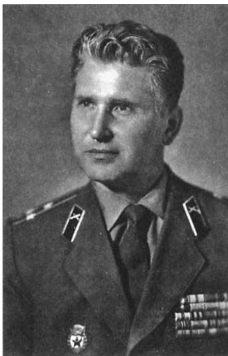
Я — военный пенсионер. 1978 г.