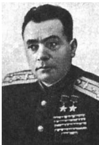
Д. А. Драгунский, полковник, командир 55-й танковой бригады