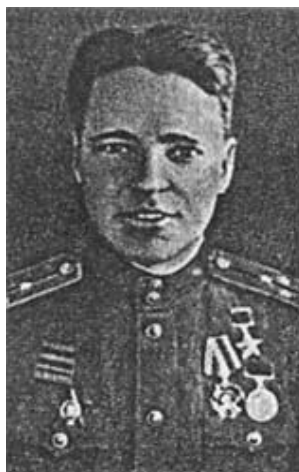
В. Н. Подгобрунский, знаменитый разведчик 1-й ГТА