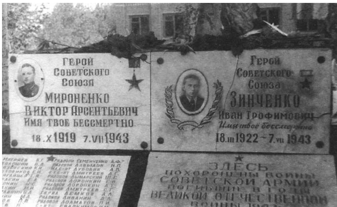
Могилы Героев Советского Союза, погибших на Курской дуге в 1943 г. Село Сырцово. Курская область