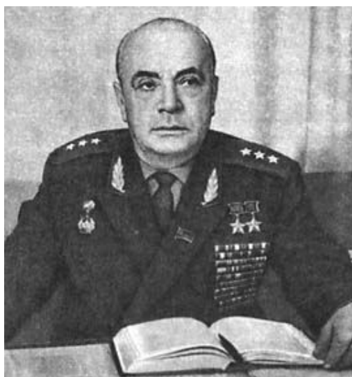
Д. А. Драгунский. В отставке. 1975 г.