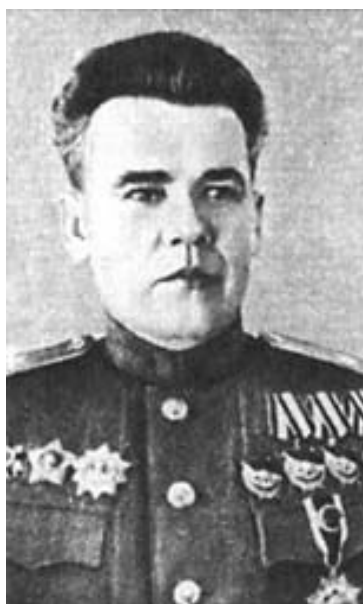
И. Ф. Фролов, генерал, командующий артиллерией 1-й ГТА