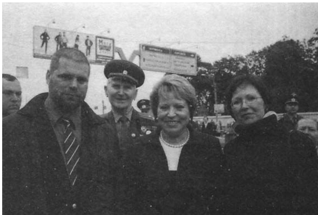
Празднование Дня памяти (12 сентября 2005 г.) небесного покровителя Санкт-Петербурга святого князя Александра Невского. Губернатор города В. И. Матвиенко (вторая справа).