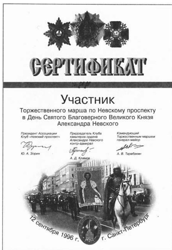
Сертификат. Участник Торжественного марша по Невскому проспекту в День Святого Благоверного Великого Князя Александра Невского