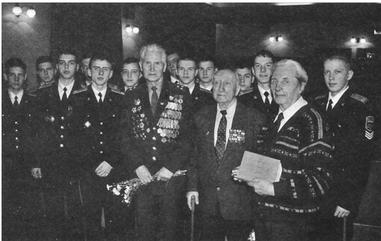
Встреча с суворовцами. День Советской Армии. Санкт-Петербург. 2002 г.