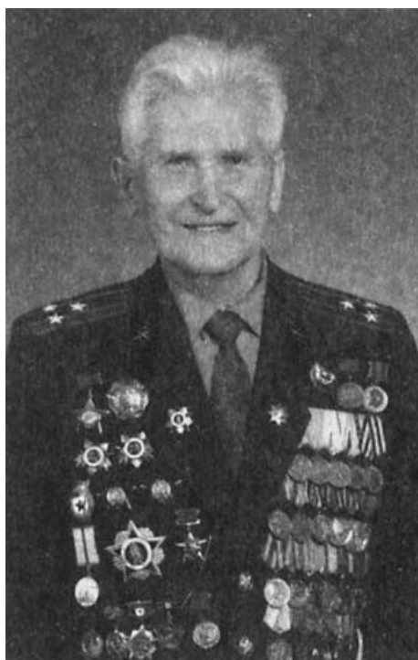
Не стареет душой ветеран. 2005 г.