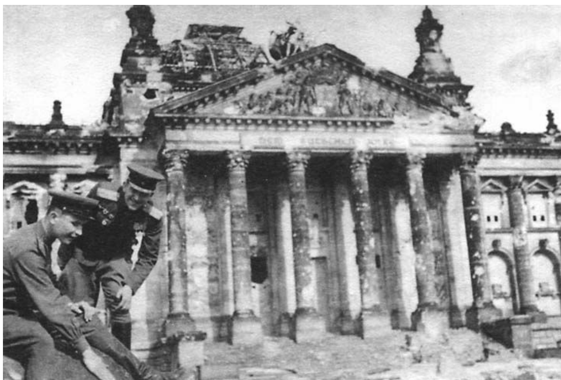
Дошли до Рейхстага. Берлин. 1945 г.