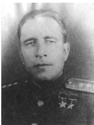
М. Е. Катуков генерал-полковник. Конец 40-х годов