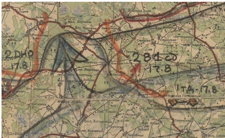
Фрагмент «Карты боев на левом фланге Лужской укрепленной позиции в период прорыва противника на фронте 48 армии на 19 августа 1941 г.».