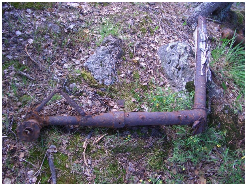
Стойка шасси истребителя, лежавшая на мысу

увеличивающейся частотой стучавшие по лобовому стеклу машины, вскоре переросли в непрекращающийся ливневой поток.