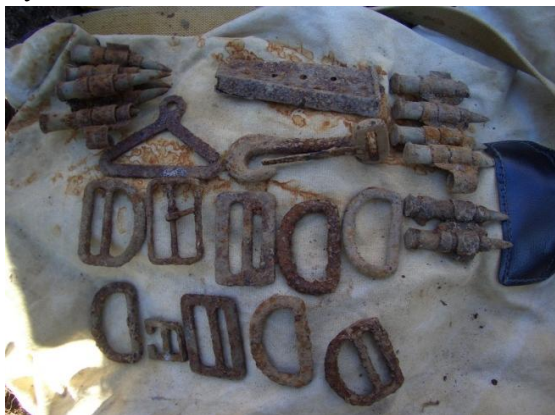
Найденные на месте падения фрагменты парашютной системы и обойма от пистолета ТТ

Как только мы начали снимать грунт, стало понятно, что самолет после падения, а, возможно и до, сильно горел – слой почвы на месте кабины был черным от гари. При этом в нем постоянно попадались разорванные патроны калибров 7,62 миллиметра и 12,7 миллиметра, сплавленные в каплевидные сгустки силуминовые детали, почерневшие и оплавленные куски плексигласа, а также обожженные мелкие куски алюминиевой обшивки самолета. Но самое главное, в слое гари