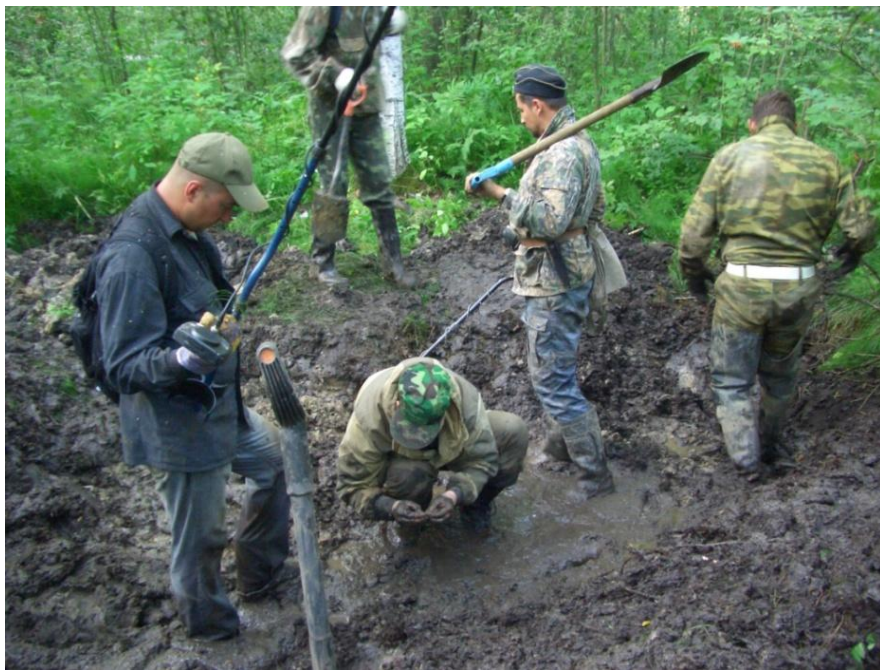
Завершающий этап работы в воронке