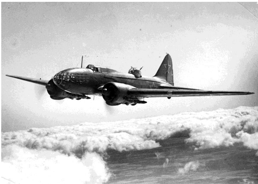
Бомбардировщик Ил-4 в полете