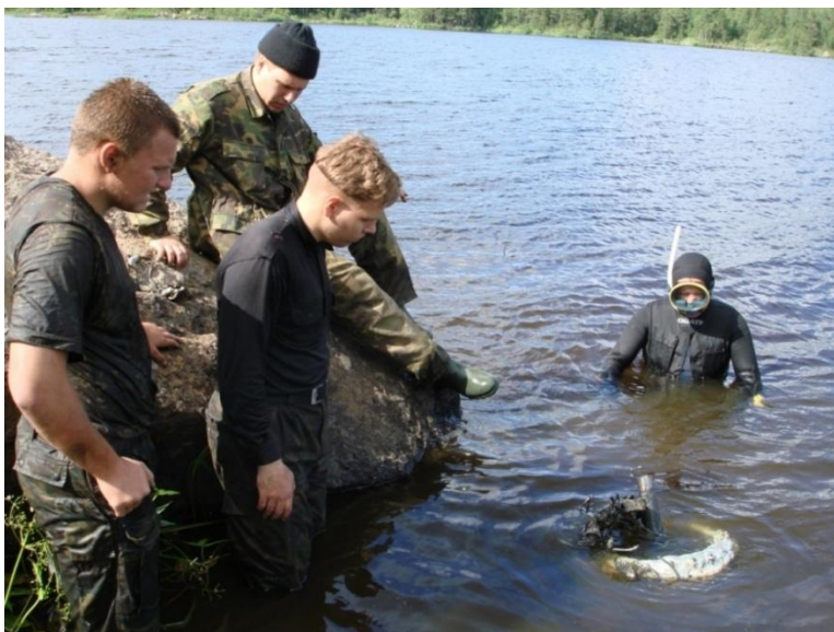
Двигатель показался из воды

ливались на истребители Ла-5. За месяц рабочие завода производили 750 моторов М-82 и 100 моторов М-62, то есть почти 30 единиц в день!