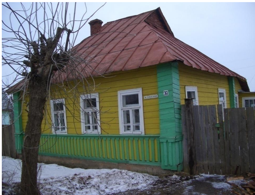
Дом № 39 по Совхозной улице. Примерно так же он выглядел в 1941 году