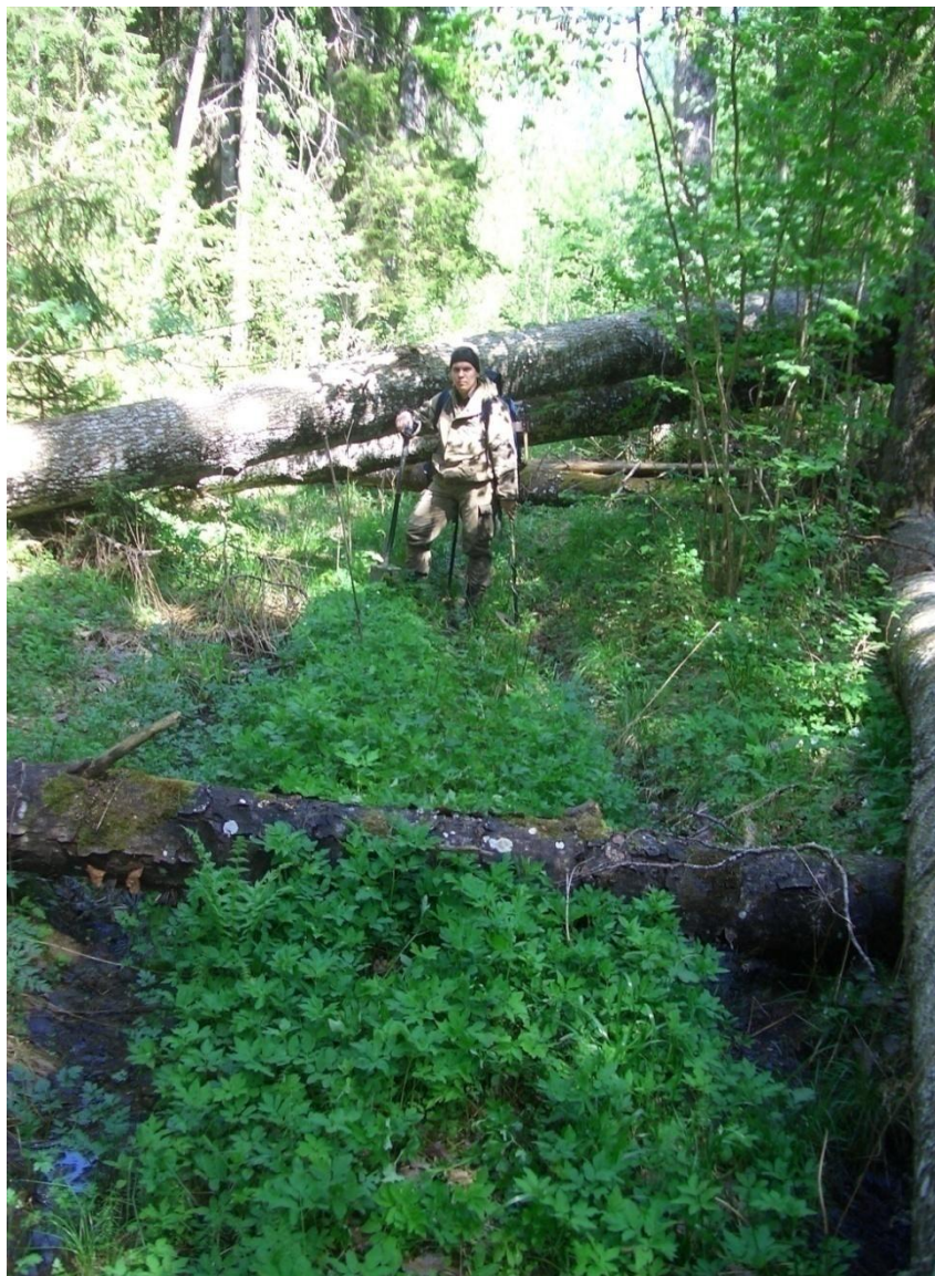
Автор на дороге Большое Замощье – Молотки

Не сумев проехать к Молоткам с севера, мы поняли, что придется возвращаться на киевское шоссе, чтобы, проехав через Толмачево, попытаться попасть на урочище с юго-запада, со стороны деревни Боль-