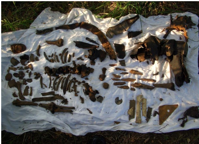
Собранные со дна останки летчика и его личные вещи

удачей – сосна в полметра обхватом, за которую мы завели трос с лебедкой, начала крениться, а трос натянулся до такой степени, что угрожало лопнуть. Тогда было принято решение обкапывать двигатель прямо в воде, периодически совершая попытки стронуть его с места. Последующие несколько выходных были посвящены реализации этой задачи.