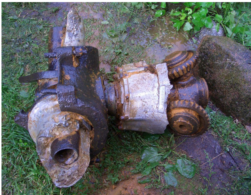
Редуктор одного из моторов