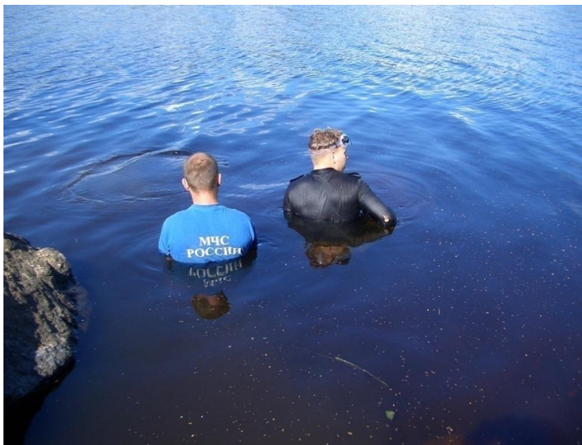
Работа на месте падения двигателя