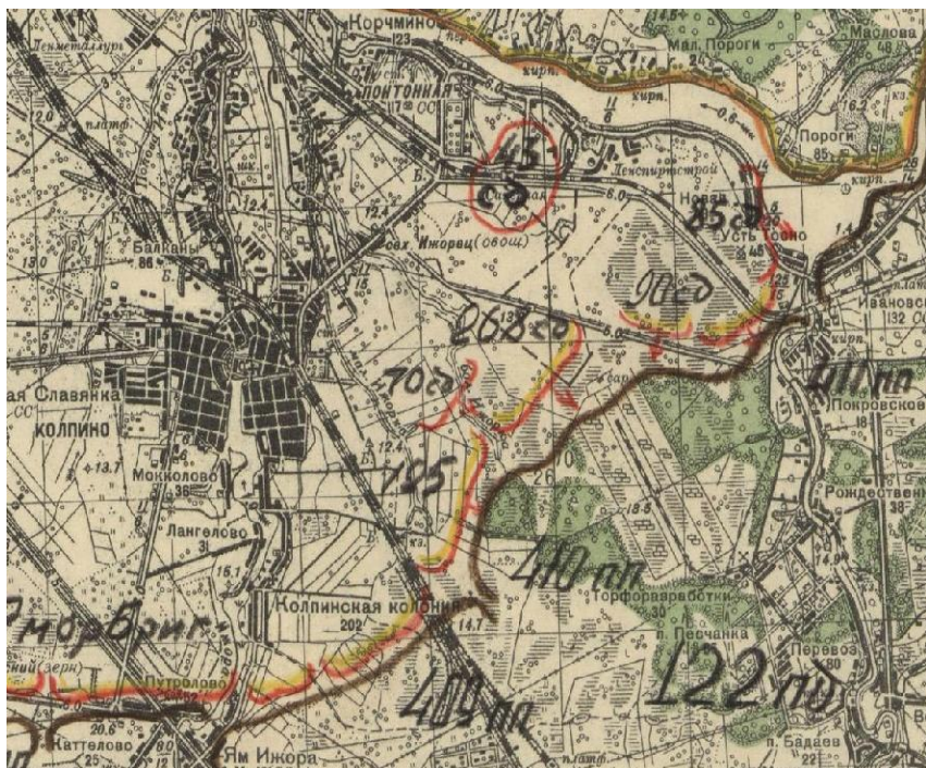
Положение частей, атаковавших немецкие позиции во втором противотанковом рву в ноябре – декабре 1941 года

Была предпринята попытка развить наступление и освободить Красный Бор, к тому времени хорошо укреплённый немцами. В наступлении приняли участие две роты 84-го танкового батальона. Танки наступали слева от железной дороги. Сапёры сделали проход через противотанковый ров, но он оказался слишком узким для КВ. Танки застряли, пехота понесла очень большие потери. Наступление оказалось безуспешным.