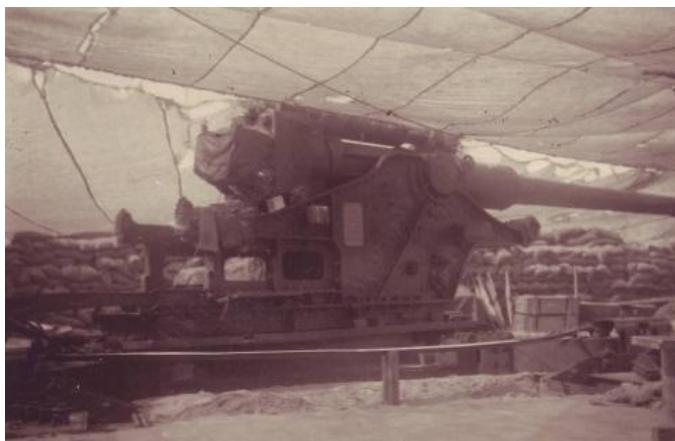
210-миллиметровая пушка К39 образца 1939 года

это знают и помнят. За указанный период АДД произвела по беззаботинской группировке 940 самолетовылетов...».