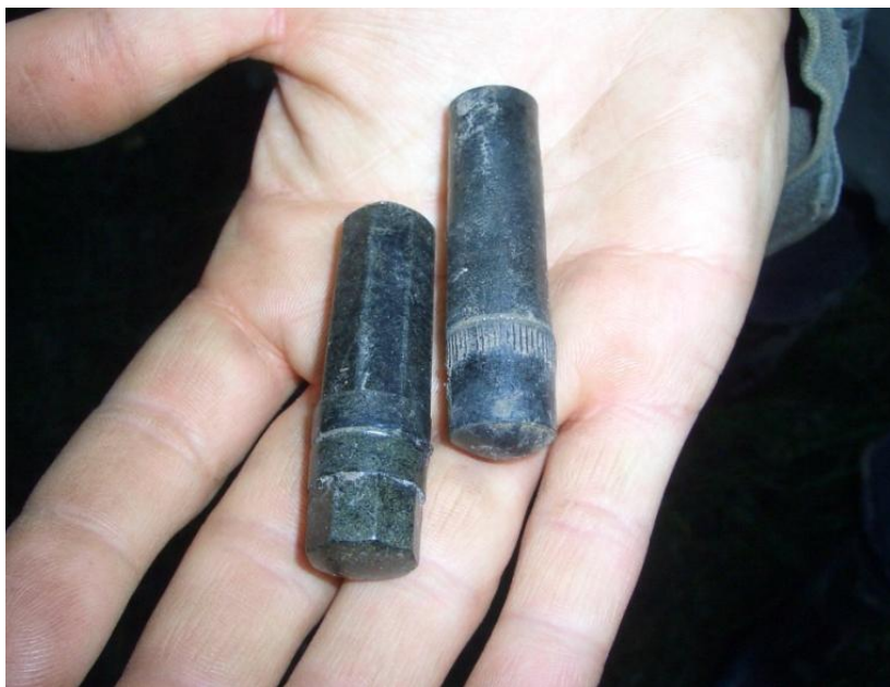
Медальоны – стандартный граненый и круглый, так называемый «блокадный»

Надо сказать, что, начиная с момента обнаружения медальонов, всех очень волновал вопрос о том, сохранились ли в них бумажные бланки? С одной стороны, вскрывать капсулу медальона в полевых условиях не рекомендуется (лучше как можно быстрее передать ее на экспертизу), а с другой – после извлечения капсулы из грунта нарушается ее природная консервация и открывается дополнительный, губительный для бумаги приток кислорода, поэтому медлить со вскрытием и прочтением вкладыша нельзя.