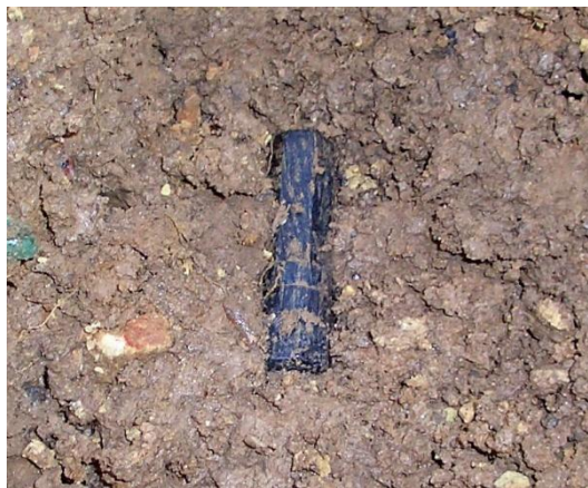
Долгожданная находка. Из глины показался первый медальон – невзрачная черная капсула около 5 сантиметров длиной