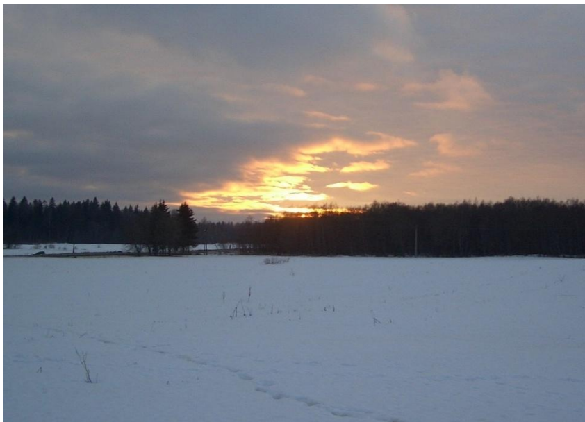
Закат над бывшим полем боя

Воодушевленные, мы закончили эксгумацию останков к половине одиннадцатого. К этому времени окончательно стемнело, и наши фигуры казались черными теньями на фоне сереющего снежного покрова.