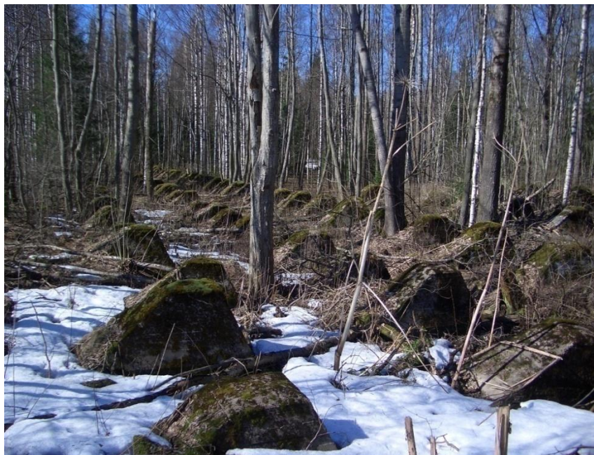
Линия ВТ. Противотанковые препятствия – надолбы у Сийранмяки

В этот же день частям 92-й стрелковой дивизии, ведущим бои восточнее, удалось прорвать линию ВТ у Кирьясало.