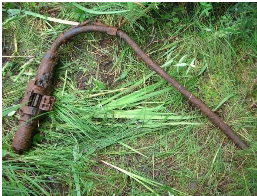
20-миллиметровая пушка ШВАК, деформированная при падении.

новленного на конкретный самолет или номера пистолетов, которые полагались каждому авиатору.