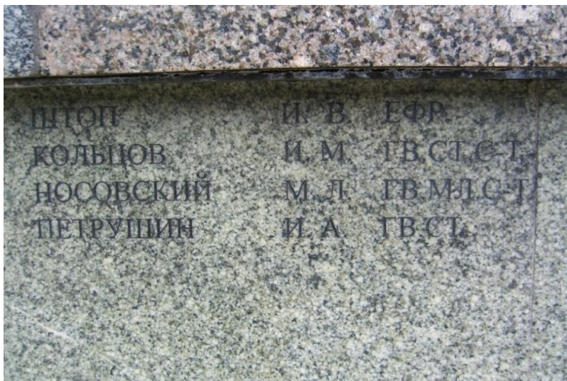
Данные об экипаже на одной из плит воинского мемориала в д. Гостилицы