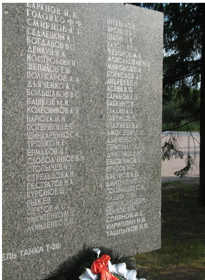
Фрагмент плиты с данными о похороненных на мемориале воинах