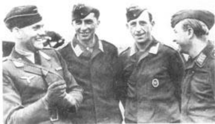
Обер-лейтенант, два унтер-офицера и ефрейтор в флигерблузах. У одного из унтеров на груди — вышитый знак стрелка-радиста.

дения наземного боя флигерблуза была не слишком подходящей одеждой. Даже цвет ее сливался с местностью хуже, чем армейский фельдграу. Яркие авиационные петлицы к концу войны стали заменять в авиаполевых частях на зеленые с окантовкой по службе, но этот процесс так и не был доведен до конца.