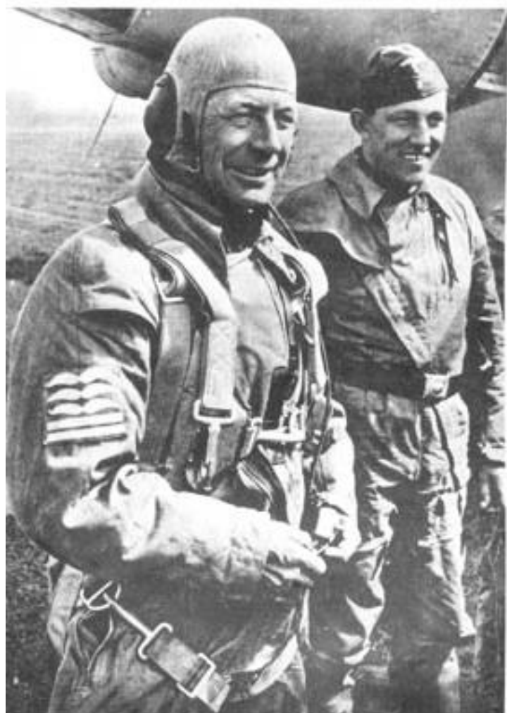
Полковник и унтер-офицер в летних полетных комбинезонах с нарукавными знаками различия. На полковнике — шлем с радиооборудованием и парашют с подвесной системой типа «Ирвинг».

овицами, низки брюк — «молниями» с шаговой стороны. На животе справа прорезался карман с вертикальной «молнией», два подобных кармана прорезались в боковых швах на уровне кистей рук, два немного выше колен. Спереди возле этих карманов нашивались большие накладные: верхние с острозрезанным открытым верхом и застежкой на пуговицу и прямоугольные нижние, прикрытые клапанами с мысиками и пуговицами. Комбинезон изготовлялся из тонкого коричневого или темно-серого авиационного брезента.