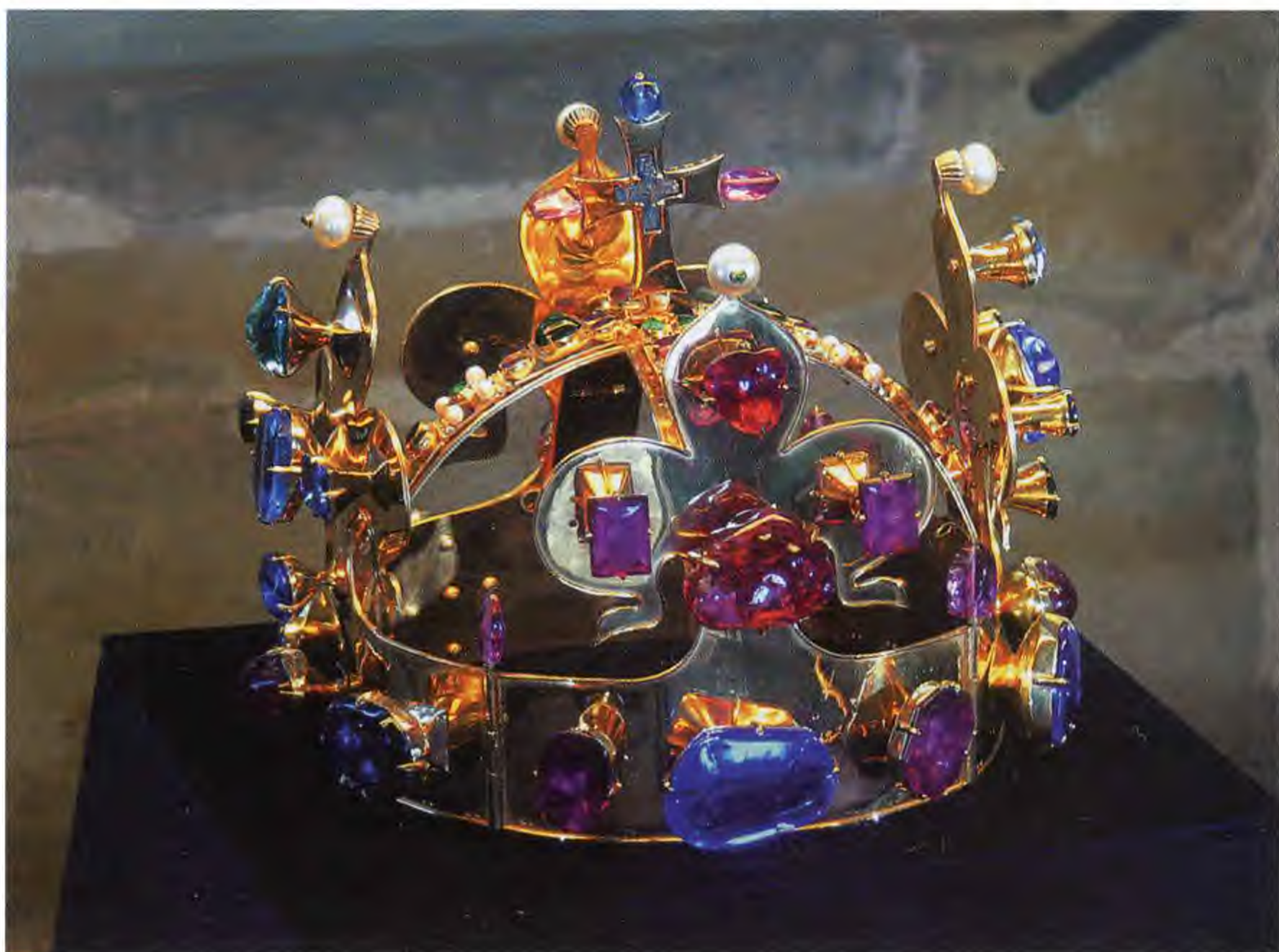
Корона Святого Вацлава. Пражская копия