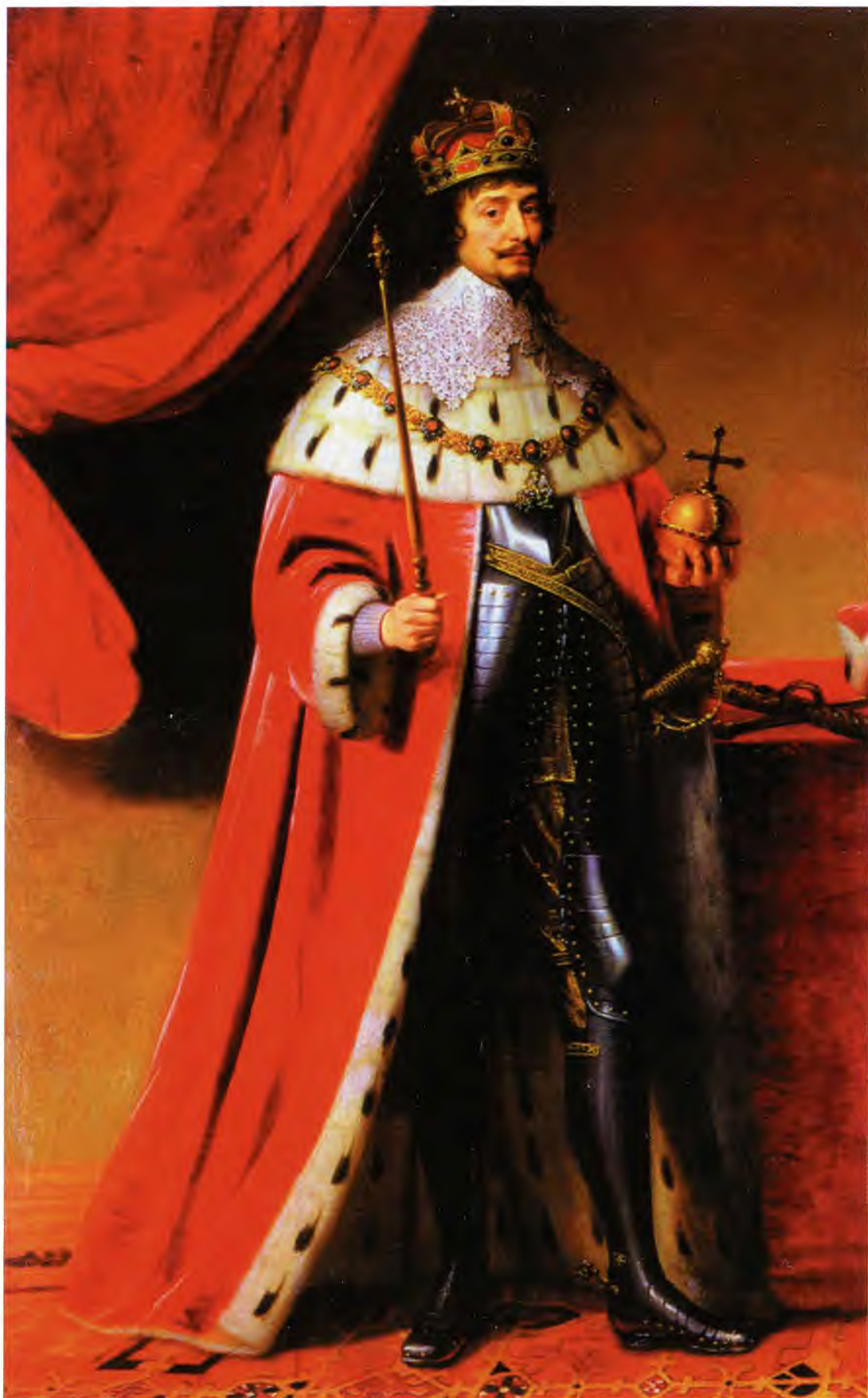
Император Священной Римской империи германской нации Фридрих V. Художник Г. Ван Хон Хорст