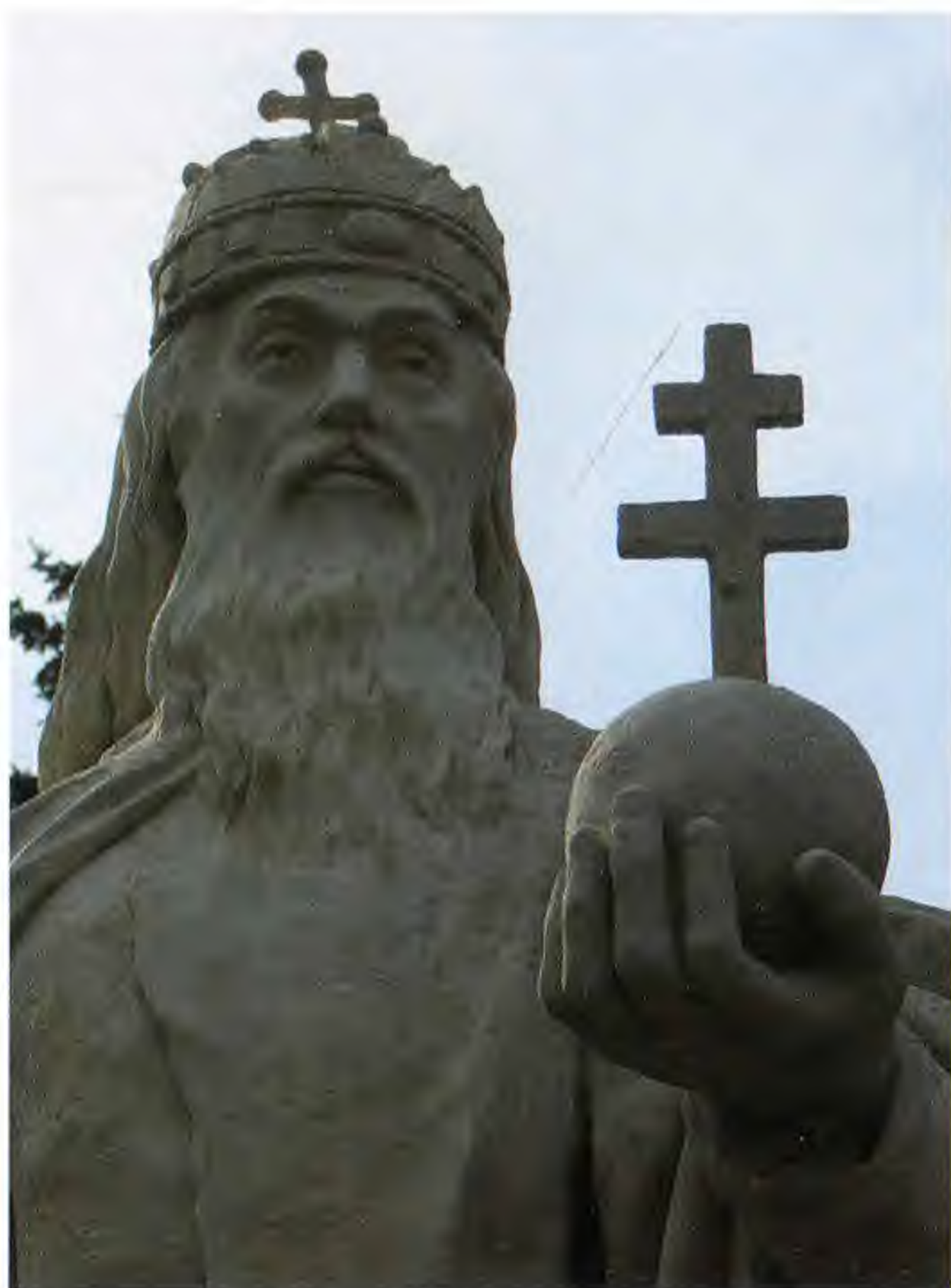
Статуя Святого Стефана в Эстергоне