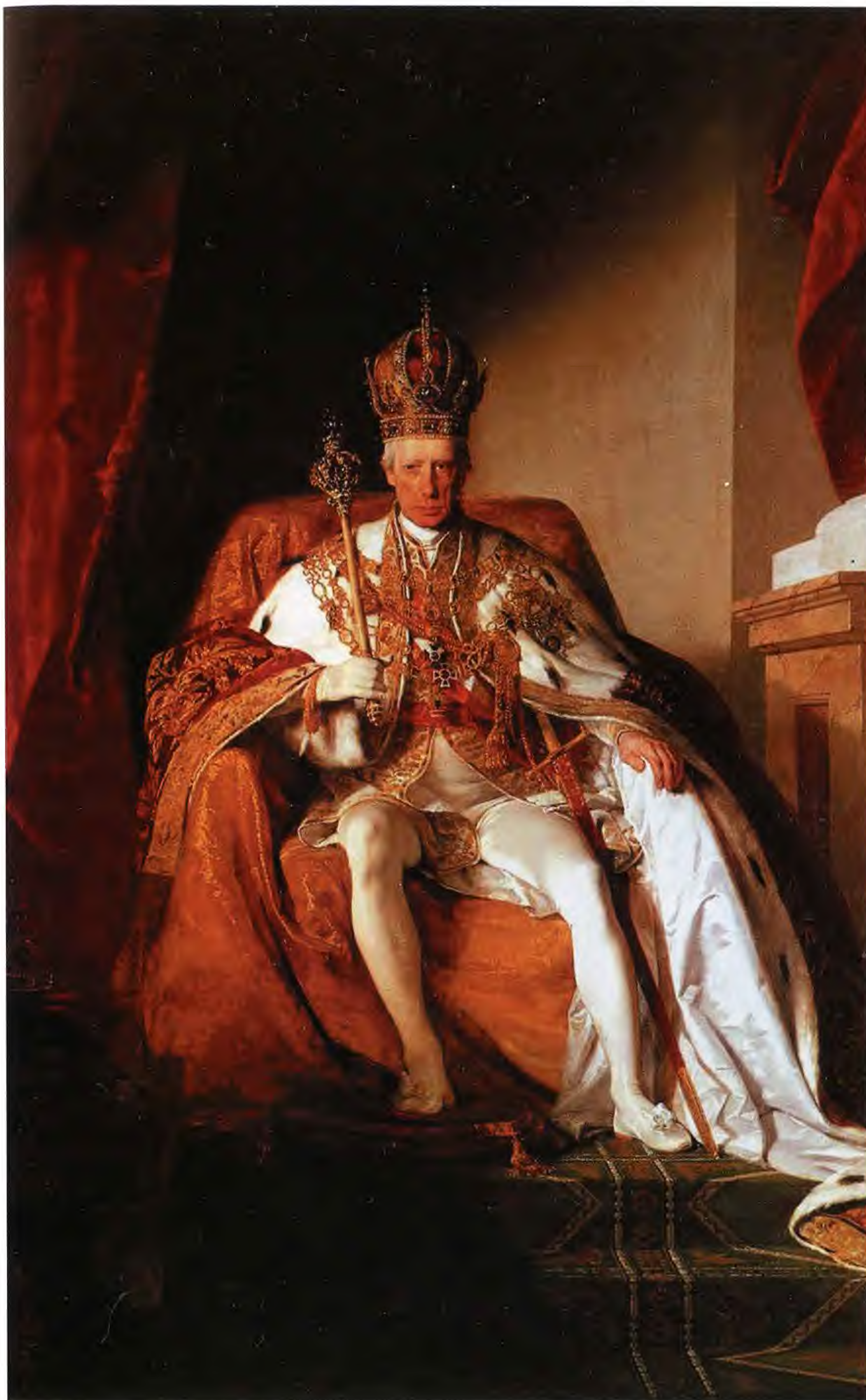
Император Священной Римской империи германской нации Франц I. Художник Ф. фон Амерлинг