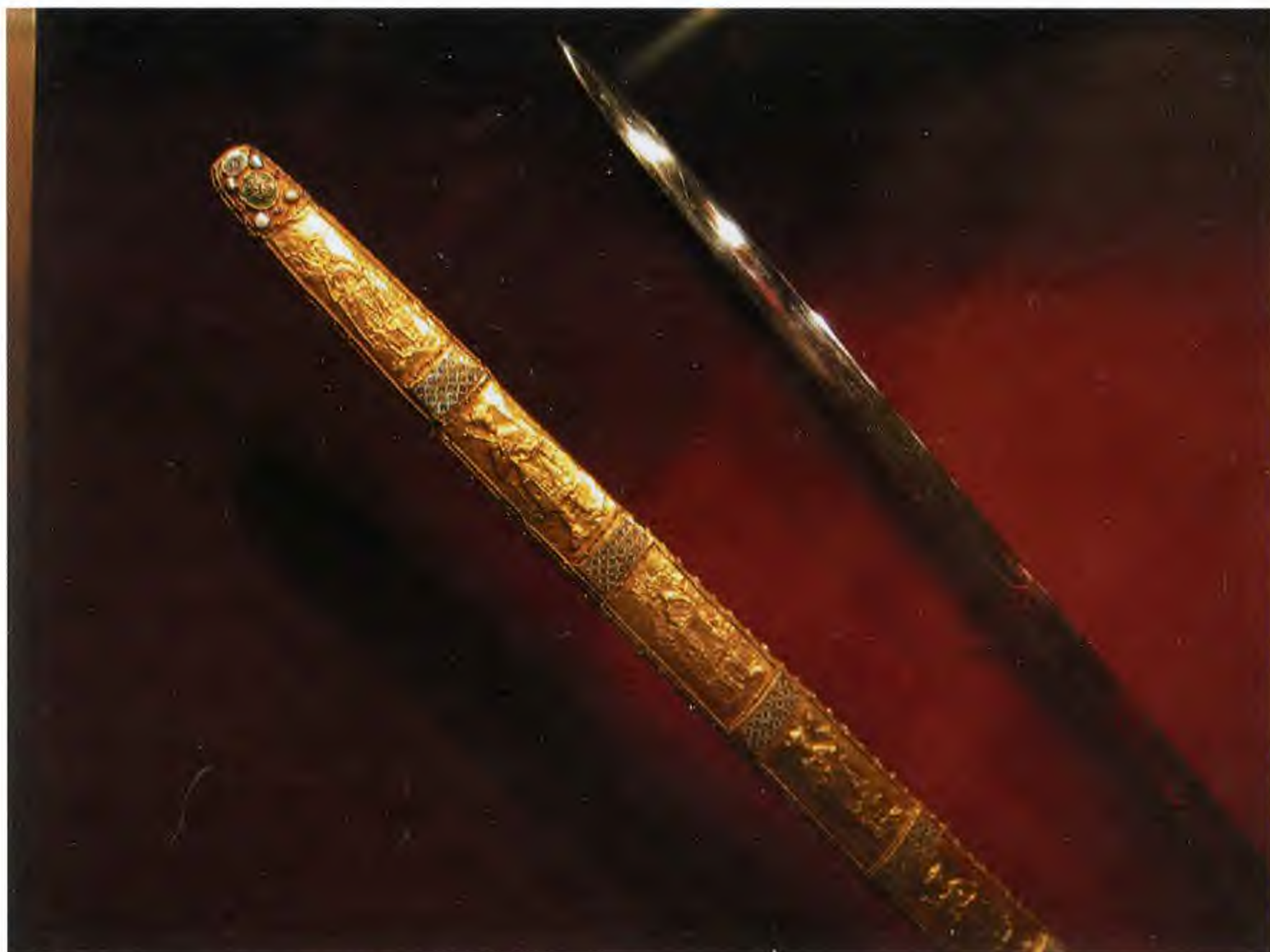
Имперский меч и ножны