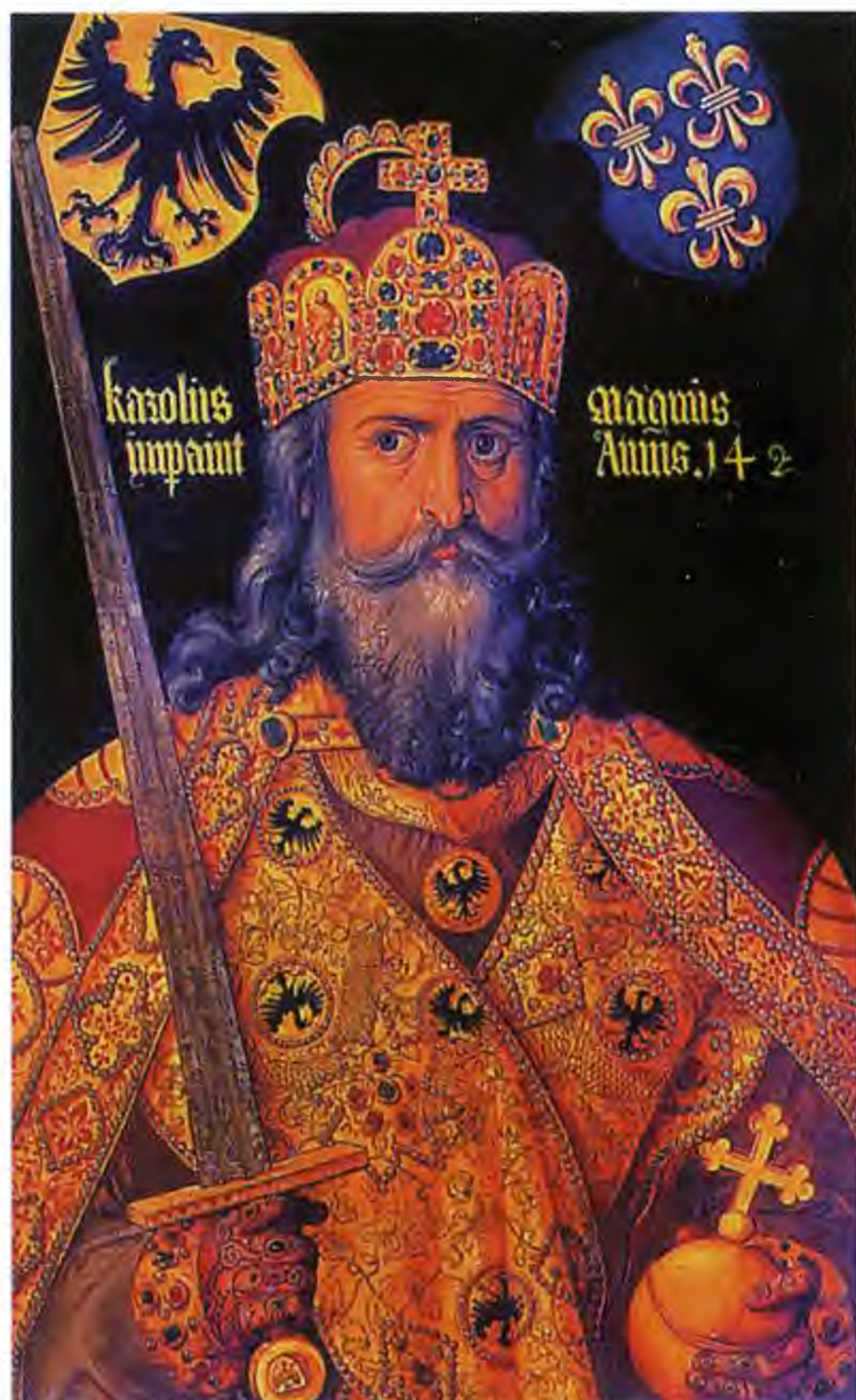
Карл Великий. Копия с картины А. Дюрера