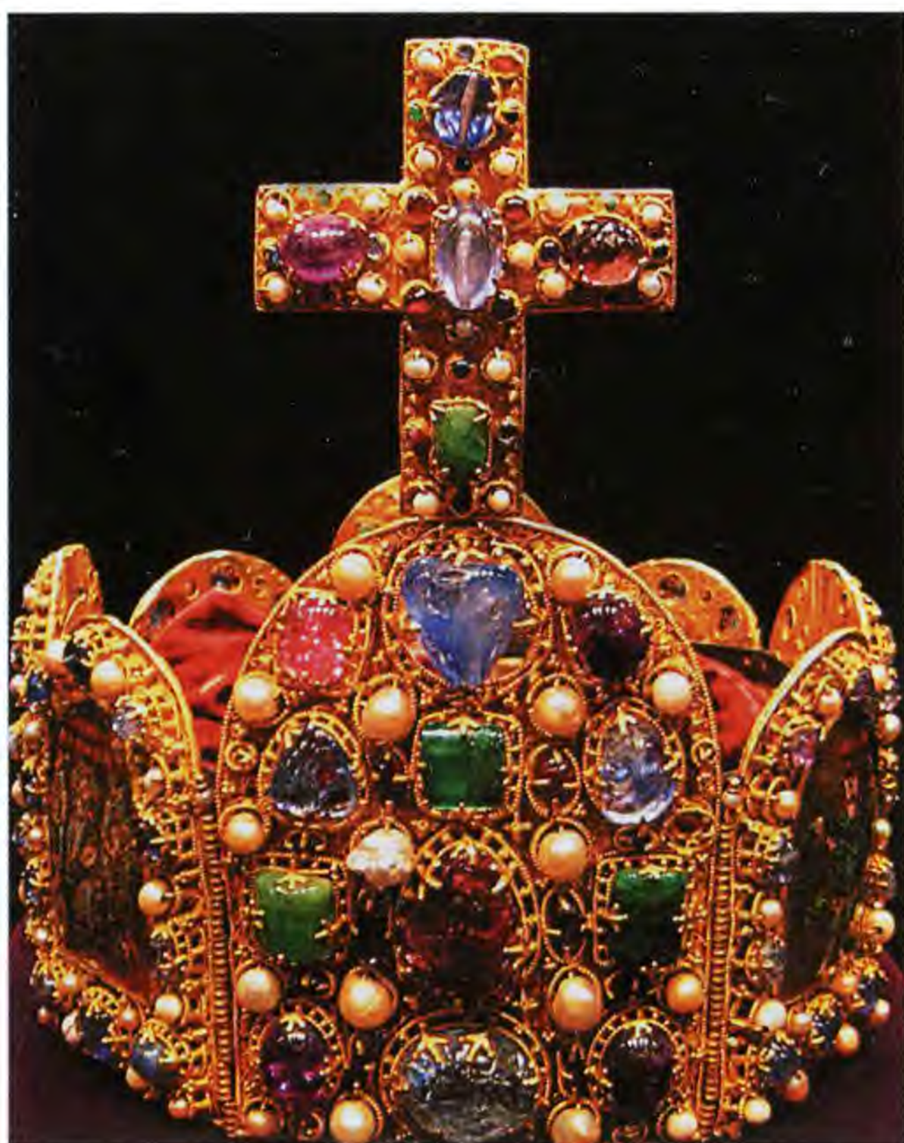
Корона Священной Римской империи германской нации