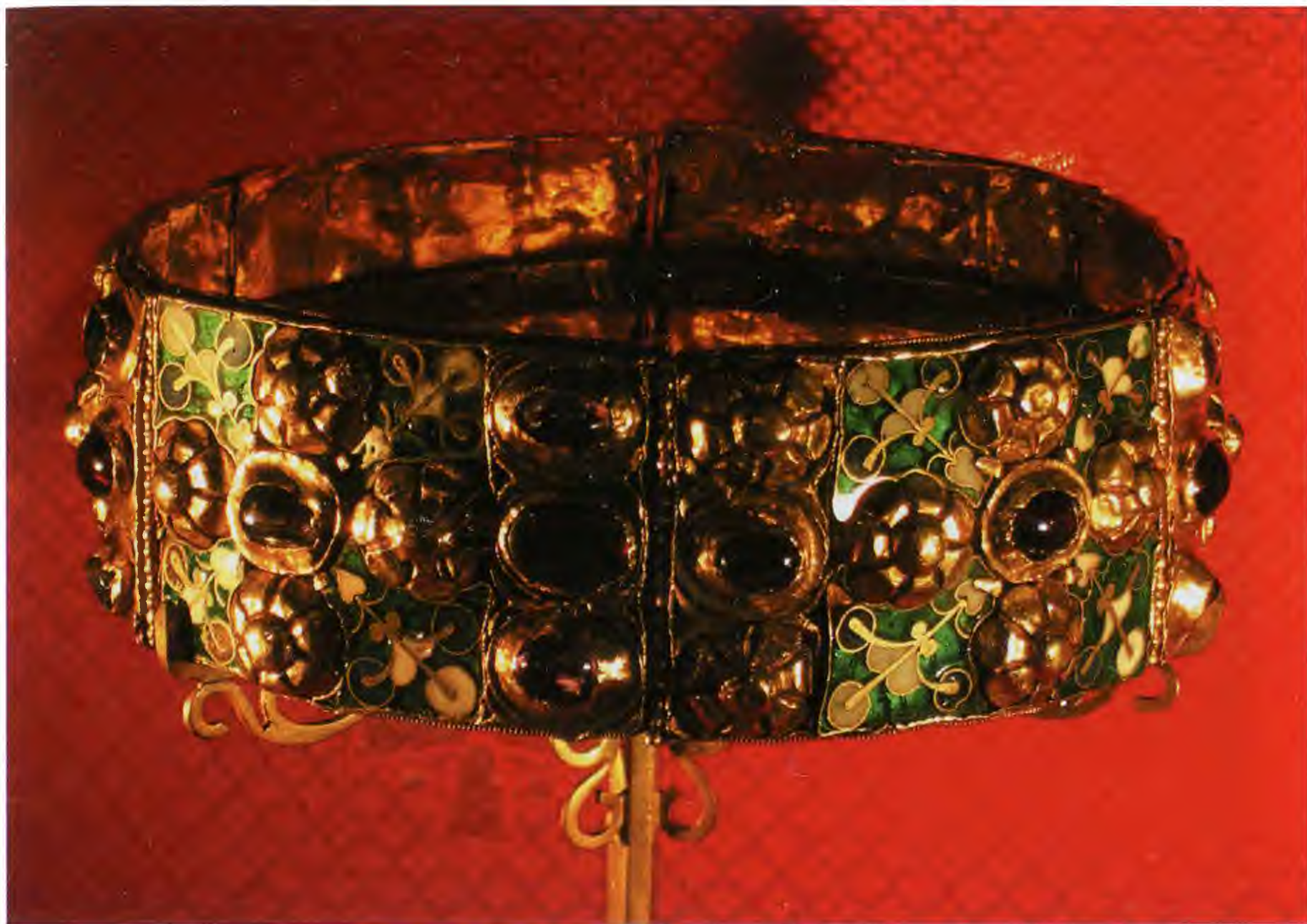
Железная корона Ломбардии