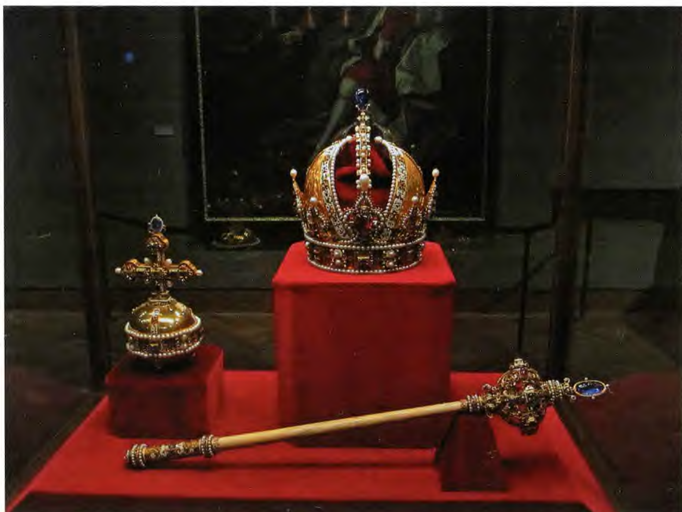
Имперские регалии из Хофбурга