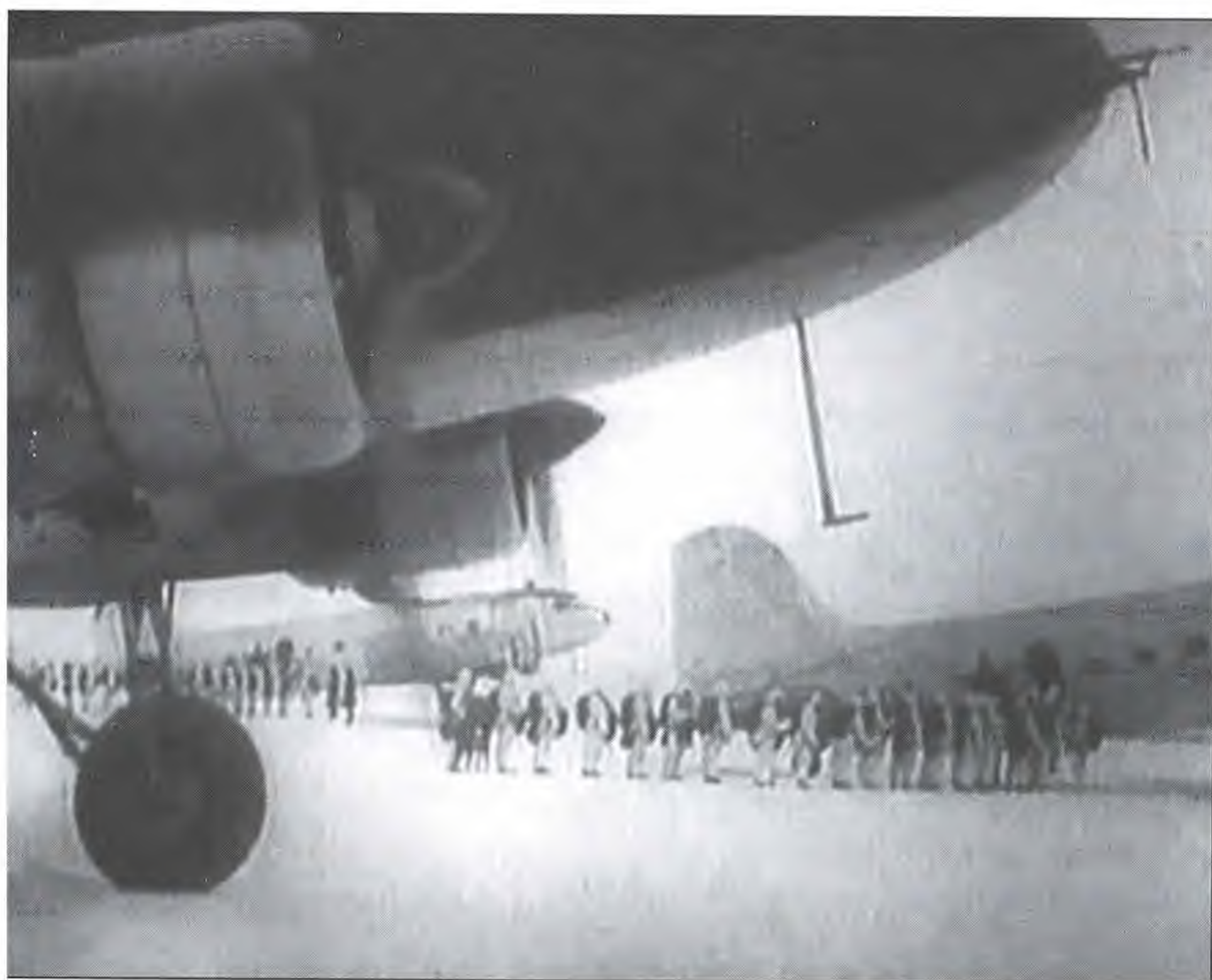
Учения ВДВ в 1950-е гг.