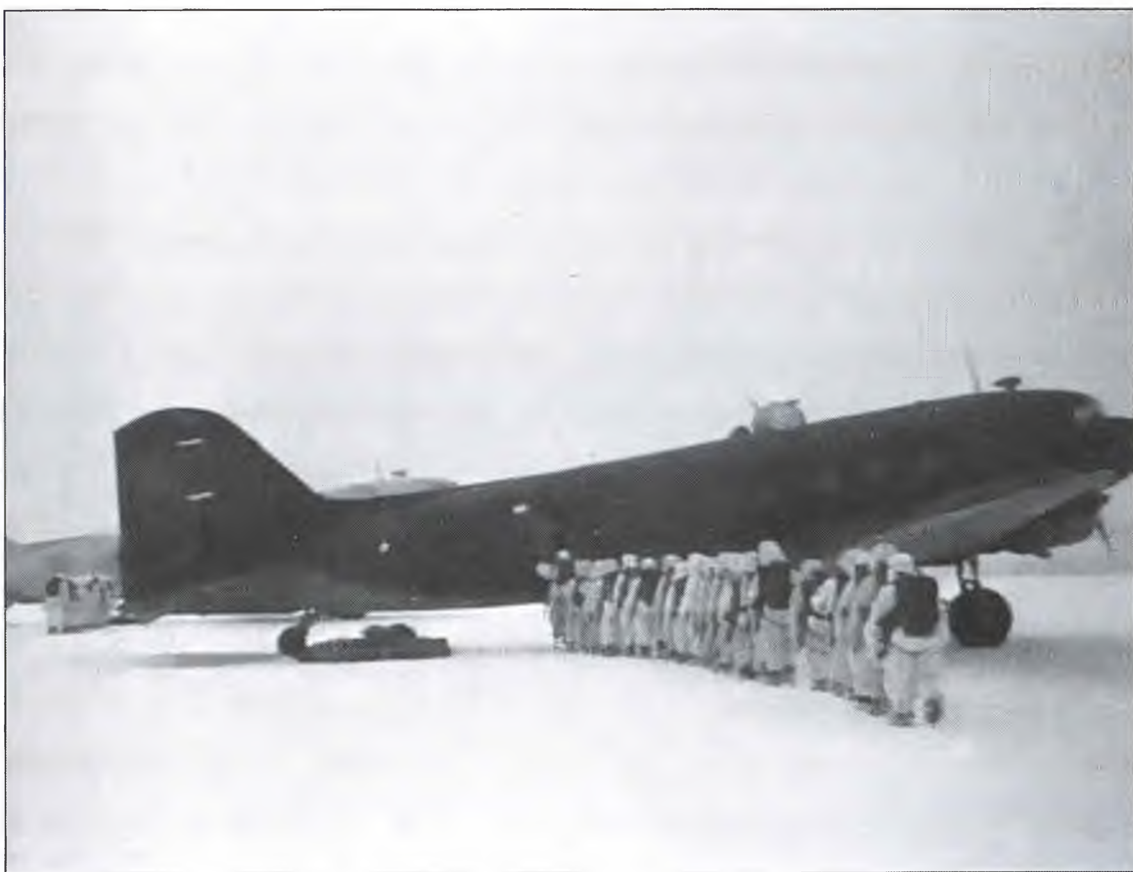
Погрузка в «Дуглас»