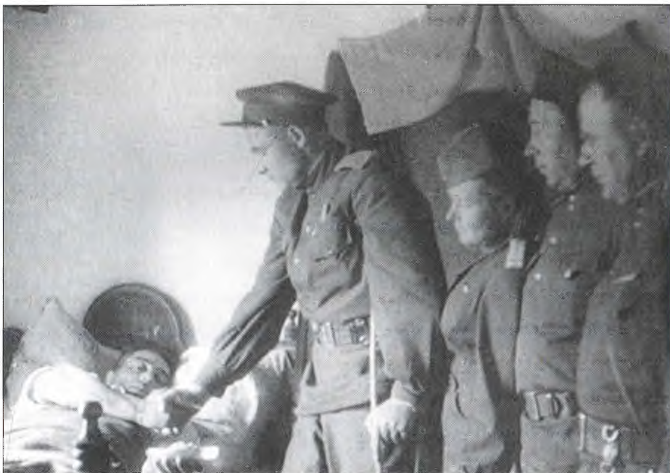
В.Ф. Маргелов в годы Великой Отечественной войны