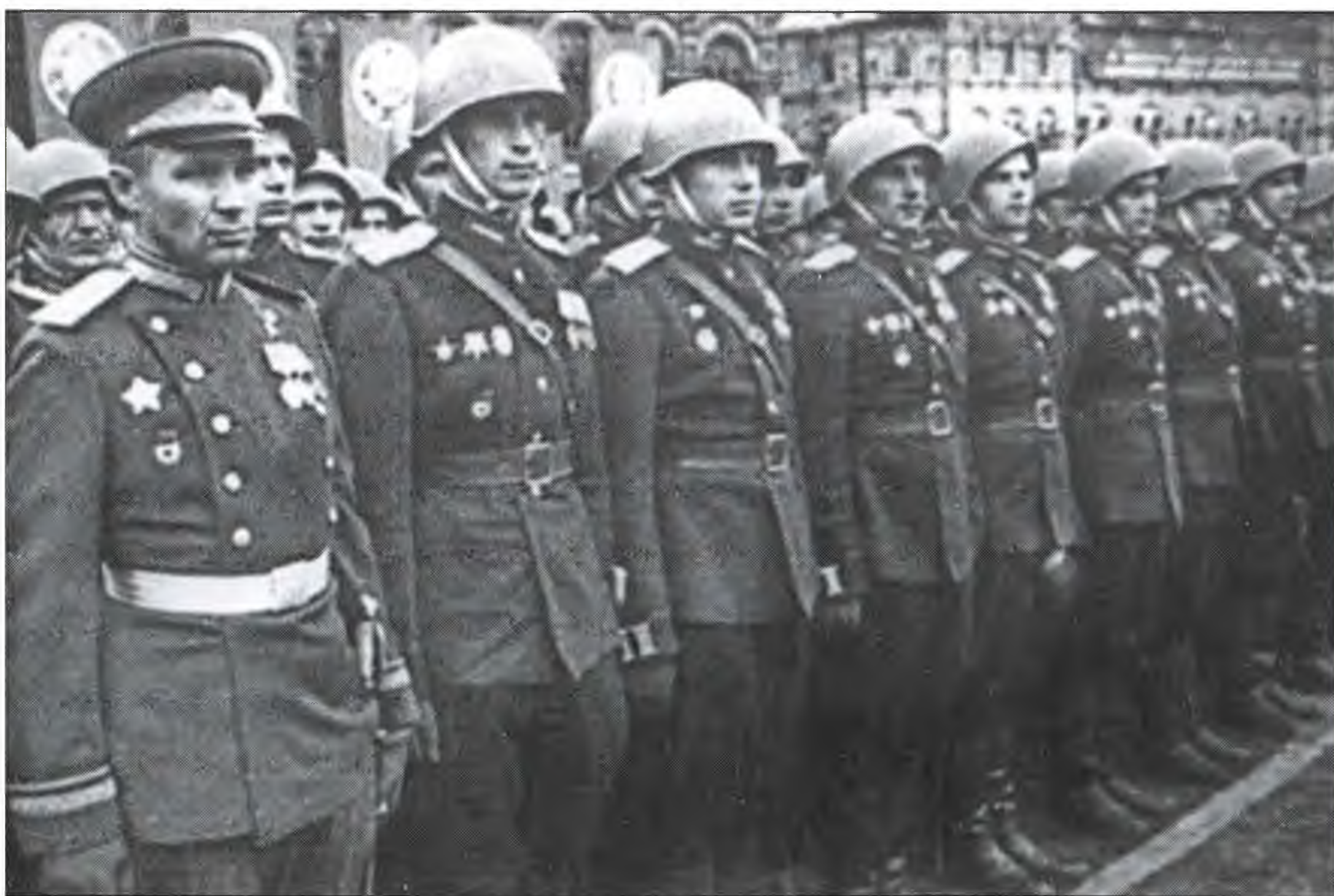
Маргелов на Параде Победы, 24 июня 1945 г.