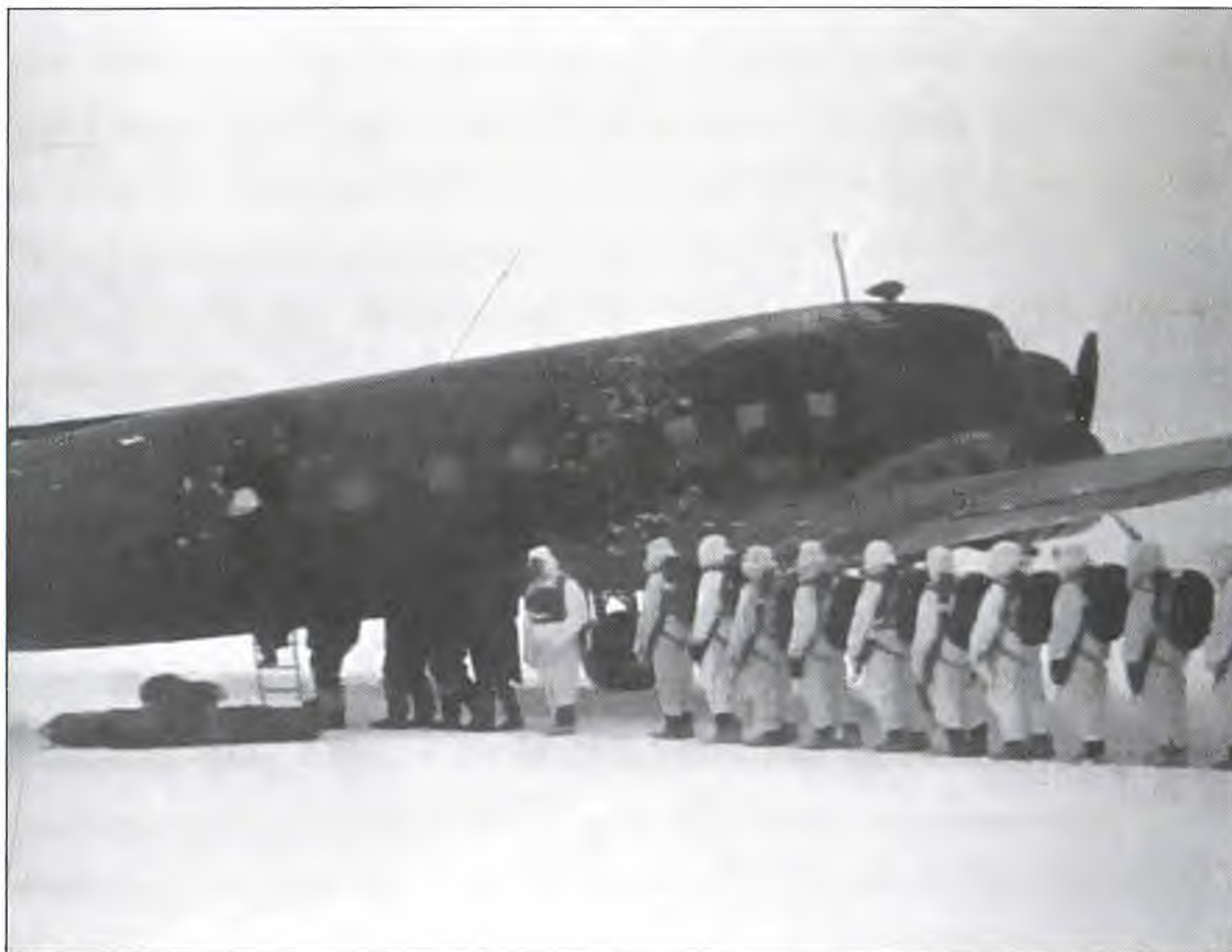
Взвод парашютистов готовится занять место в самолете