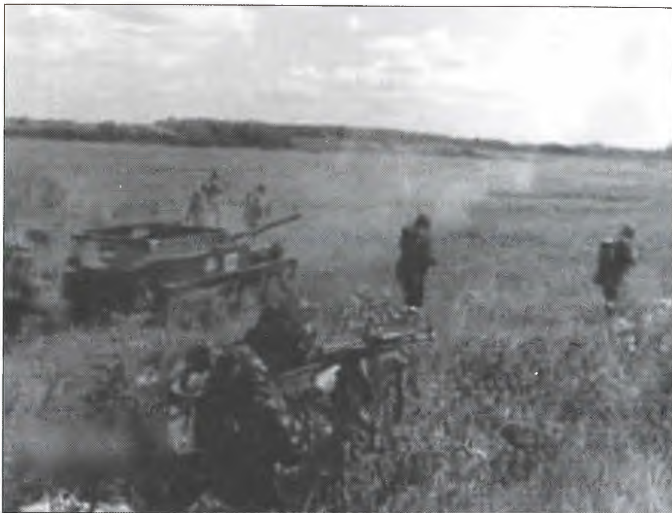
Учения ВДВ в 1970-е гг.