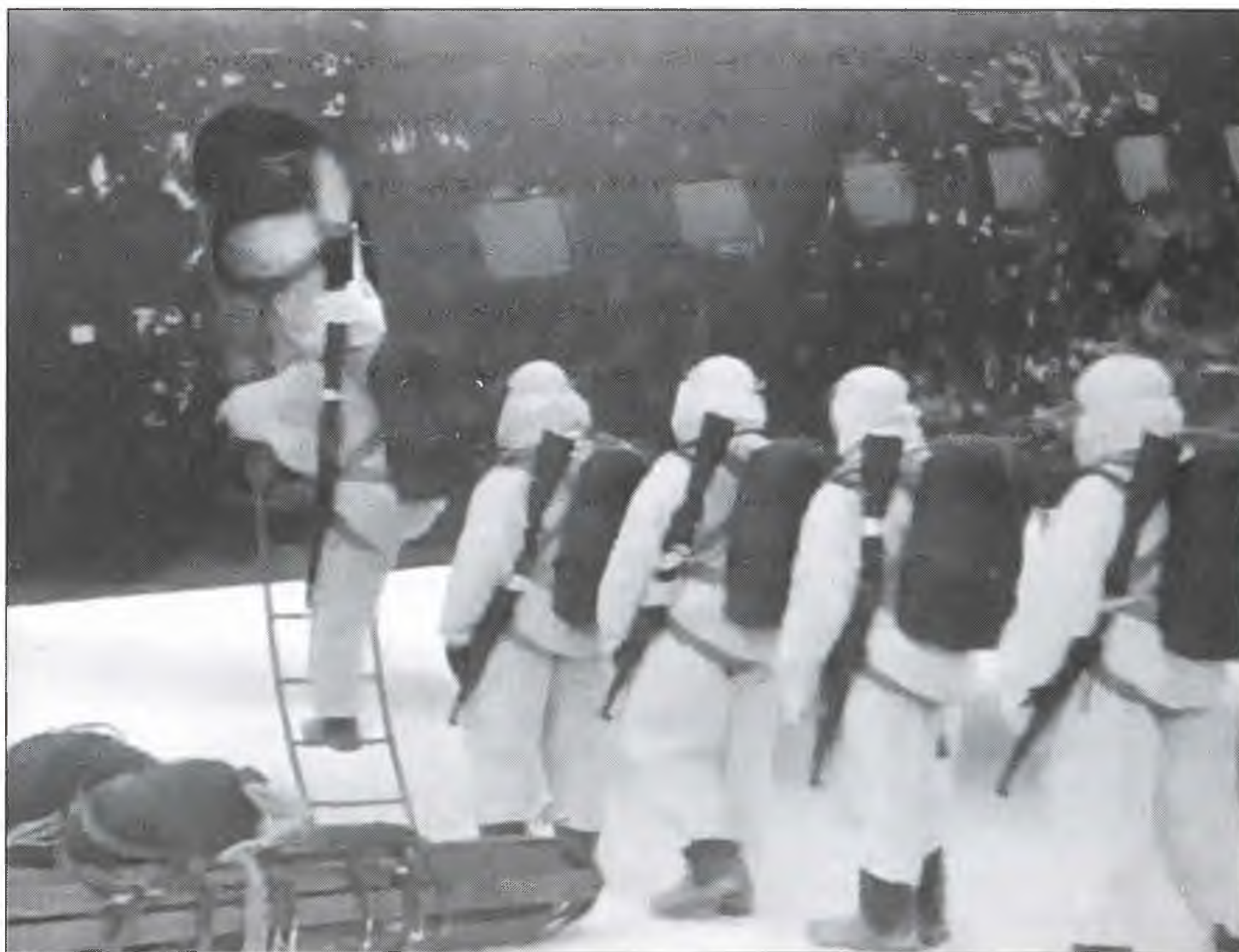
Рядом с бойцами сани и матерчатые контейнеры, приготовленные к выгрузке