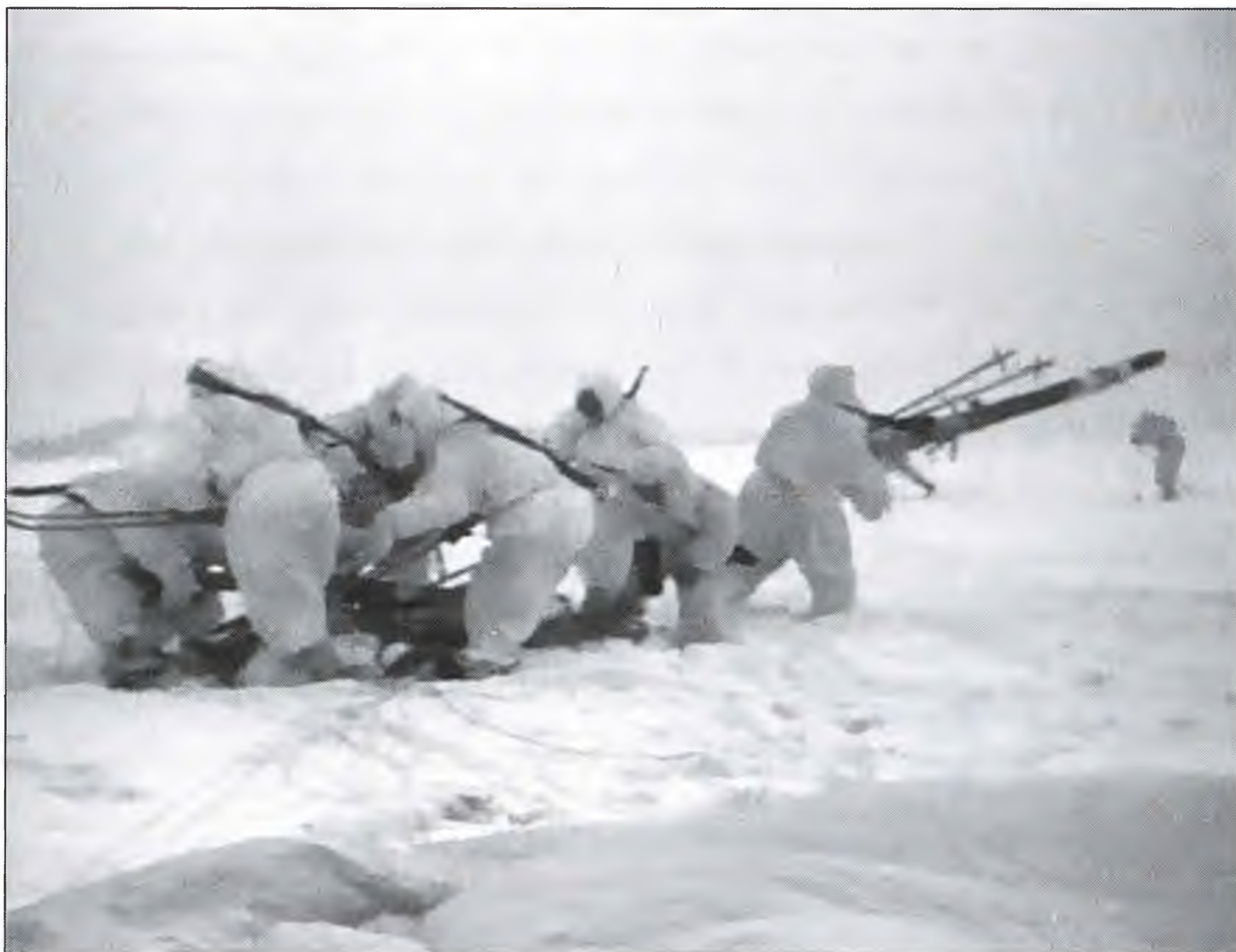
Десантники разбирают лыжи и снаряжение