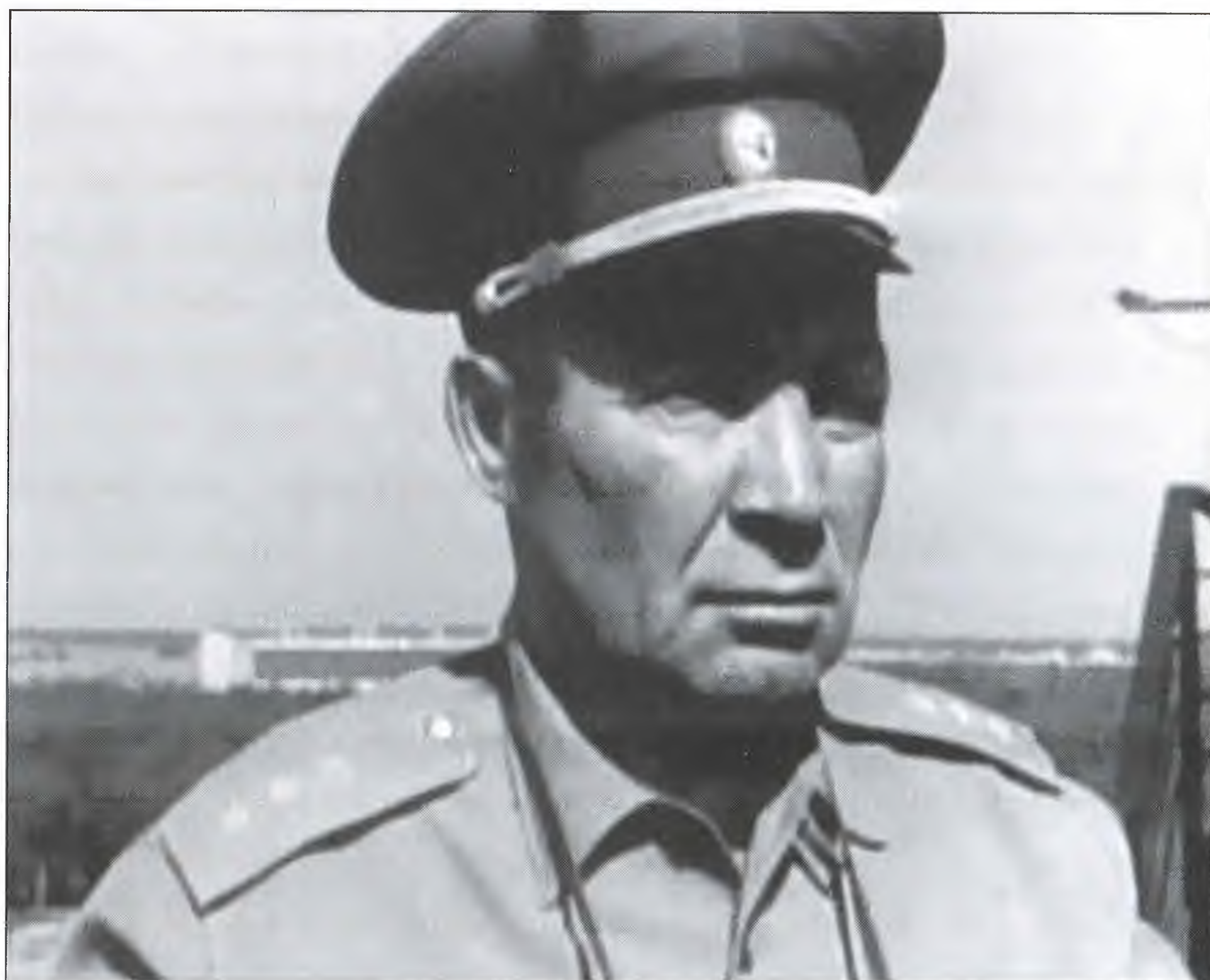
В.Ф. Маргелов во время воздушного парада в Тушино