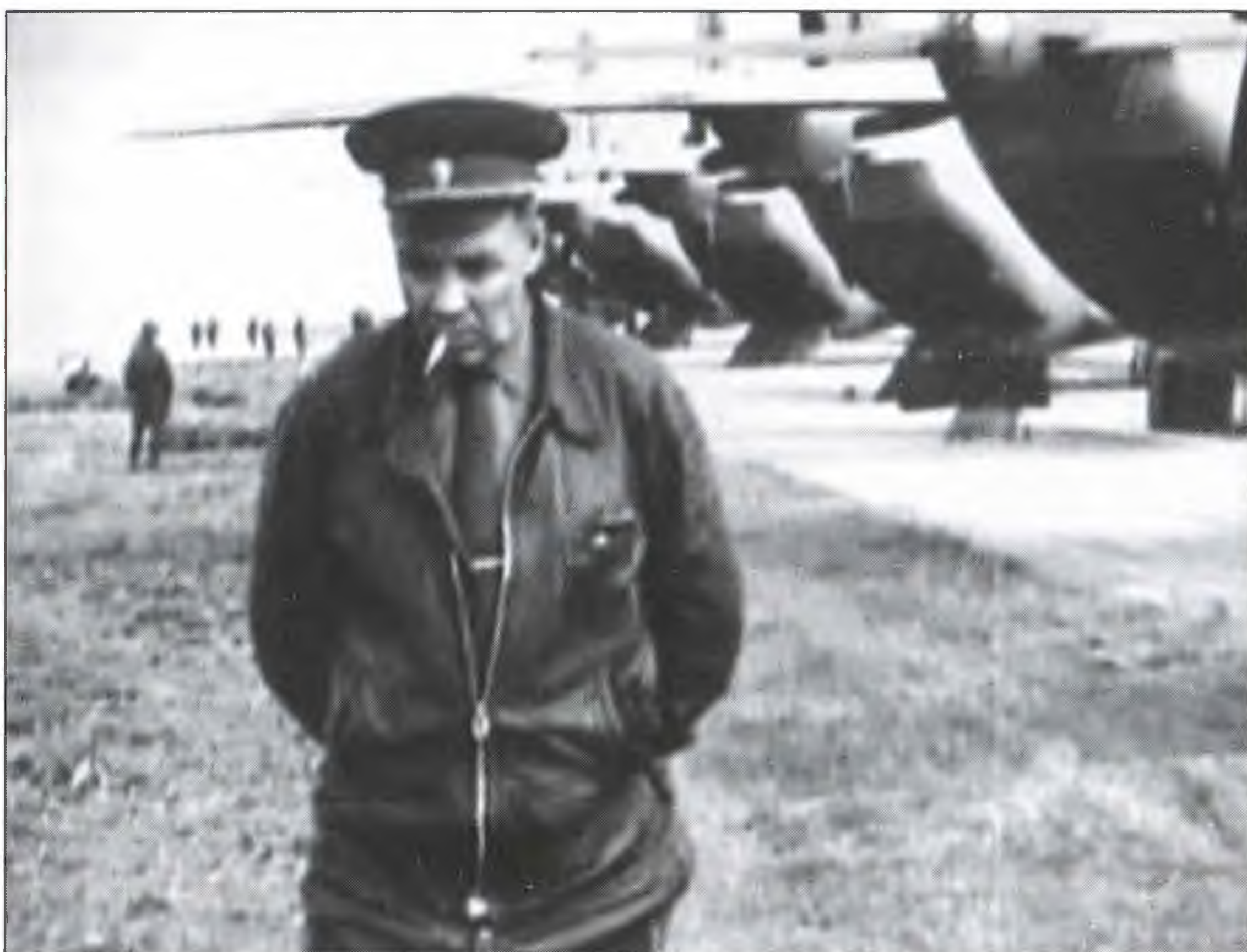
В минуты раздумья