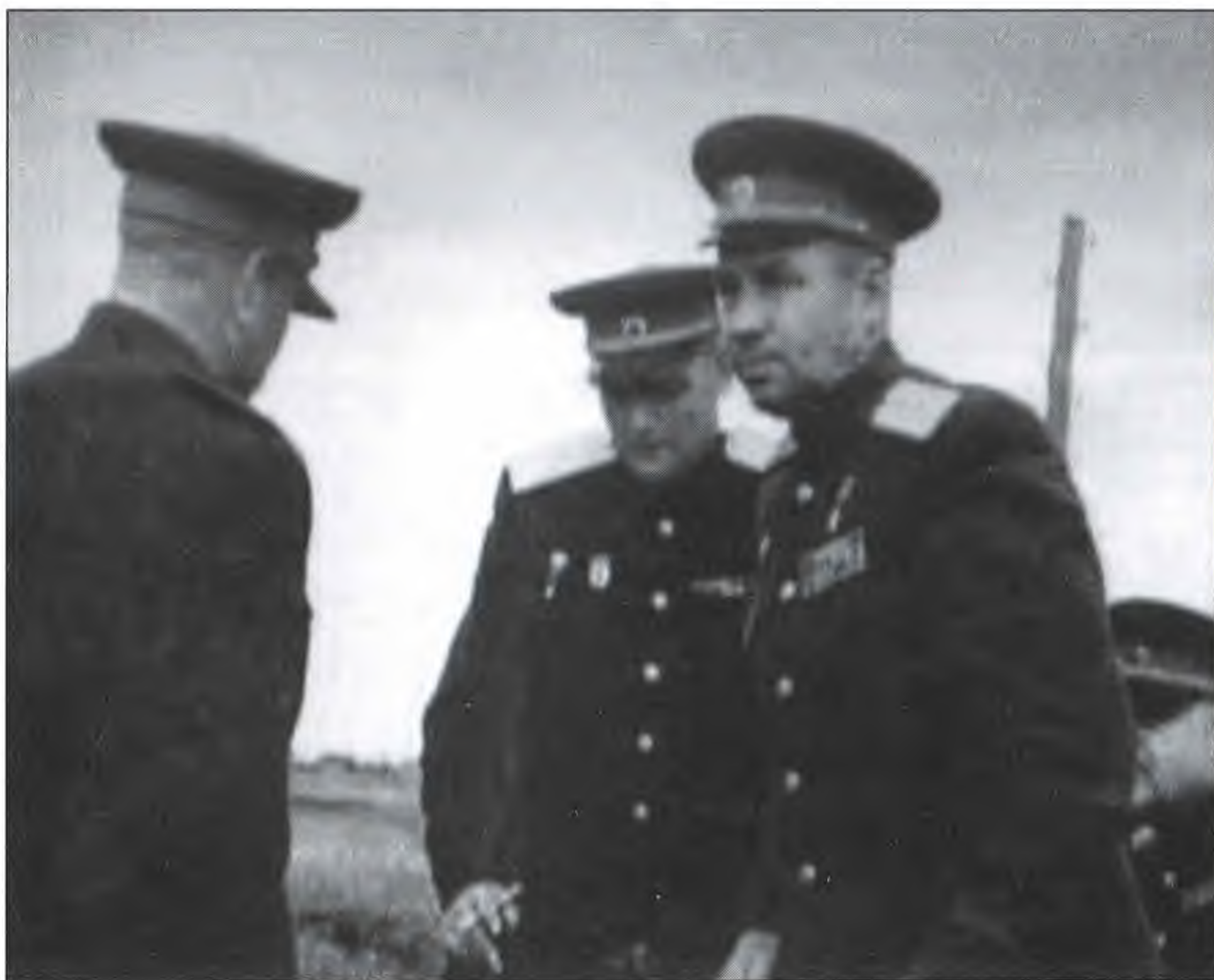
В.Ф. Маргелов в послевоенные годы