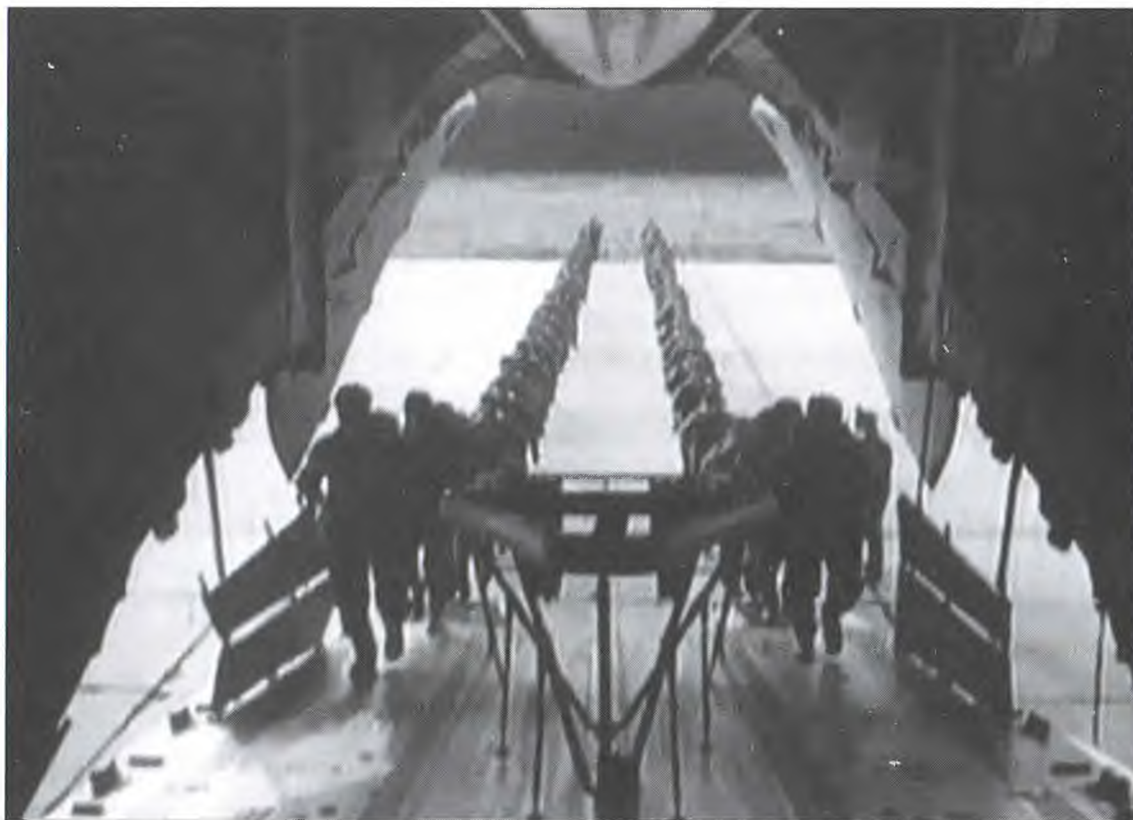
Десантники загружаются в самолет