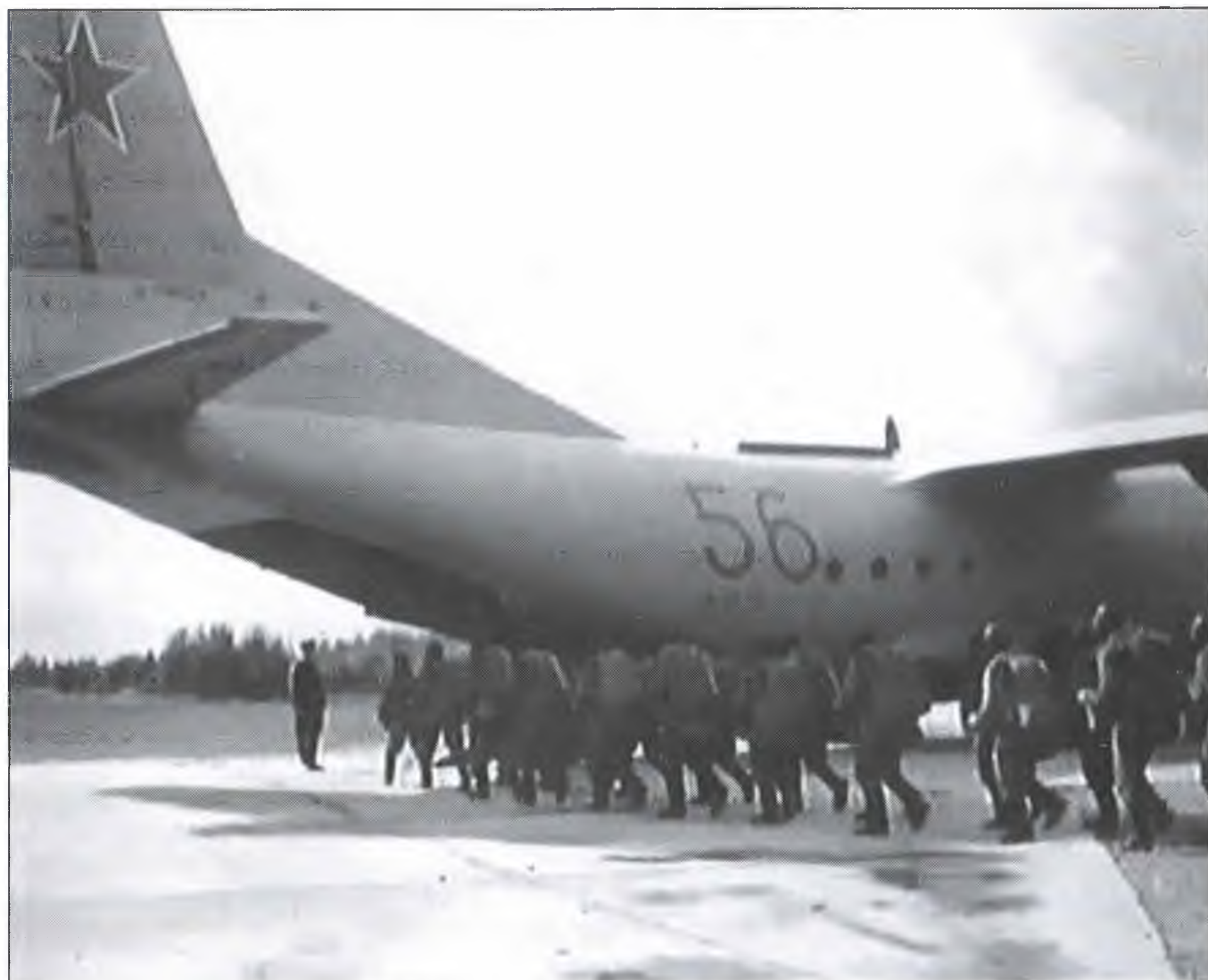
Учения ВДВ в 1980-е гг.