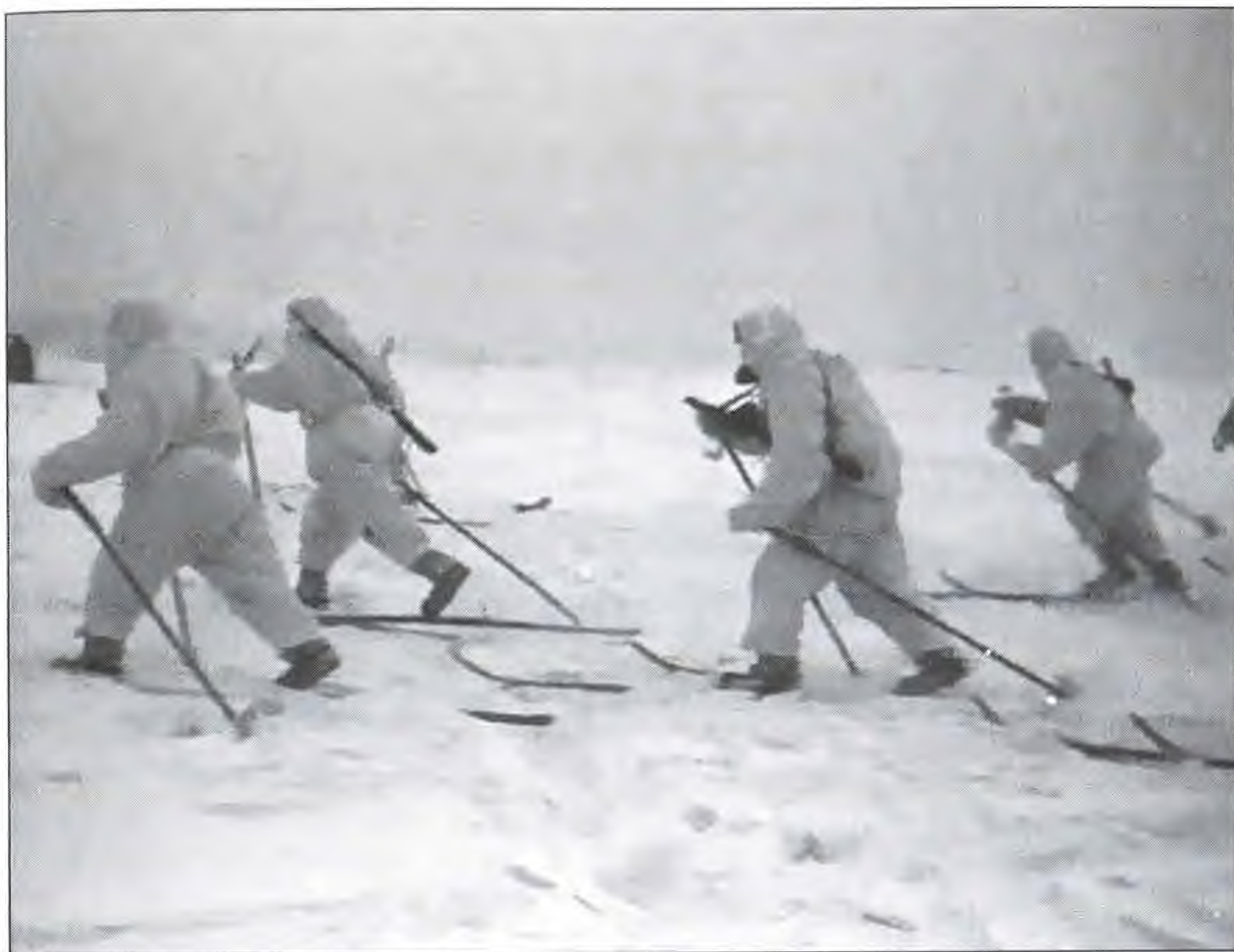
Десант идет в атаку