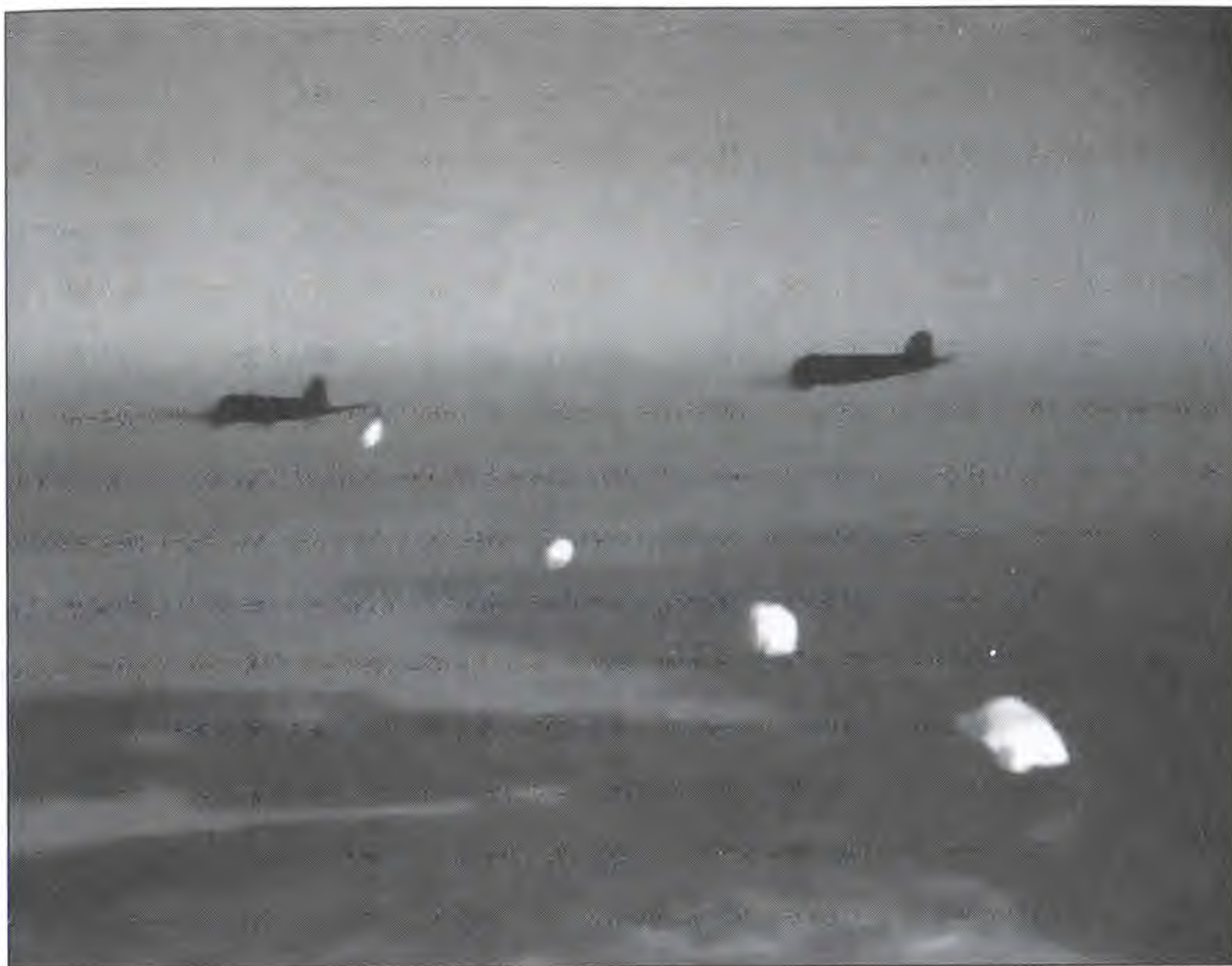
Выброска десанта началась!