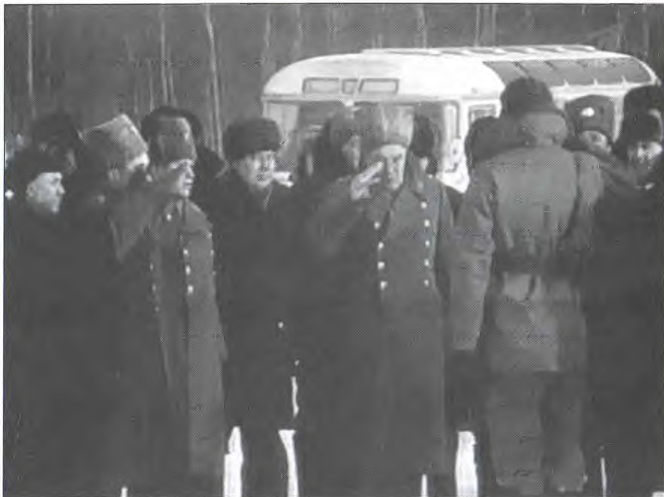
В.Ф. Маргелов приветствует экипаж БМД, впервые десантировавшийся вместе со своей машиной. В составе экипажа был один из сыновей генерала