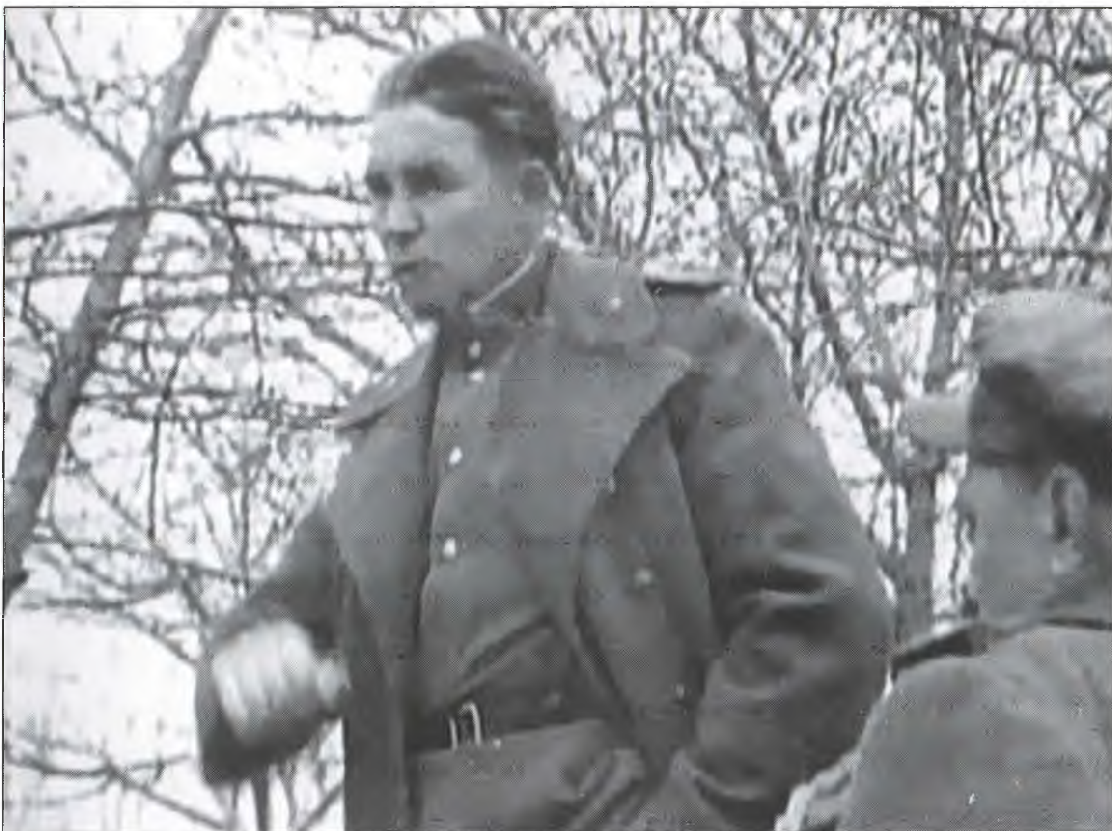
В.Ф. Маргелов во время посещения одной из воинских частей