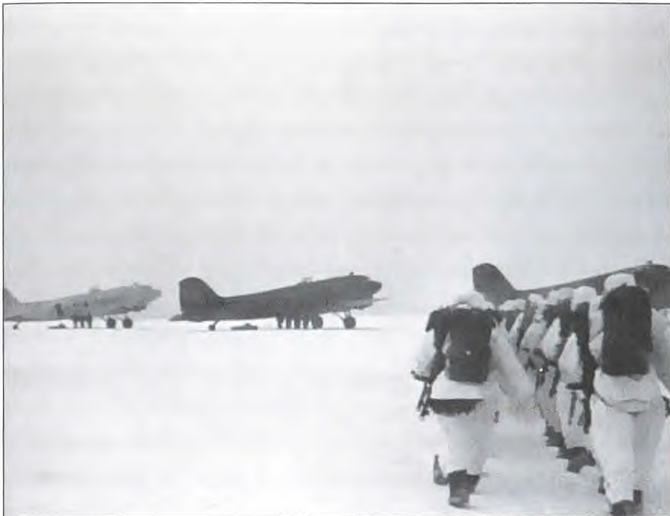
Десантники 4-го влк двигаются к самолетам