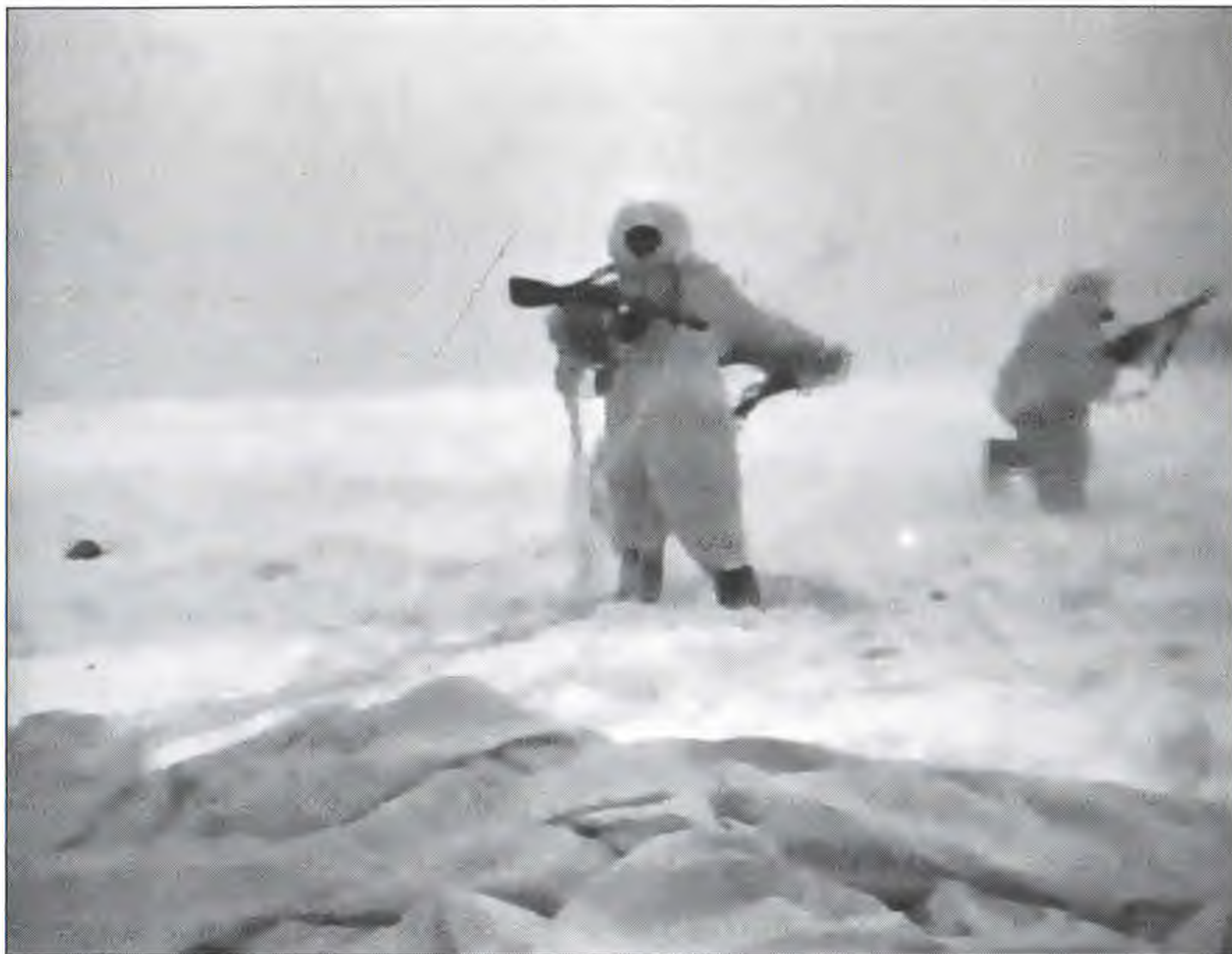
На земле. Парашютист освобождается от парашюта