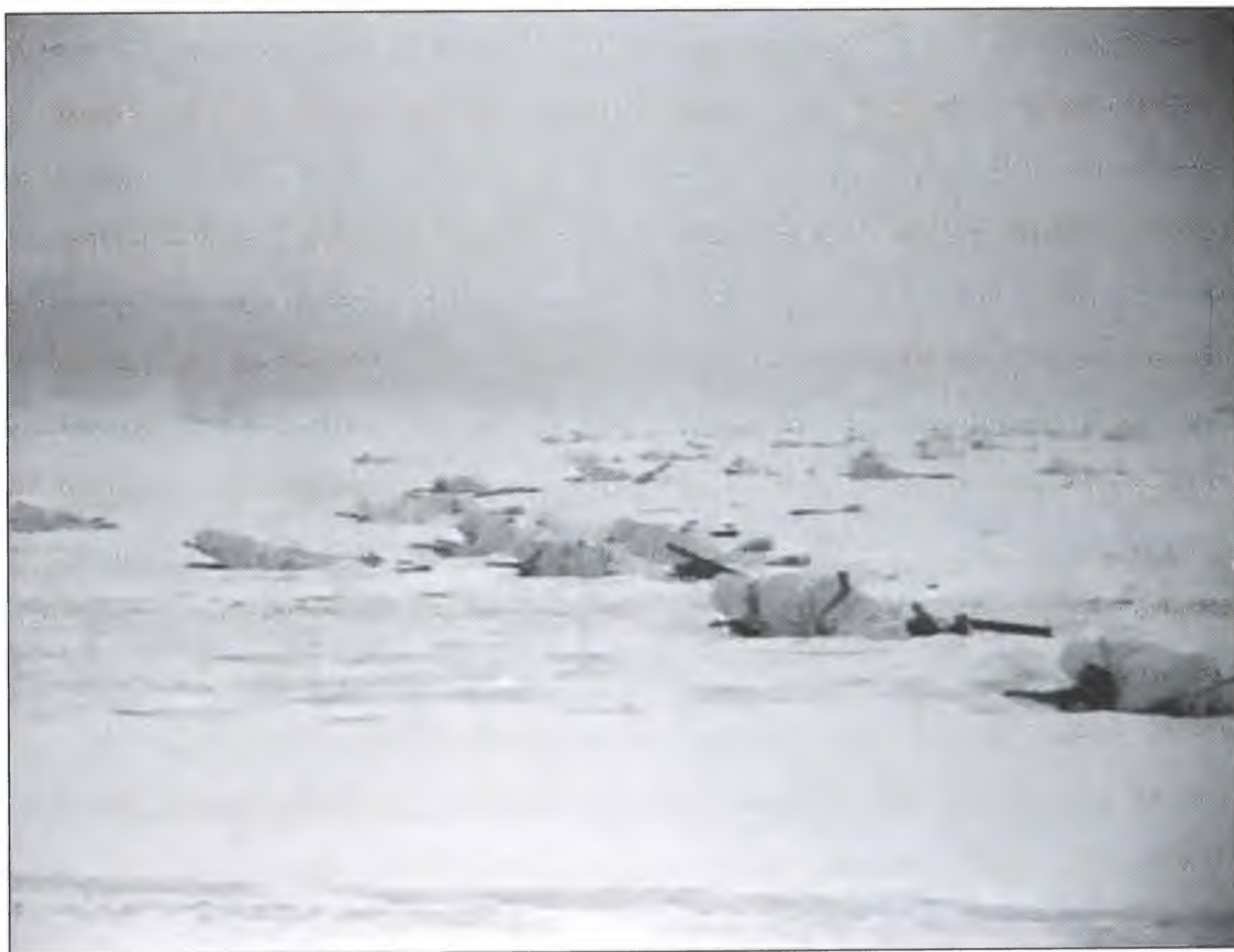
Парашютисты залегли под огнем противника