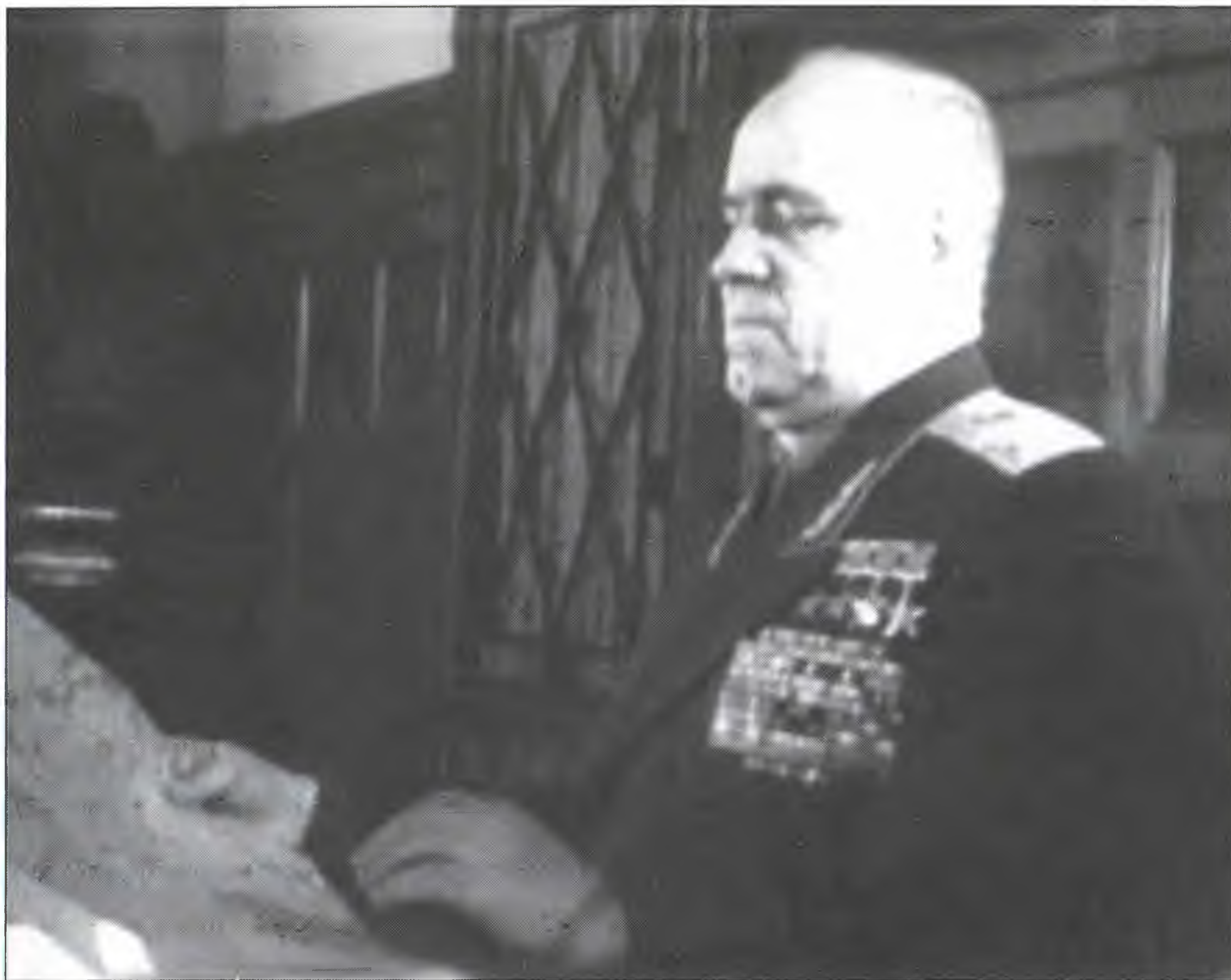
Министр обороны СССР Г.К. Жуков, назначивший Маргелова на пост командующего ВДВ