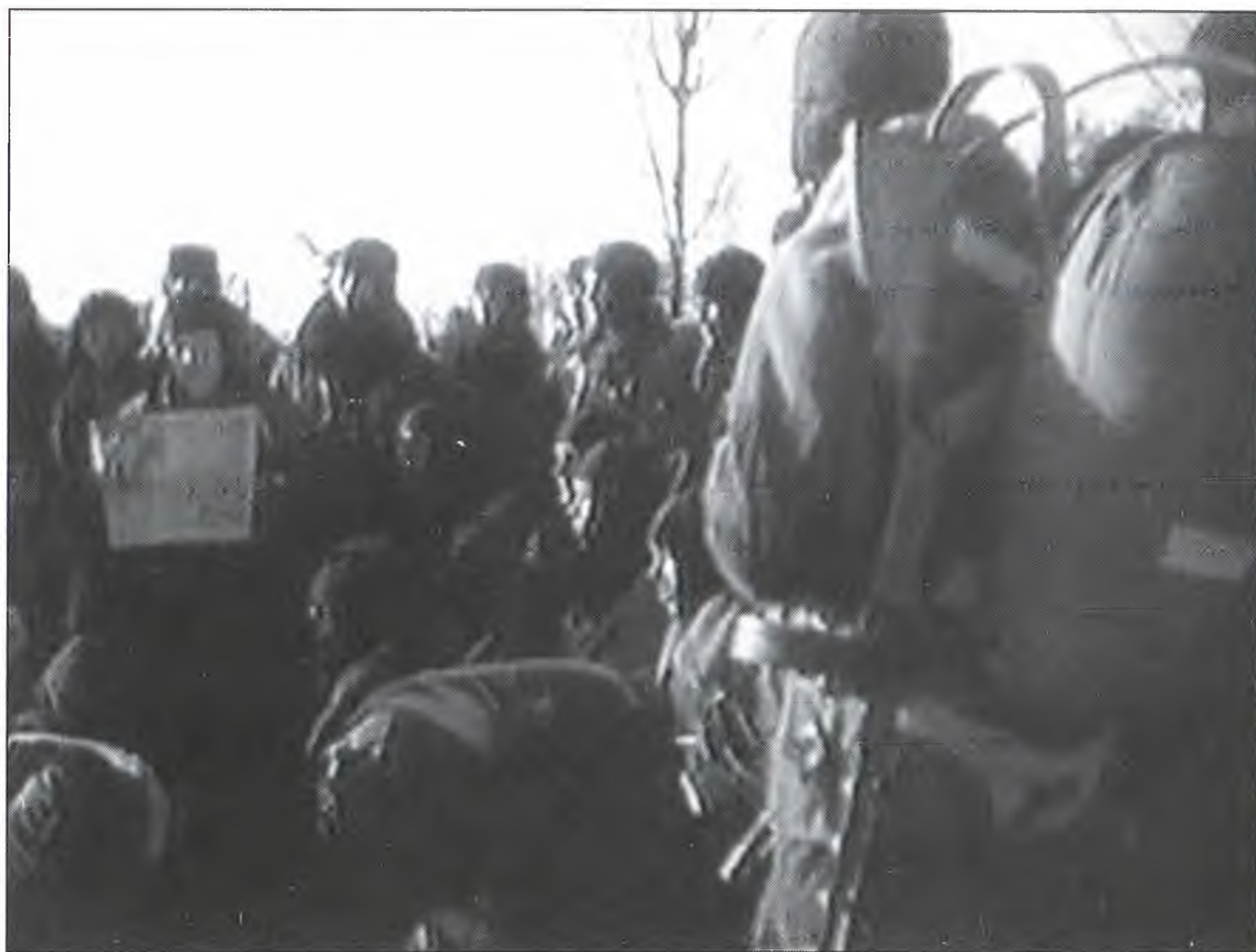
Десантники 4-го вдк перед вылетом на задание