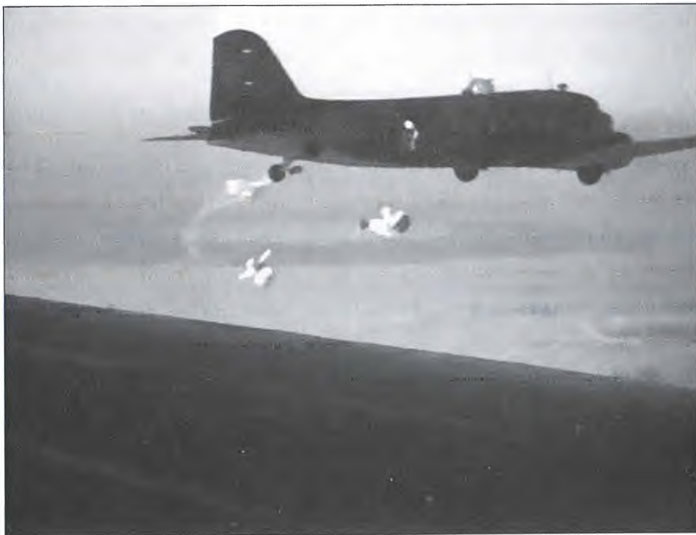
Момент отделения парашютиста от самолета