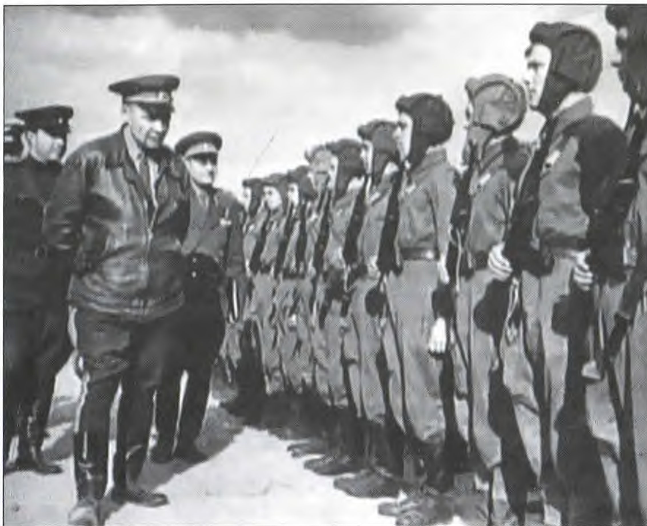
Генерал Маргелов обходит строй десантников