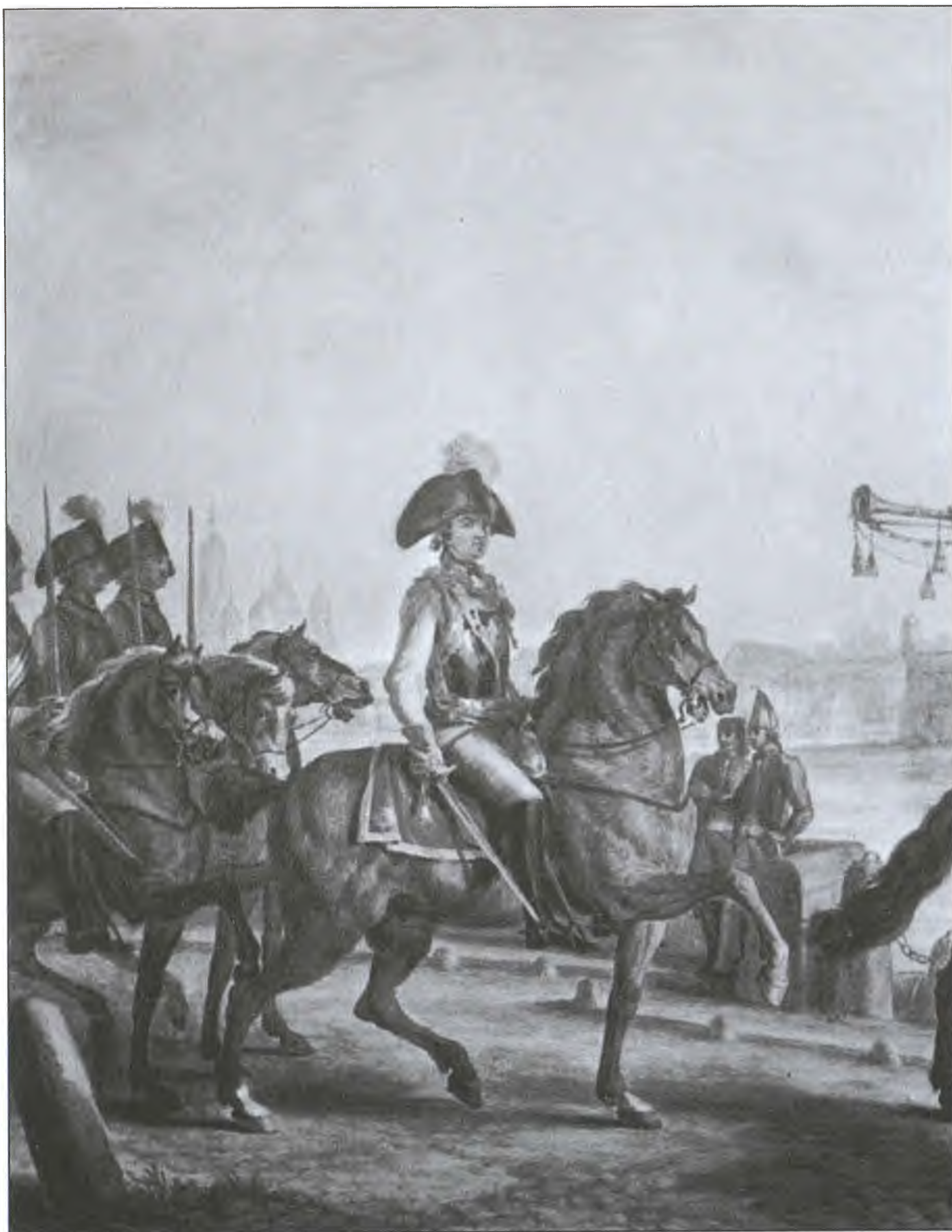
Генерал-фельдмаршал Г.А. Потемкин во главе Кавалергардского отряда. Художник М.М. Иванов