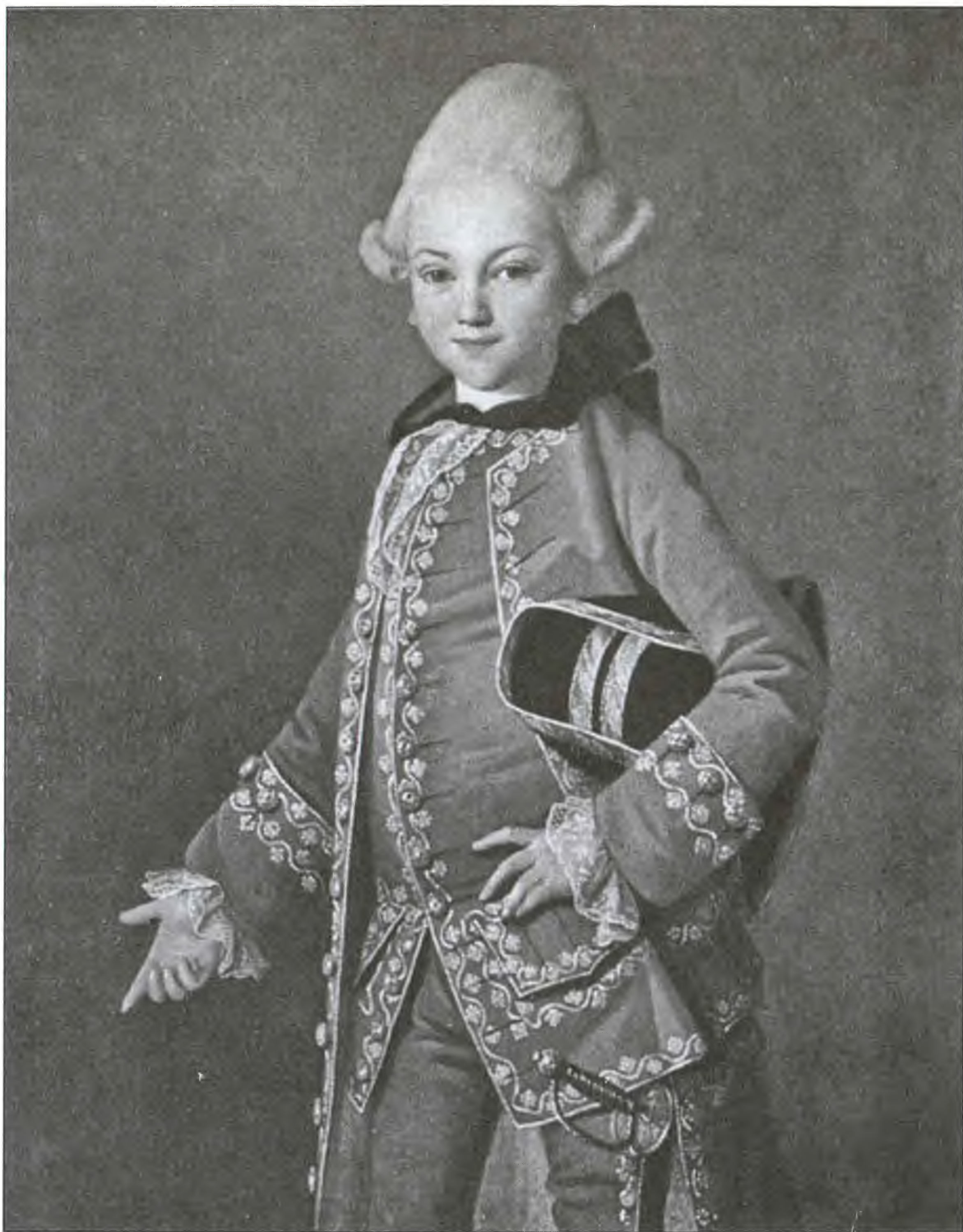
Юный граф Алексей Григорьевич Бобринский. Сын Екатерины II и графа Г.Г. Орлова. Художник К.-Л.-И. Христинек