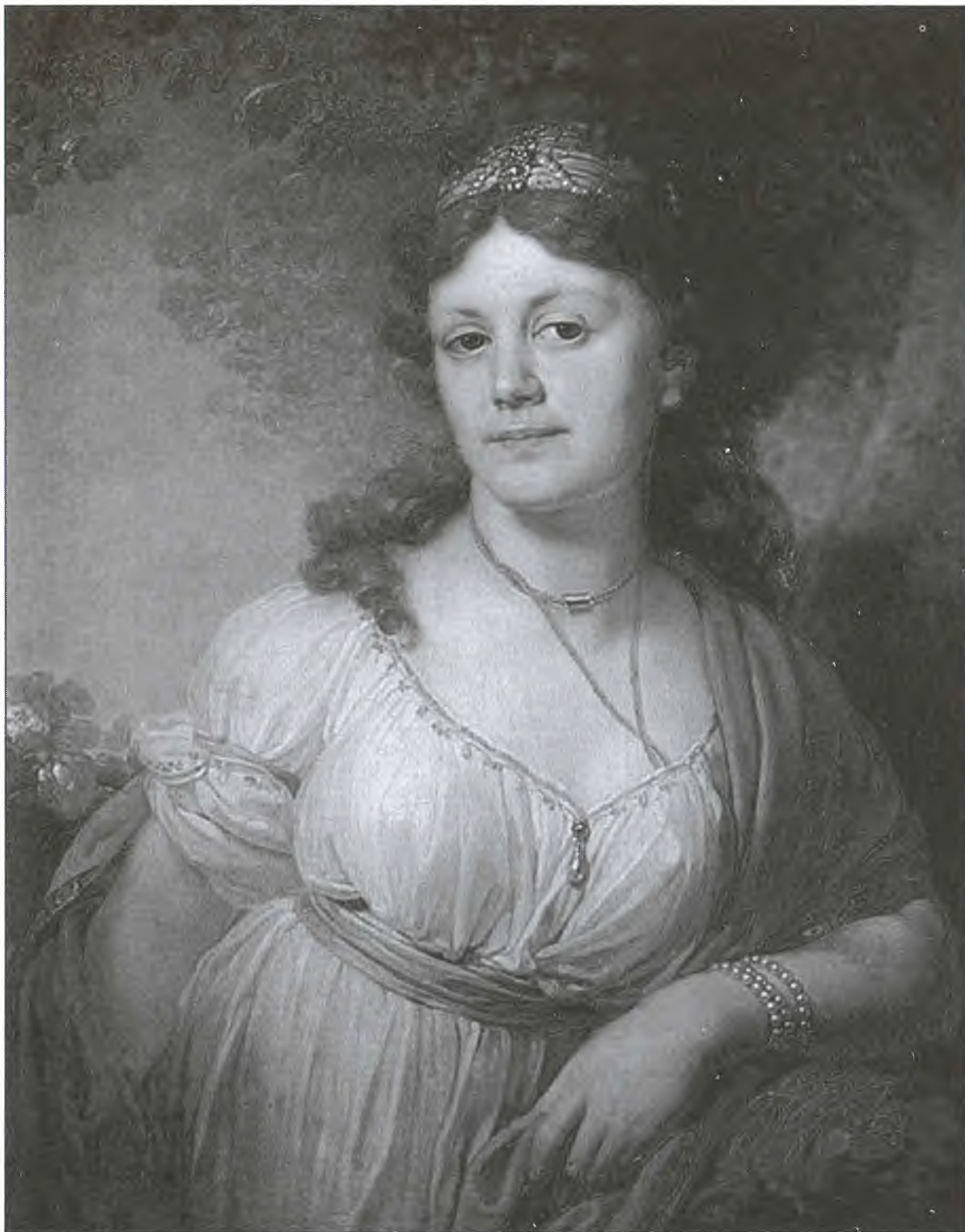
Елизавета Григорьевна Темкина, дочь Екатерины II и Г.А. Потемкина. Художник В.Л. Боровиковский