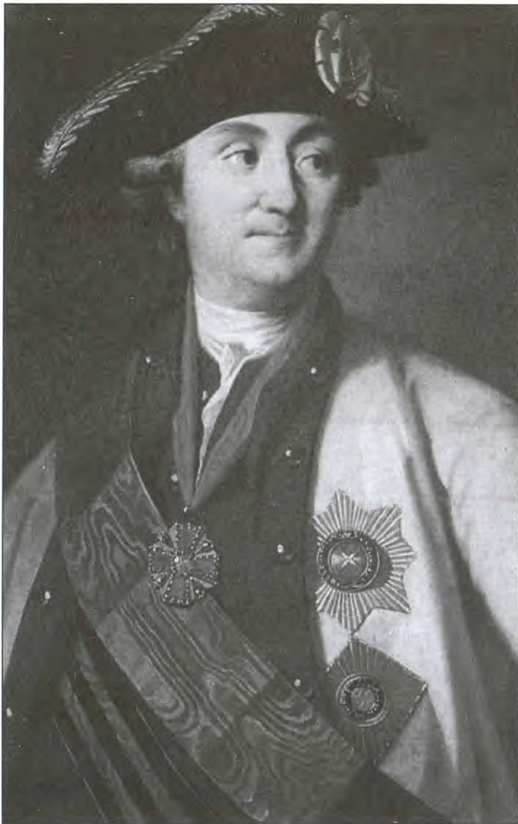
Алексей Орлов не ходил в любовниках Екатерины, он вместе с братом посадил ее на трон. Художник К.-Л.-И. Христинек