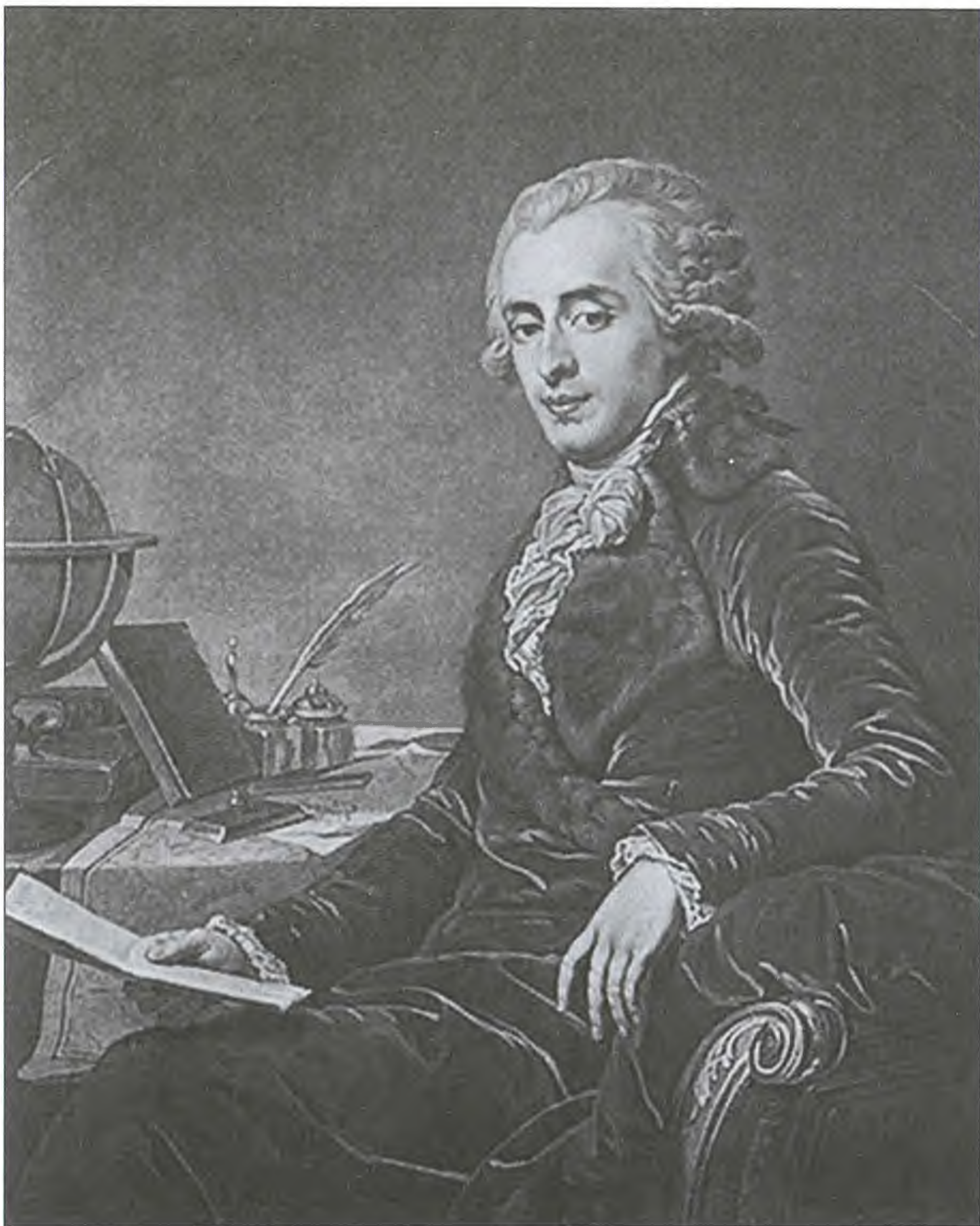
П.А. Зубов. «Цыганенок», как звала его Екатерина. С картины И.Б. Лампи-старшего