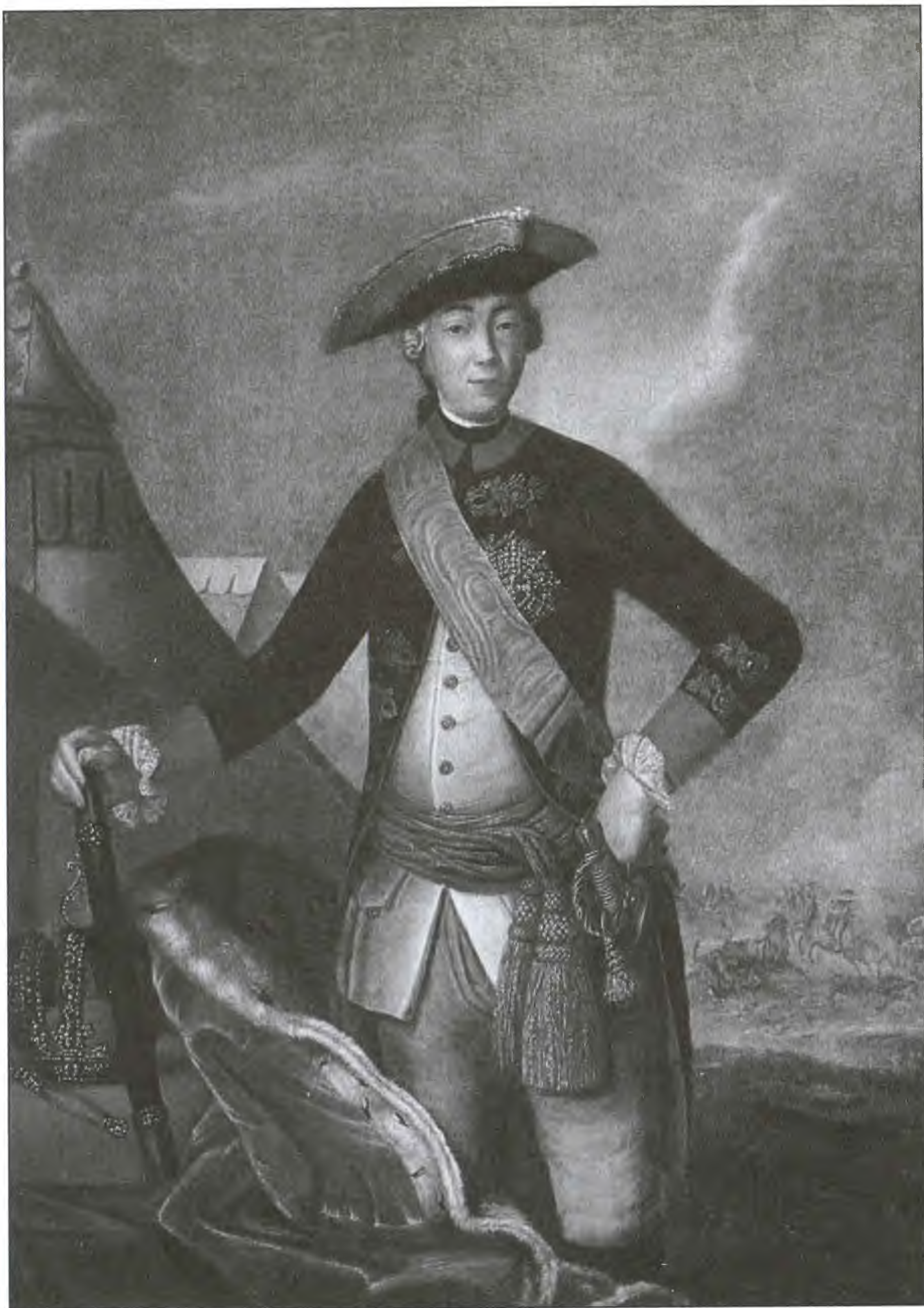
Император Петр III. Художник Ф.С. Рокотов