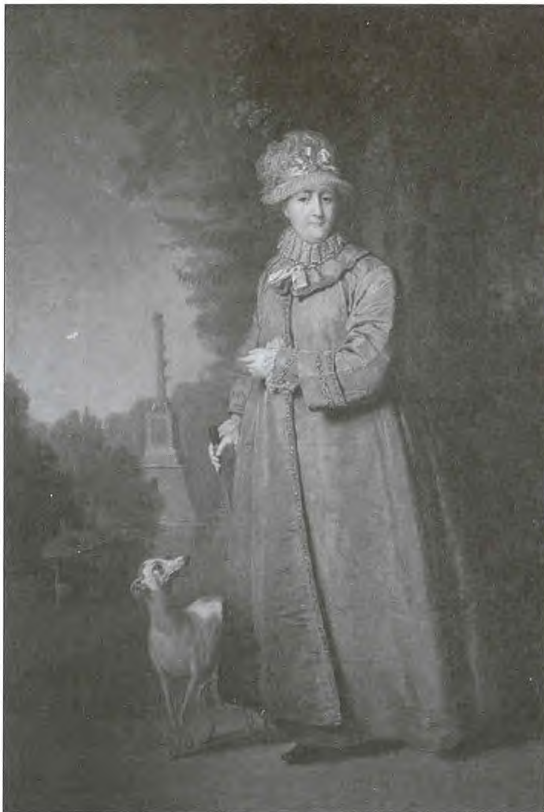
Екатерина II. Художник В.Л. Боровиковский