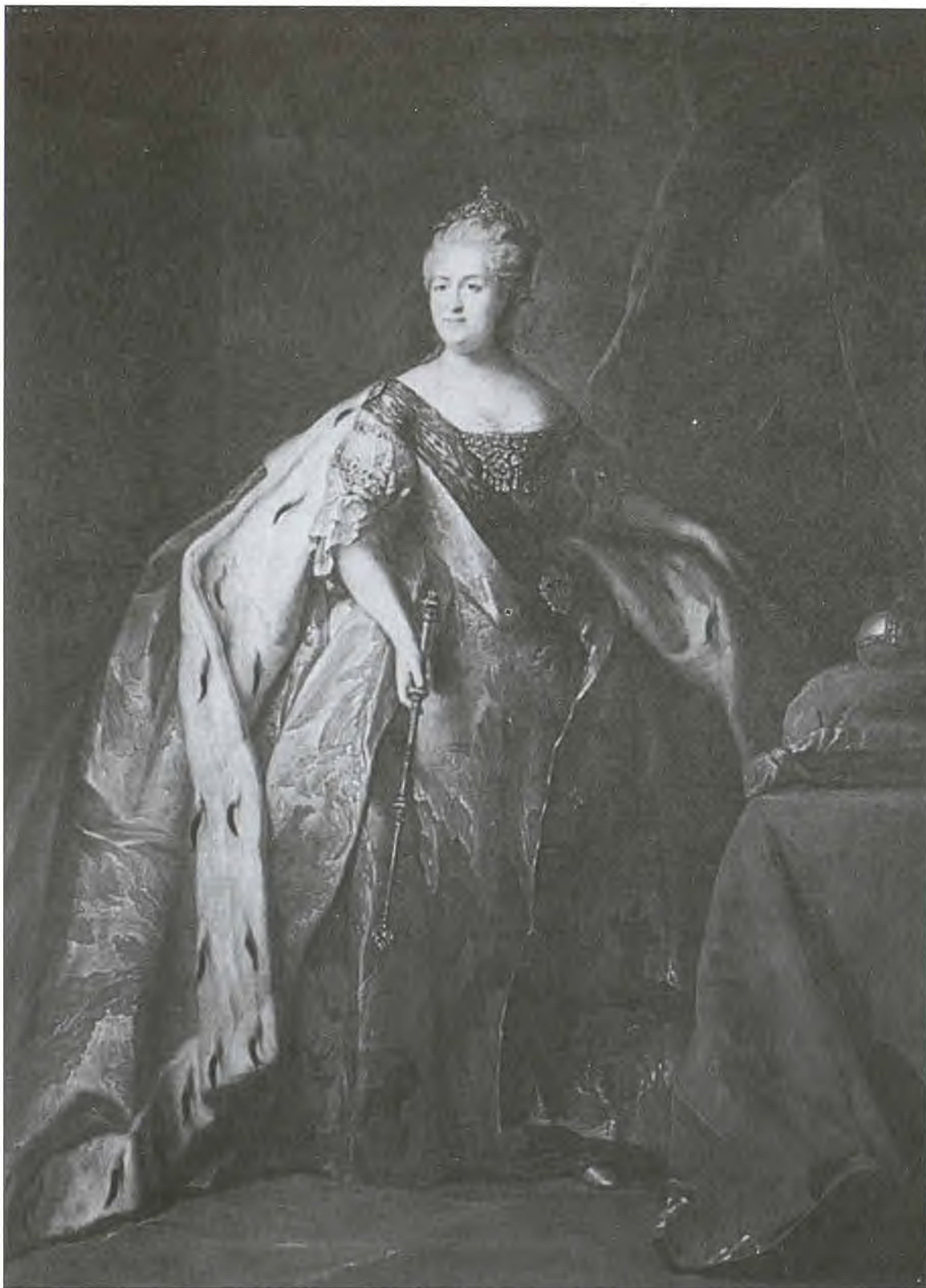
Императрица Екатерина II. Художник П.С. Дрождин