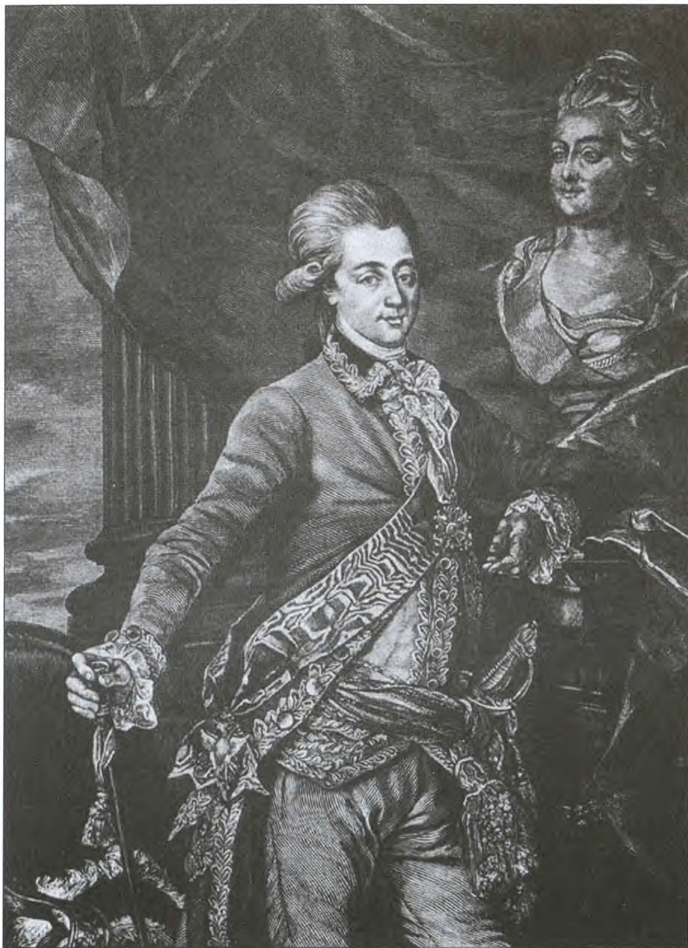
А.Д. Завадский. Сама Екатерина пишет о нем, что никого не любила так, как этого молодого человека. Гравюра XVIII в.