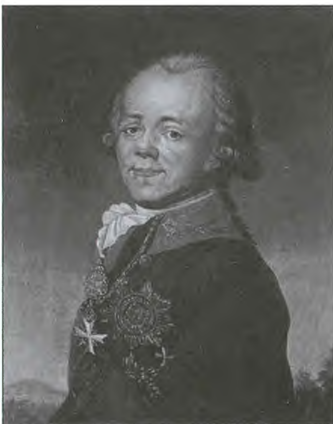
Павел I. Портрет неизвестного художника. Некоторые считали отцом императора не Петра III, а С.В. Салтыкова