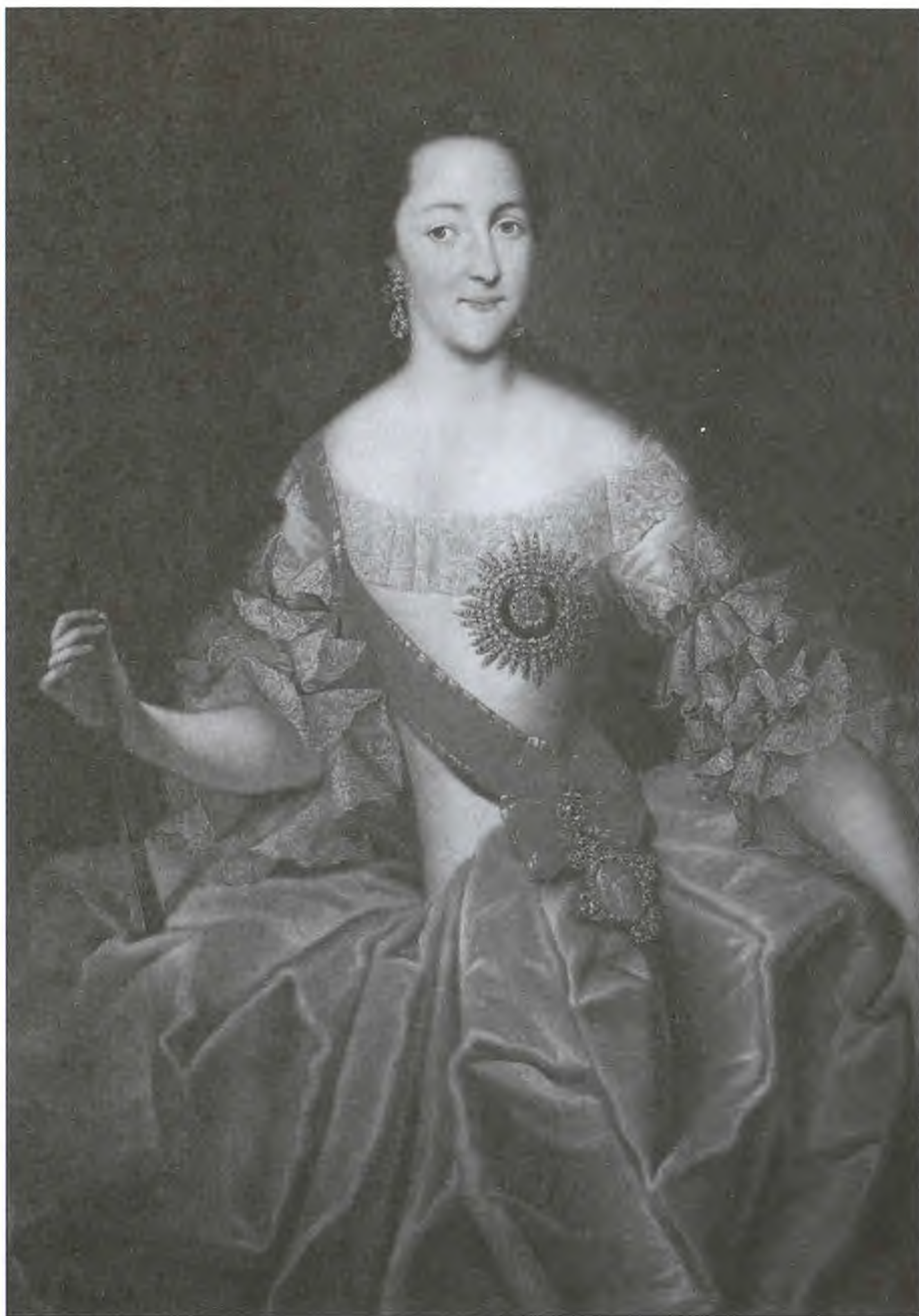
Великая княгиня Екатерина Алексеевна. Неизвестный художник