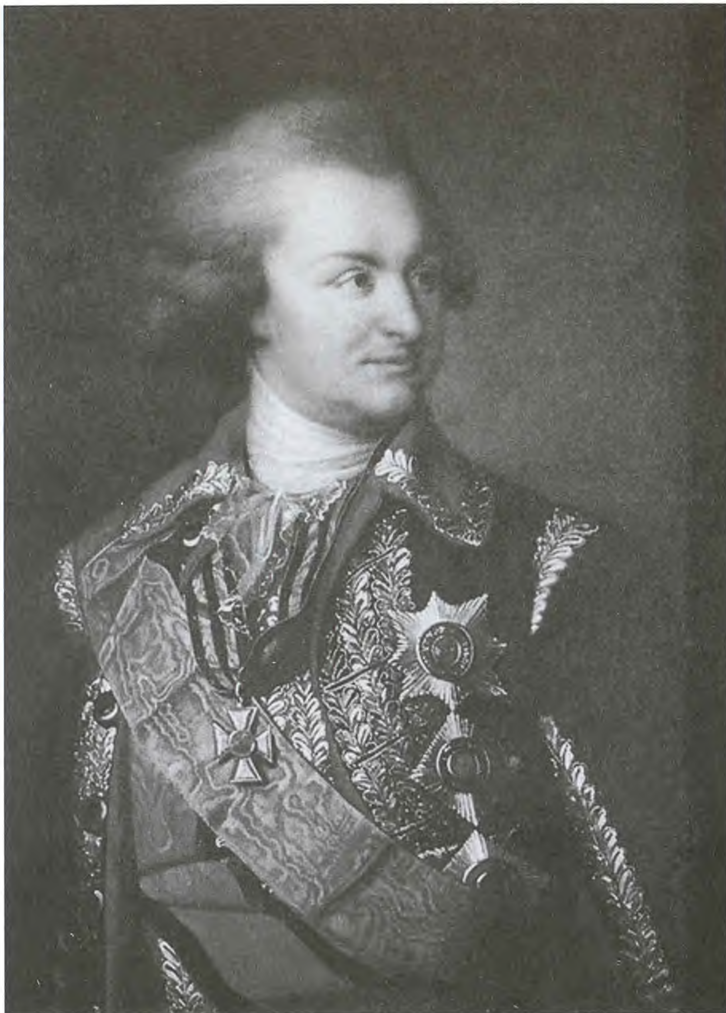
Генерал-фельдмаршал князь Г.А. Потемкин-Таврический. Портрет неизвестного художника