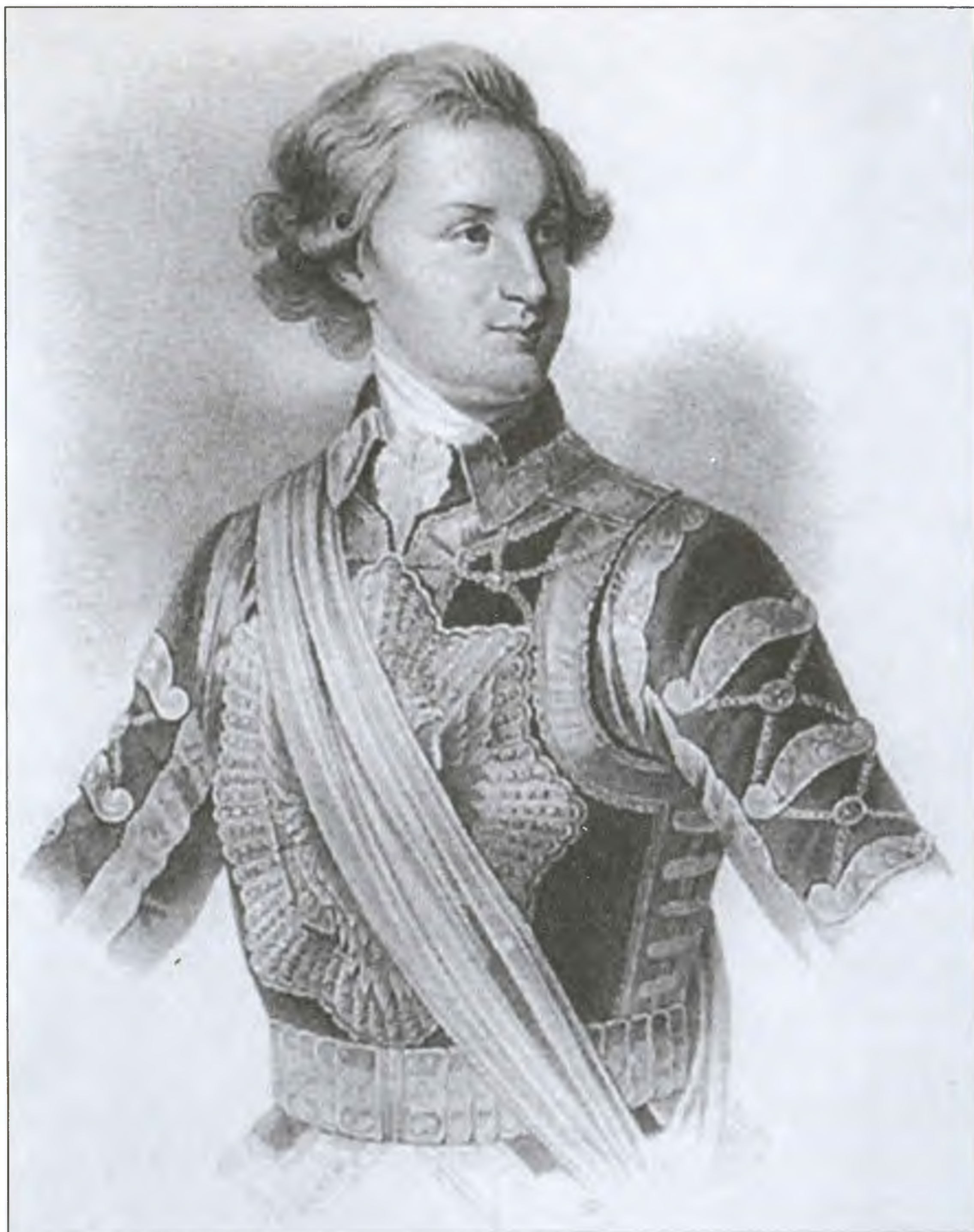
П.В. Завадовский. Если бы в XVIII веке уже придумали слово «интеллигент», то оно вполне было бы по размеру этому человеку. Портрет неизвестного художника