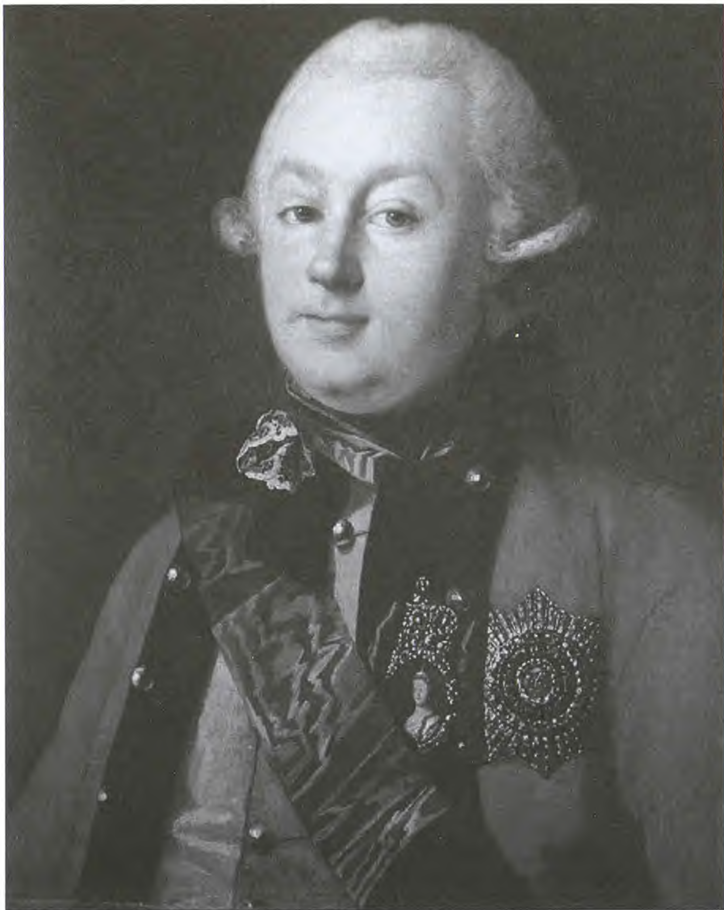
Г.Г. Орлов — красавец, дуэлянт, масон и любимец дам. Художник К.-Л.-И. Христинек