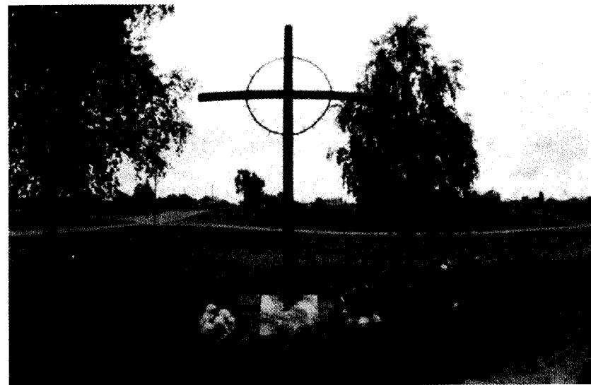
Памятник жителям польского с. Белосток Кривошеинского района, репрессированным в 1937—1938 гг. Установлен 21 июня 2003 г.