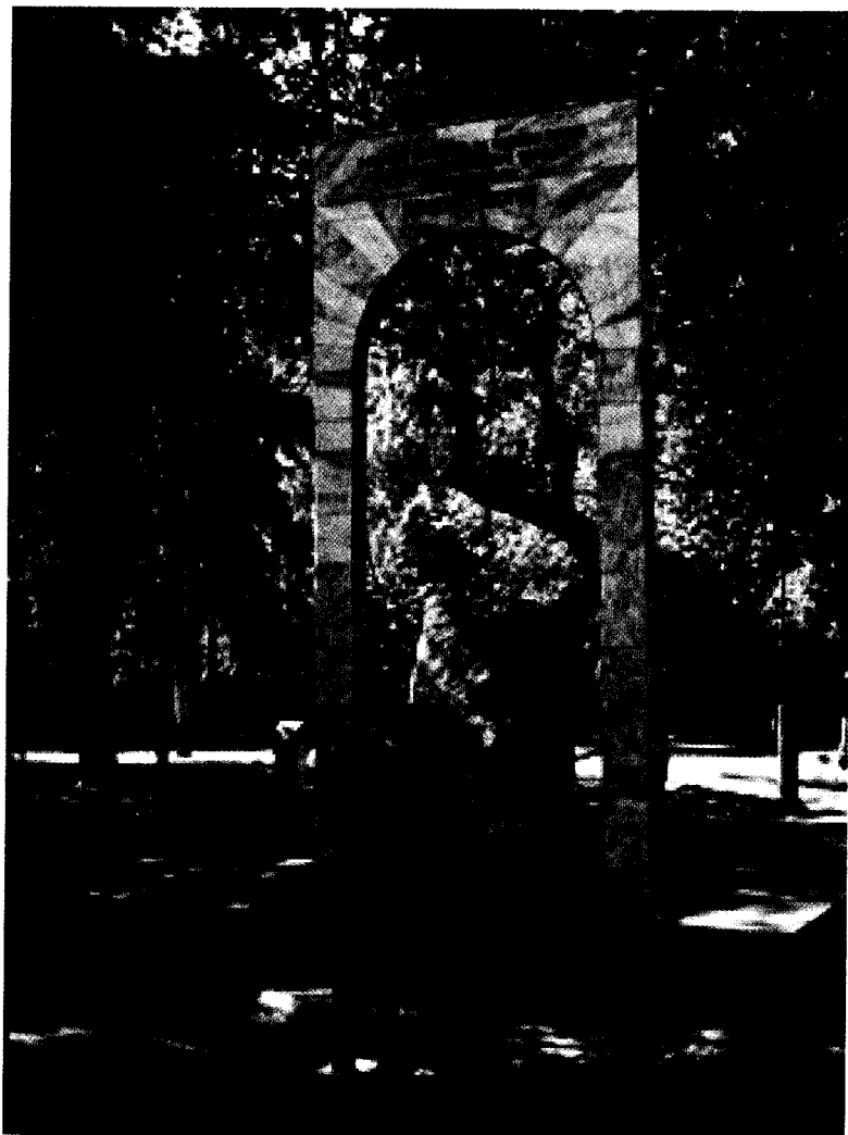
Камень Скорби – памятник жертвам большевистского террора на томской земле. Установлен 7 июня 1989 г.