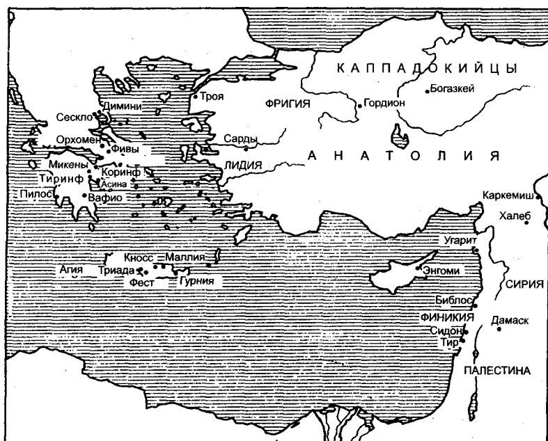
1. Ближний Восток в конце 2-го тысячелетия