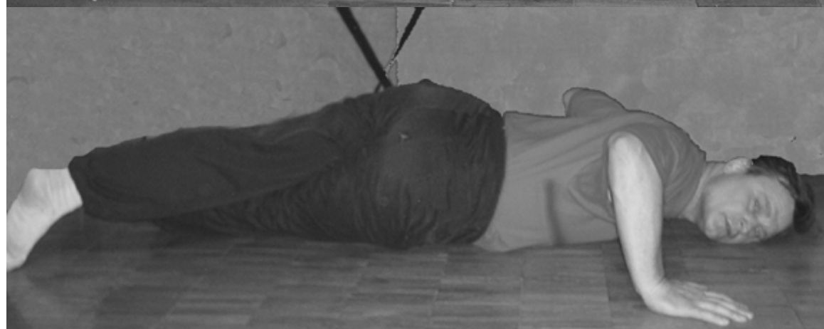
Рис. 7. Скручивание