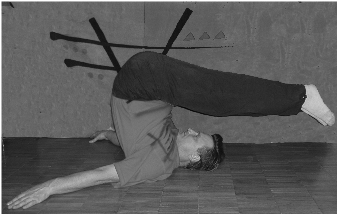
Рис. 1. Упражнение Ванька-встанька

Упражнение 6.1.4. «Кошка сердится». Стоя на коленях выгнуть спину, затем прогнуть её (рис. 2). Пауза в прогибе.