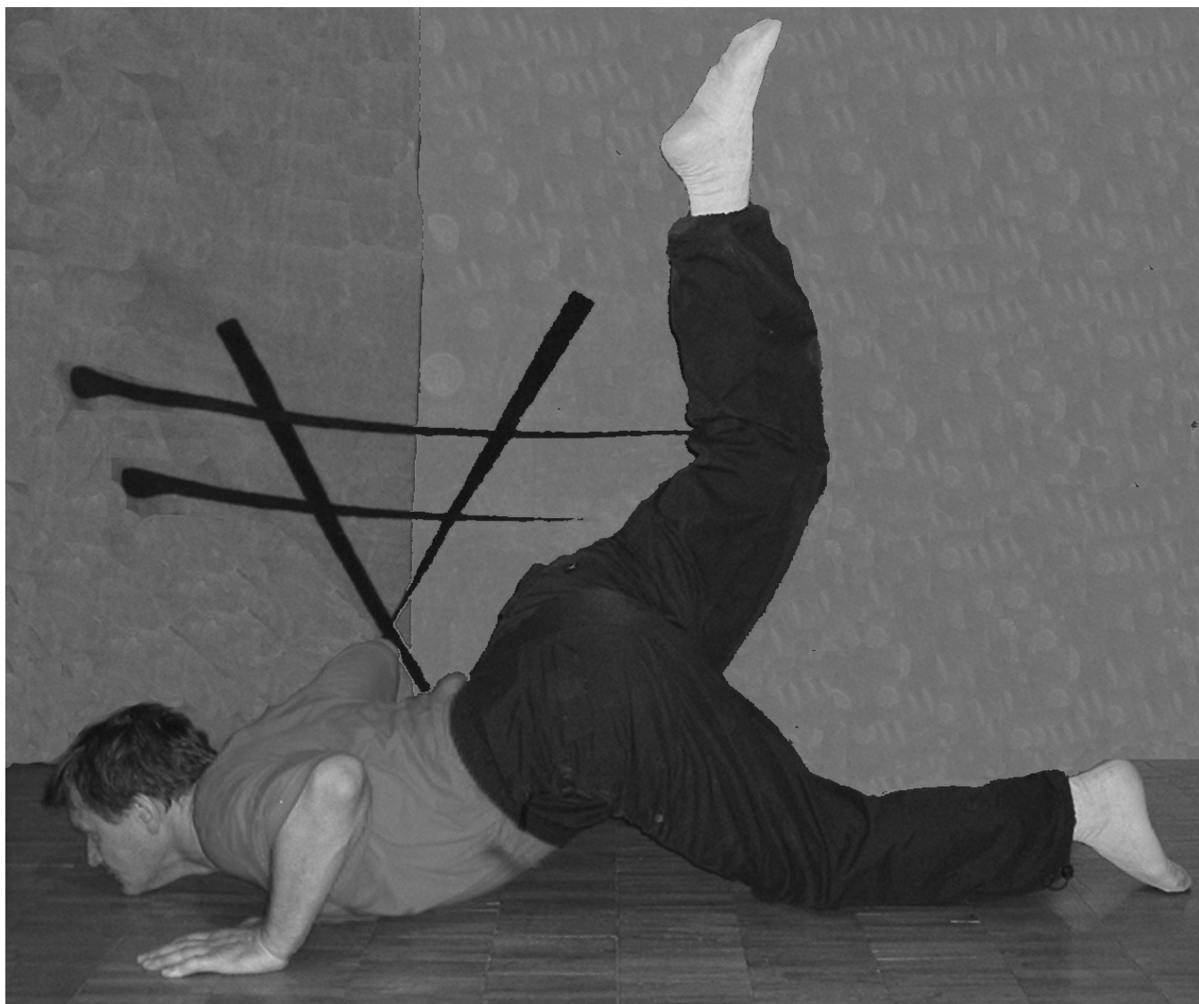
Рис. 5 Присядания