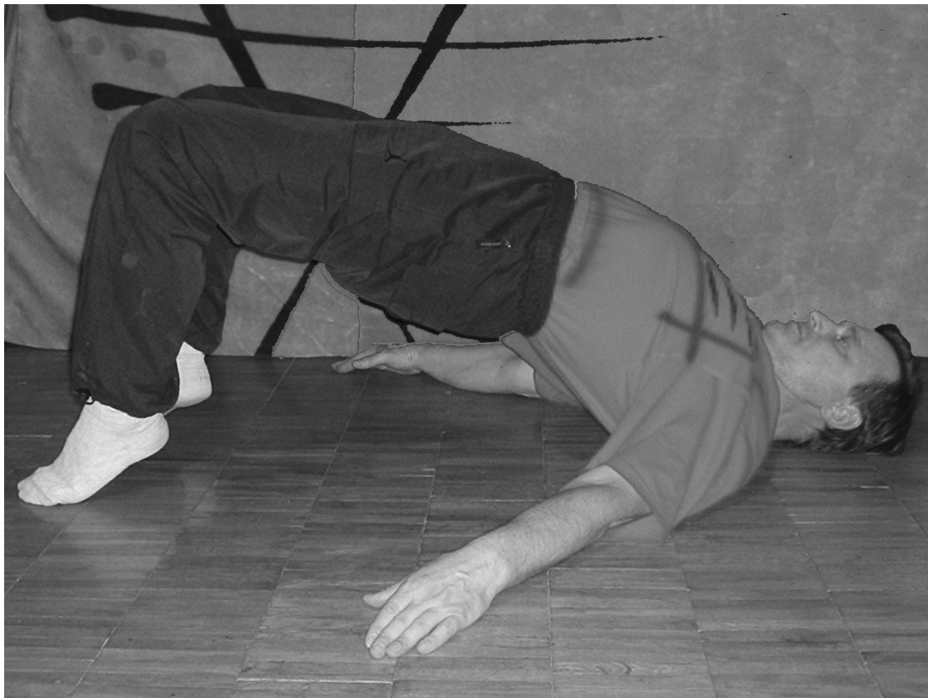
Рис. 11 Полумост