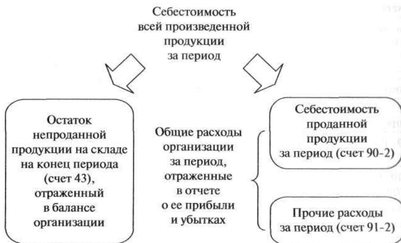
Рис. 8-2. Счета 43, 90-2, 91-2 и их взаимосвязь

Взаимосвязь счетов 43 , 90-1 и 90-2 показана на рис. 8-2.