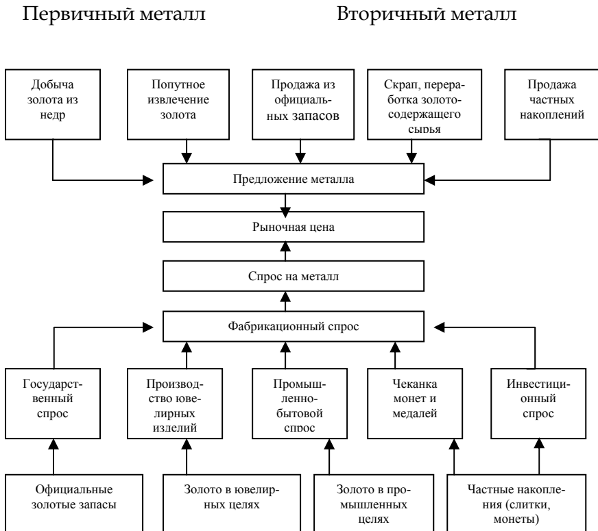
Рис. 6.2. Формирование цены на рынке золота

С учетом сказанного можно проиллюстрировать образование цены на мировом рынке золота.