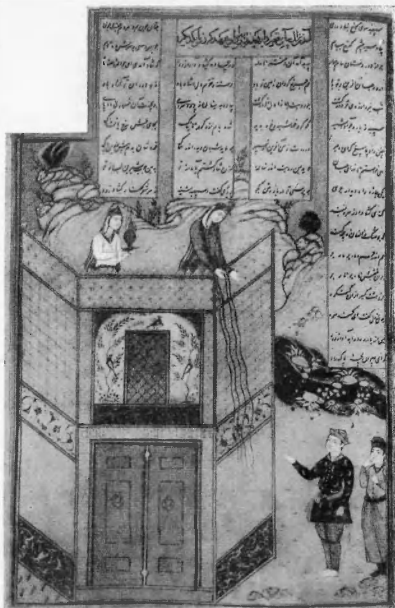
Свидание Залч и Рудابه.

С рукописи Государственной публичной библиотеки им. Святых Петра и Павла.