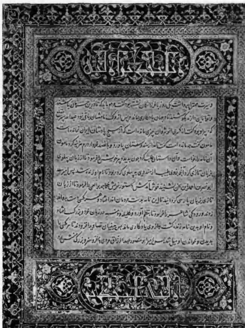
Вторая страница прозаического Дрезнего предисловия к «Шахнаме».

С рукописи библиотеки Института востоковедения АН СССР.