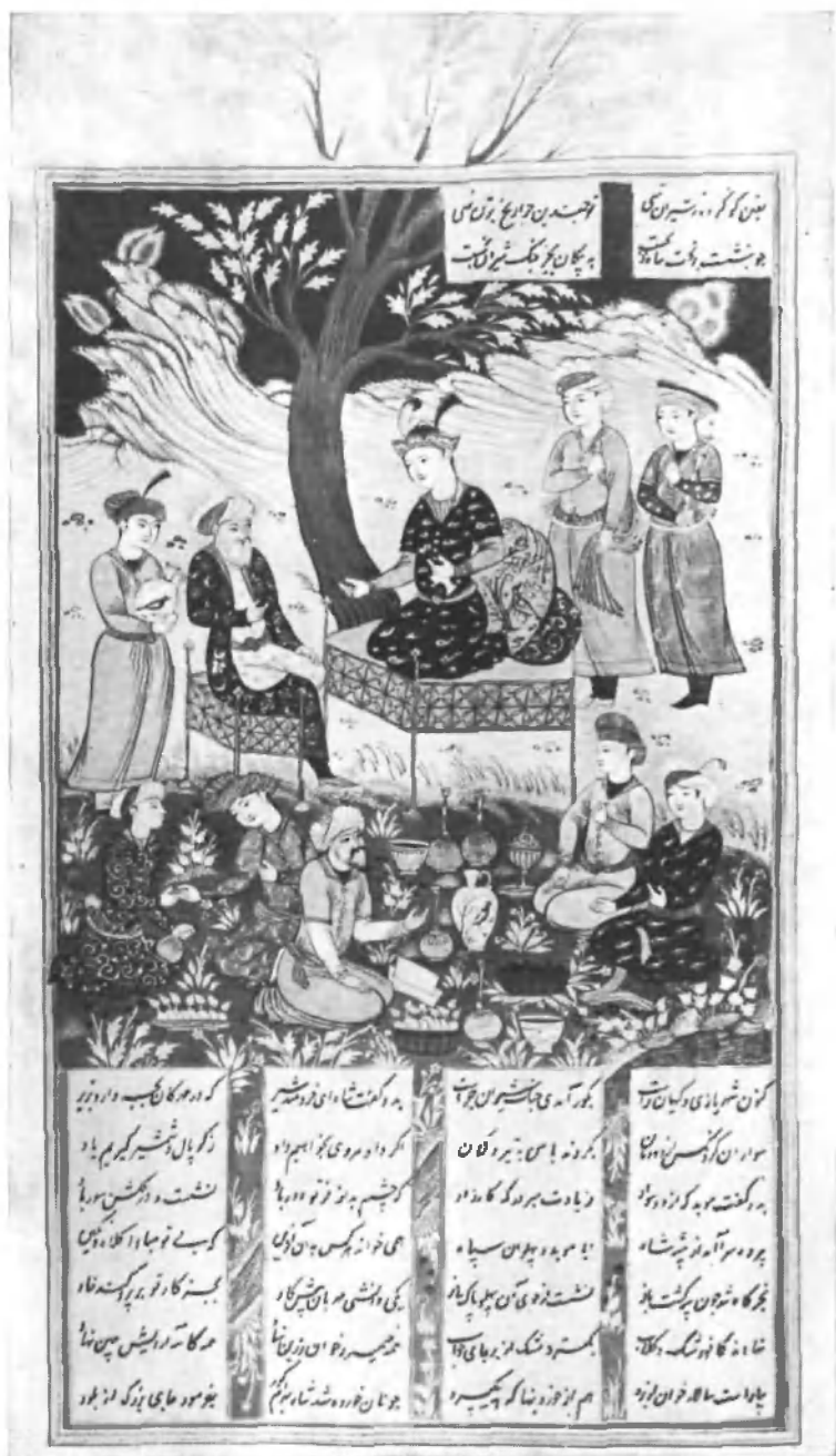
Бетрам-Гур беседует с моледами