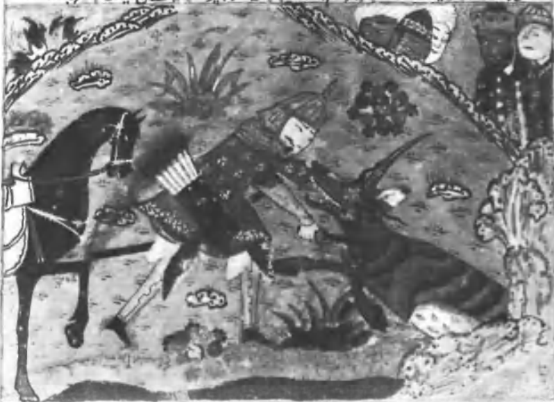
Беграм убивает индийского носорога