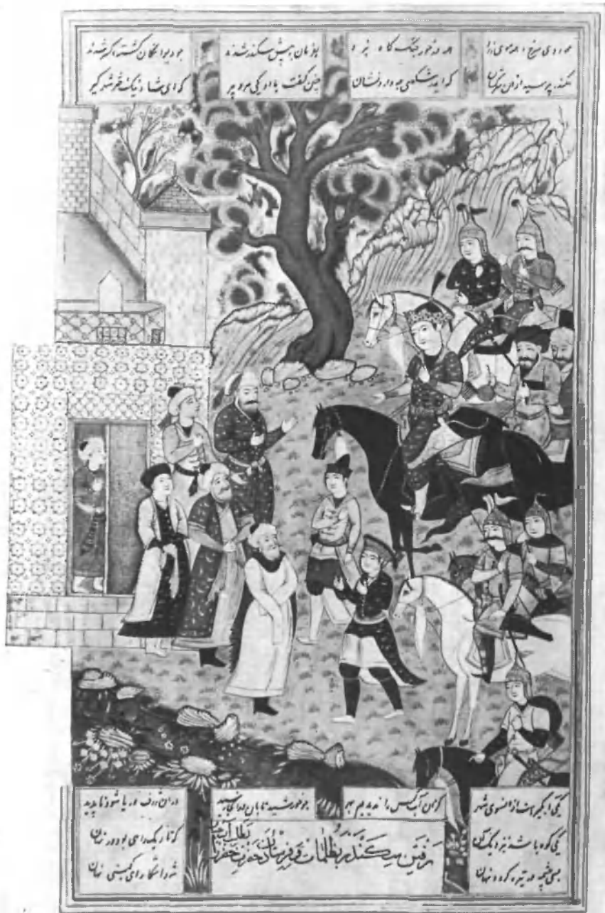
Искандер отправляется за живой водой

Лист 659 худ. Реза-йе Мусаввир. Ручпись ГПБ 333 (Doga. 348—349). Исфаганская школа, сер. XVII в.