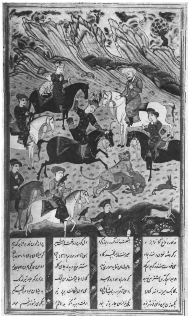
Безрам-Гур на охоте (сшивает стрелой льва и онагра)

Лист 696V, худ. Реза-Зе Мусаввир. Руконь ГПБ 333 (Допл. 318—319). Исфаганская школа, сер. XVII в.