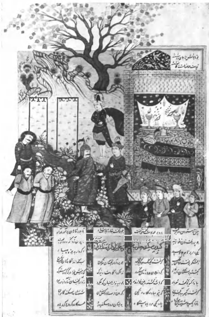
Искандер, как он вешает мобедов

Лист 642R, худ. Риза-йе Мусаввир. Ручкопись ГПБ 333 (Dorn. 318—319), Исфаганская школа, сер. XVII в.