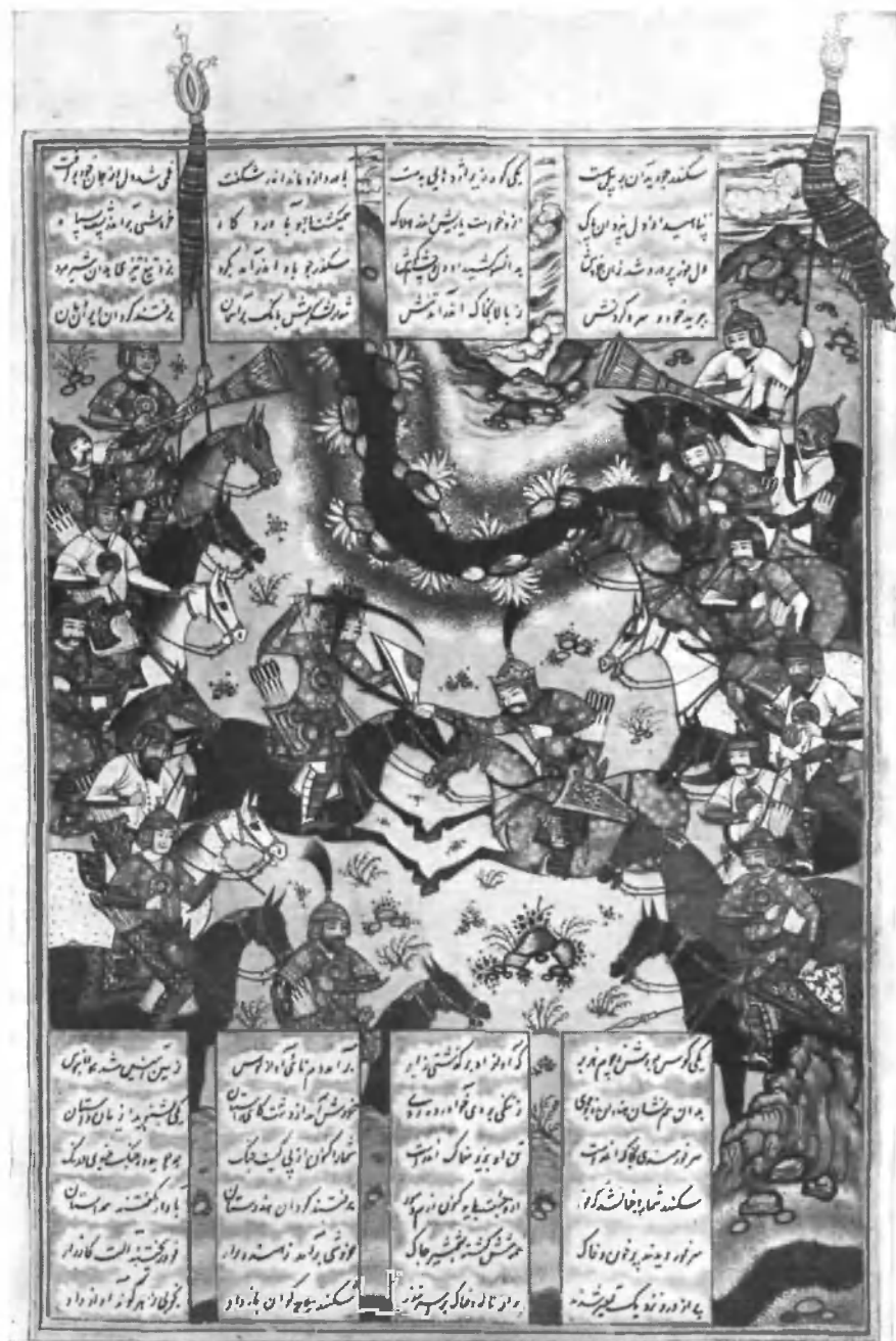
Искендер убивает фура

Лист. 650V, худ. Пир Мухаммед аль-Хафиз. Рукопись ГПБ 333 (Dorn. 318—319). Исфаганская школа, сер. XVII в.