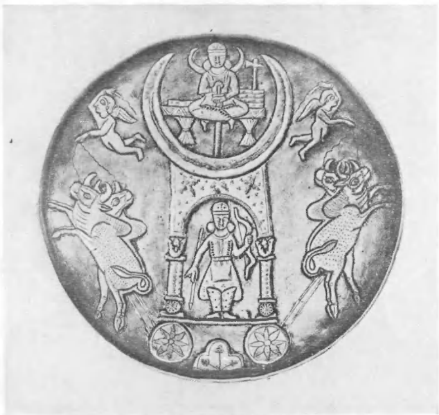
Часовой механизм трона Хосрова Парвиза (выезд лунного божества). Серебряное с позолотой блюдо. Государственный Эрмитаж