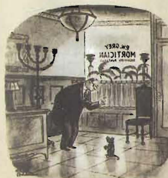
"Now play dead."

Дядюшка Фестер — настоящий романтик, спит в гробу, любит игры с динамитными шашками, стесняется женщин, но ждет большой и чистой любви. В качестве коронного трюка, чтобы завоевать женское сердце, засовывает себе в нос макароны.