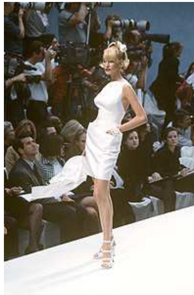
Prêt-a-porter («готовое платье»)

В показах Haute couture, как правило, принимают участие известные модели, которые привлекают внимание прессы не меньше, чем сама коллекция. В то же время существует обратная связь: модель, которая принимает участие в показе Haute couture, серьезно повышает свой рейтинг. Когда неизвестная модель завершает показ в свадебном платье у известного кутюрье, она делает шаг в категорию «топ». Триумфальный выход на подиум будет растиражирован средствами массовой информации, а топ-модель — это лицо, которое знают во всем мире.