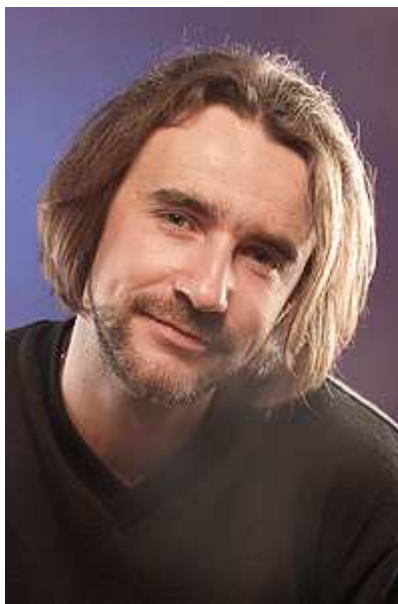
Александр Мордерер, фотограф

Выбирая модель для съемки, я доверяю портфолио, в котором есть образцы рекламных работ. Хорошему фотографу не составит труда за один съемочный день отснять модель в нескольких образах. Но буки с тестовыми фотографиями могут привлечь лишь непрофессиональных заказчиков. Профессионалу нужны доказательствами опытности модели. Поэтому не забывайте пополнять портфолио фотографиями с показов, страницами из журналов и рекламными работами. Ваш бук должен представлять вас наиболее выигрышным образом. Если вы работали с новым фотографом, если ваше фото появилось на обложке журнала, если вы стали лицом рекламной кампании — портфолио должно рассказать об этом заказчикам. А если вы меняли образ: покрасили волосы, изменили прическу, округлили грудь или увеличили губы — нужно дополнить бук новыми фотографиями, потому что вы стали другой.