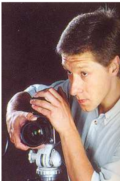
Сергей Юшков, фотограф

Очень важна индивидуальность модели, потому что модель — это часть рекламного продукта. И речь должна идти не о красоте в традиционном понимании, а о необходимых внешних данных. К поиску лица компании подходят тщательно — они ищут воплощение рекламного продукта. Поэтому супер-красавица, которая заходит, не поздоровавшись, молчит, тупо смотрит в одну точку, не улыбается, отдает бук, разворачивается и уходит, не попрощавшись, вероятнее всего, не станет лицом рекламной компании. Клиент ждет другого отношения. Нужно зайти, поздороваться, улыбнуться, ответить на вопросы (по возможности остроумно) и опять улыбнуться. Нужно себя вести в меру раскованно и быть приятной в общении, чтобы стало понятно, что вы отличаетесь от других не только цветом глаз, что вы — индивидуальность во всем.