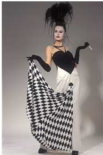
Авангардная мода, или альтернативная мода

Кроме общемировых показов prêt-a-porter, которые проходят в центрах моды, проводятся национальные дни оды. В Украине с 1997 года проходит украинский аналог парижской недели prêt-a-porter, который называется «Сезоны моды». В украинских «Сезонах моды» могут участвовать только отечественные модельеры, которые демонстрируют одежду, предназначенную для продажи в салонах и магазинах.