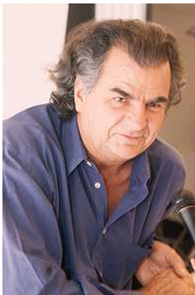
Патрик Демаршелье, фотограф

Настоящая работа — это поймать модель в момент спокойствия. Вот тогда модели получаются естественными и красивыми. Вот тогда я их и фотографирую.