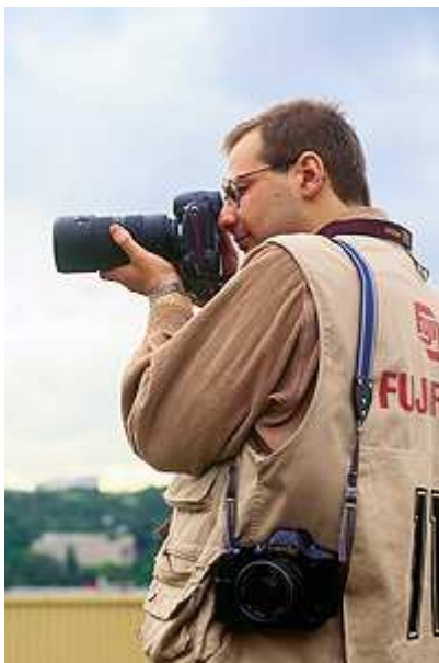
Валентин Карминский, фотограф

Независимо от того, какую манеру съемки выбирает фотограф, модель должна уметь позировать. Она должна знать, в каких ракурсах выглядит более фотогенично, и какое выражение лица наиболее удачно. Модель должна знать, что ей можно делать в кадре, а чего делать не стоит, кроме тех случаев, когда следует прямое указание сделать так, а не иначе. Конечно, фотограф выскажет замечания по поводу вашей работы: посоветует изменить позу или обратит ваше внимание на выражение лица, которое понравилось ему больше всего. При этом модель не имеет права возмущаться и протестовать, когда ей кажется, что фотограф запечатлел ее (по ее мнению) неудачно. Нужно понимать, что на съемках работают специалисты, которым виднее, что лучше сделать для того, чтобы получить задуманный сюжет. Стоит помнить, что от модели прежде всего ждут профессионализма.