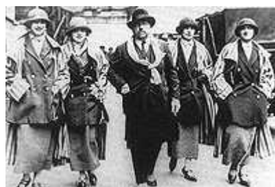
Поль Пуаре и его модели

Первое упоминание о модельном бюро, датированное 1915 годом, историки моды обнаружили в Соединенных Штатах. Примерно в то же время мадам Люсиль, открывшая свой Дом моделей в Лондоне в 1890 году, устроила в Нью-Йорке шоу с участием 150-ти манекенщиц, по масштабу вполне сравнимое с современными показами. Чарльз Ворт стал первым европейским модельером, который начал демонстрировать свои авторские коллекции на девушках-моделях. В 1911 году эту идею развил известный дизайнер Поль Пуаре, который организовал тур по городам Европы со своей командой манекенщиц.