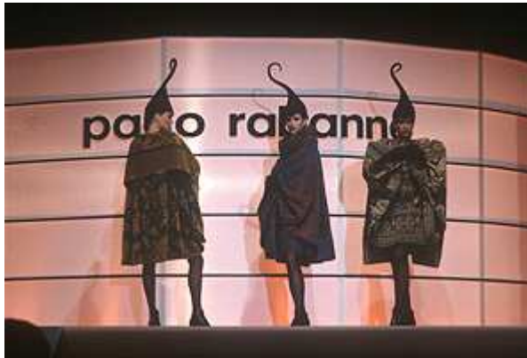
Haute couture (Высокая мода)

Haute couture (Высокая мода) — самый престижный вид показов. Как правило, показы Haute couture проходят два раза в год, зимой и летом, и самой шумной по-прежнему остается Неделя высокой моды в Париже. Настоящим couture считается одежда, созданная в Домах высокой моды — это вершина искусства и мастерства, которое может продемонстрировать модельер. Вещи Haute couture создаются ручным способом в единственном экземпляре, для их изготовления используются дорогие материалы, уникальная фурнитура и самые современные технологии.