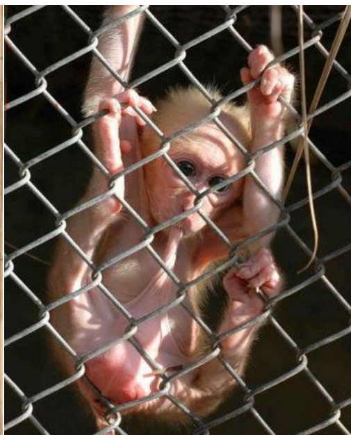
Жизнь № 2

Но учти, что за Жизнь № 1 придется поработать над собой, а за Жизнь № 2 напрягаться не нужно. Живи, как решат другие. Сунул себе в рот и сиди молчи.