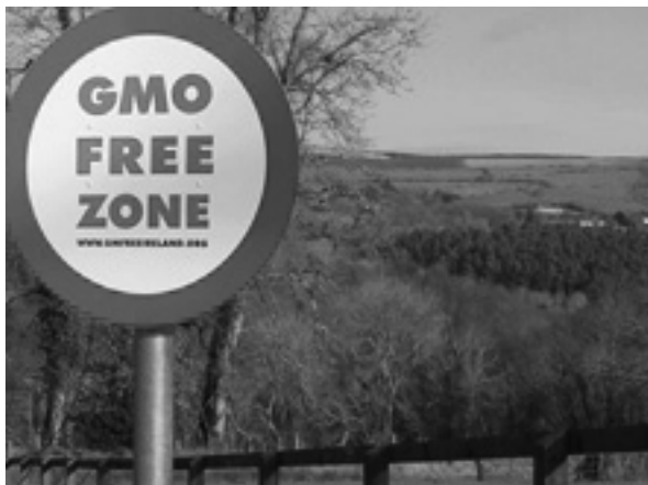
Рис. 7. Зона, свободная от ГМО