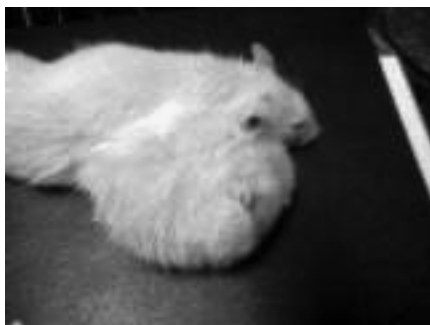
Рис. 6. Огромная опухоль у крысы, в корм которой добавляли ГМ-сою (эксперименты автора)