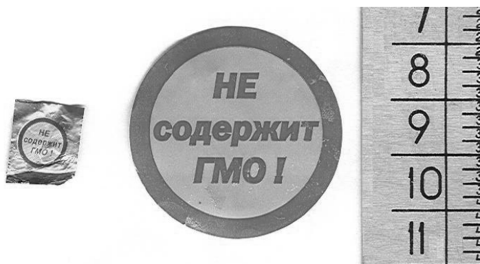
Рис. 4. Используемая в России маркировка