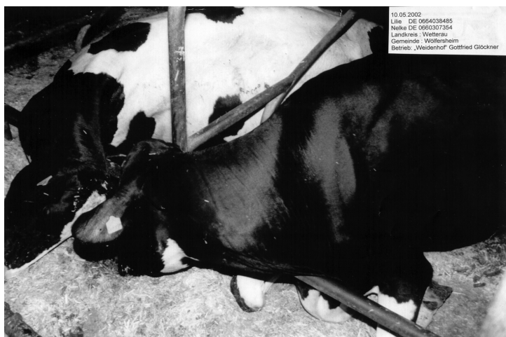
Рис. 1. Гибель коров Глокнера от ГМ-корма