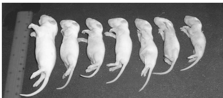
Рис. 5. Гибель крысят в первом поколении при добавлении в корм ГМ-сои, устойчивой к гербициду «Раундапу» (линия 40.3.2), в экспериментах автора (И.В. Ермаковой)