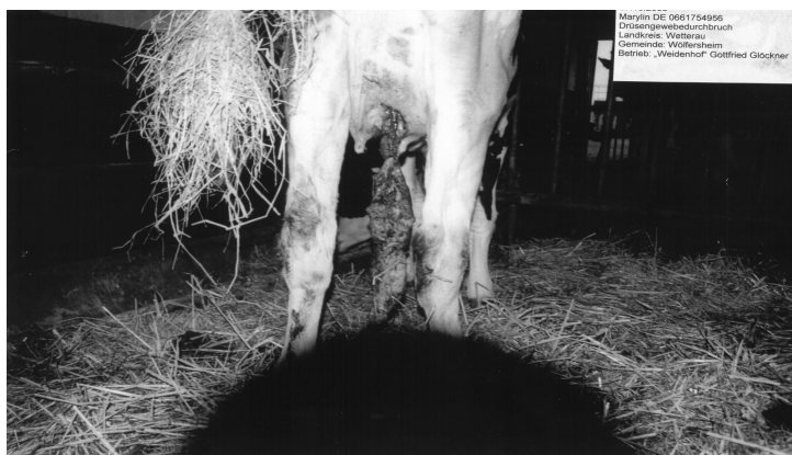
Рис. 2. Коровы Глокнера с разрушенным выменем