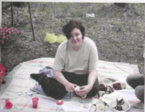
На пикнике в Подмоскowie - начало мая 2005 г. - 88 кл