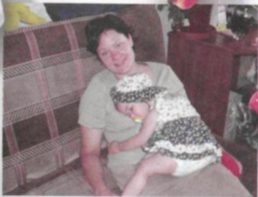
Март 2005 г. - 90 кл