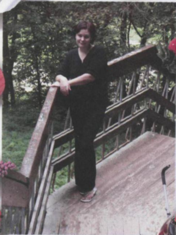
Коломенское, июль 2005 г., около 80 км