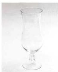
Харикейн 450–480 мл