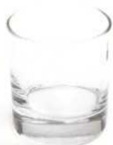
Олд-фэшн 100–300 мл