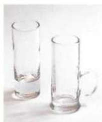
Пусс-кафе 50–75 мл