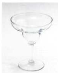
Маргарита 200–250 мл