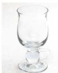
Айриш-кофе 200–250 мл