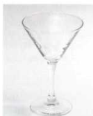
Коктейльная рюмка. Бокал Мартини 90–150 мл