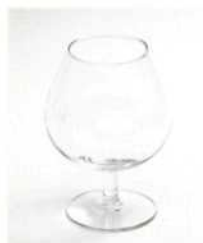
Коньячный бокал 250–500 мл