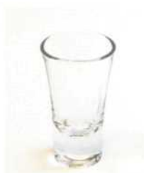
Стопка. Шот. Джиггер 40–60 мл