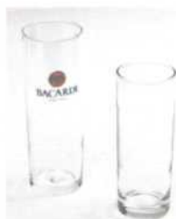
Хайбол. Тумблер 150–300 мл