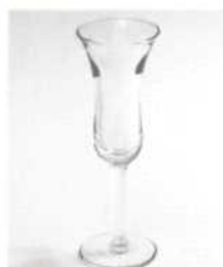
Ликерная рюмка 25–50 мл