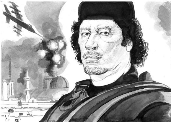
Рис. Геннадия Животова