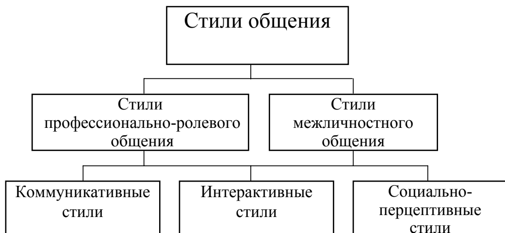
Рис.1. Соотношение стилей общения

Эти соотношения можно представить в виде следующей схемы.