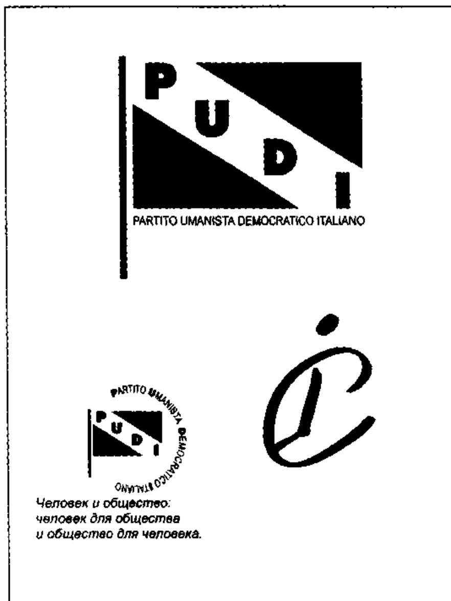
Рис. 2. Флаг и логотип гуманистически-демократической партии Италии