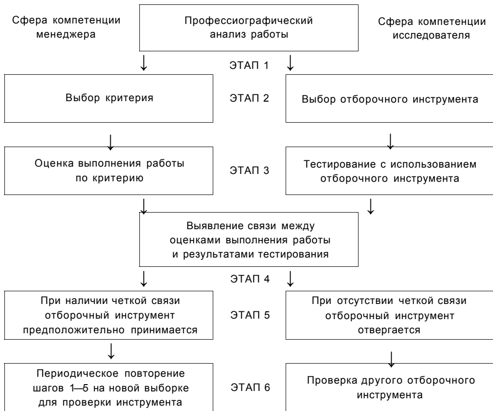
Рис. 7.1. Модель основного отбора

с учетом как внешних обстоятельств, которые могут повлиять на результаты (например, сезонность), так и влияния других людей (в рабочей команде) на критерий (или критерии) выполнения работы. На четвертом этапе производится поиск корреляционной зависимости между результатами тестирования и оценками выполнения работы или, что предпочтительнее, применяется какая-либо процедура многомерной статистики (регрессионный анализ), которая позволяет определить, какие из нескольких характеристик (возраст, опыт работы, пол и т. п.) наряду с факторами, оценивавшимися с помощью отборочного инструмента, связаны с выполнением работы. Если выявлена статистически значимая и теоретически обоснованная связь, то отборочным инструментом можно пользоваться. В противном случае необходимо выбрать другой инструмент и повторить все с начала (этапы 5 и 6).