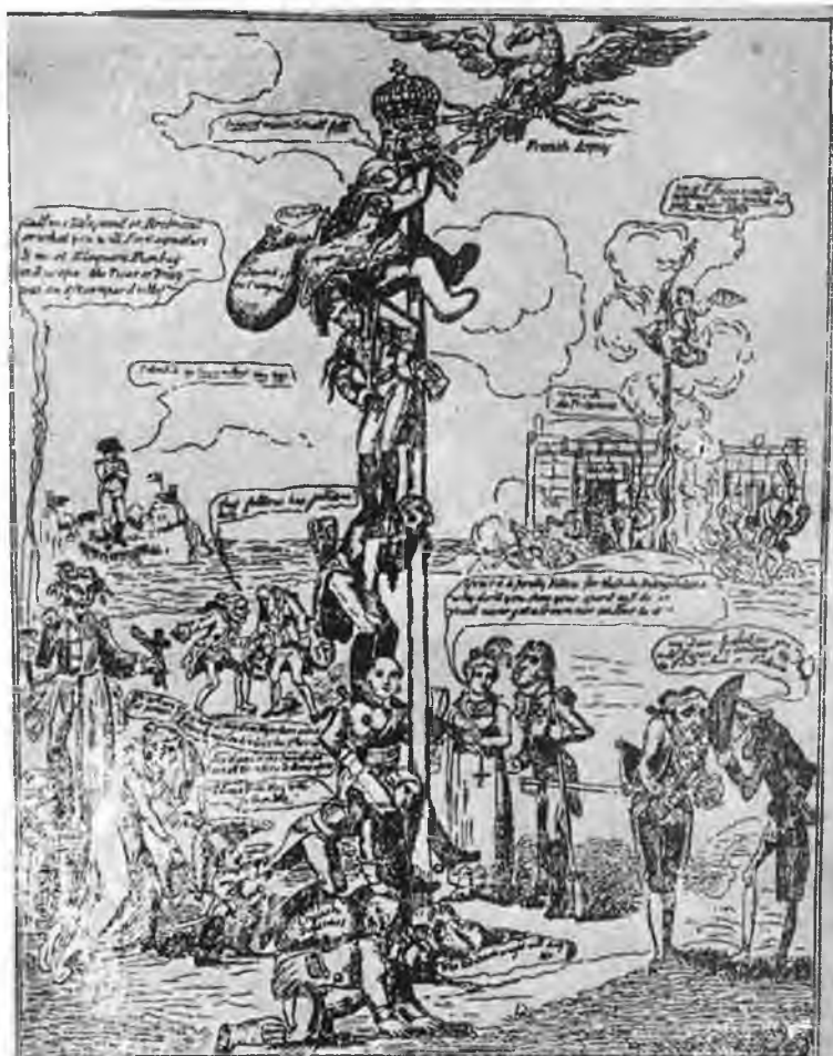
«Коканская мачта или Людовик XVIII, поддерживаемый союзниками».