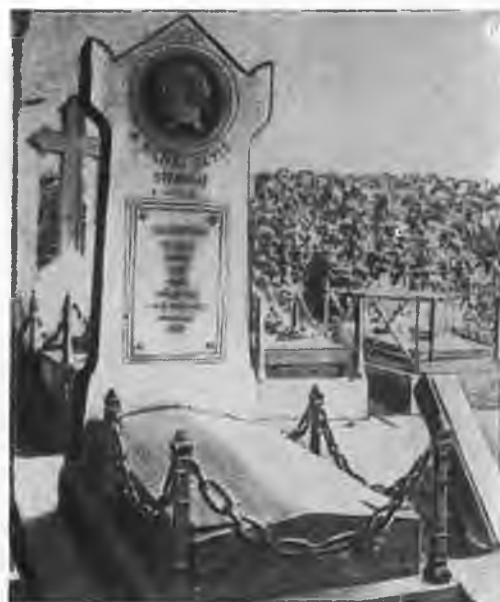
Могила Стендаля на кладбище Монмартр в Париже.