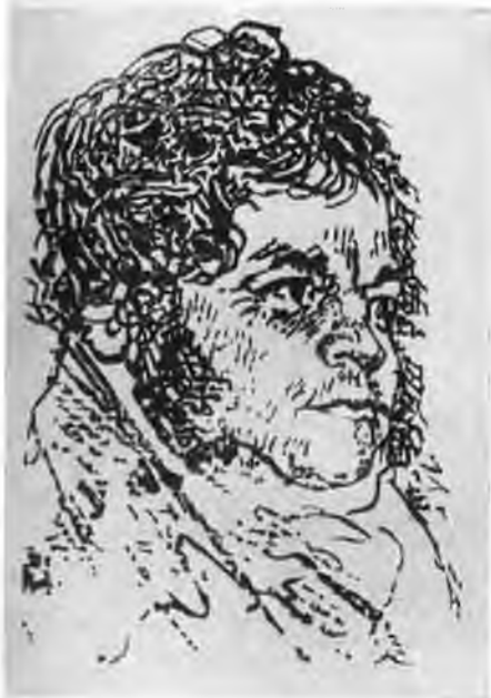
Стендаль в 1824 году. Портрет, приписываемый ученику Давида, фран- цузскому художнику Ж.-Б. Викару