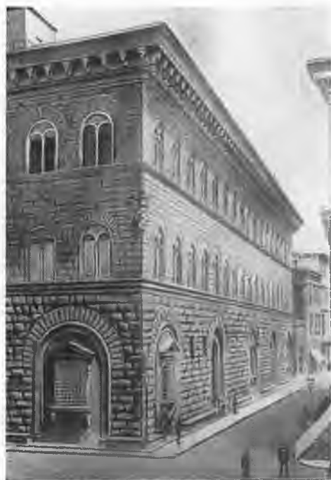
Палаццо Риккарди во Флоренции.