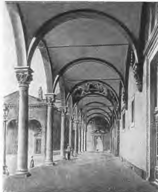
Воспитательный дом во Флоренции.