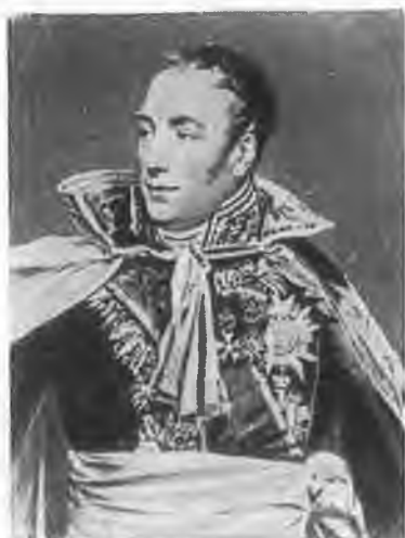
Маршал граф Пьер Дарю.