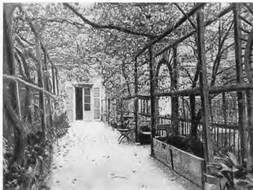
Трельяж Стендаля на террасе квартиры Ганьона в Гренобле.