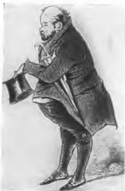
«Господин де Фонжеран». Карикатура на Бейли работы Анри Монье.