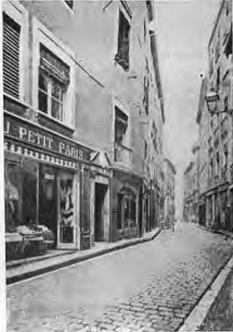
Дом в Гренобле, где родился Стендаль.