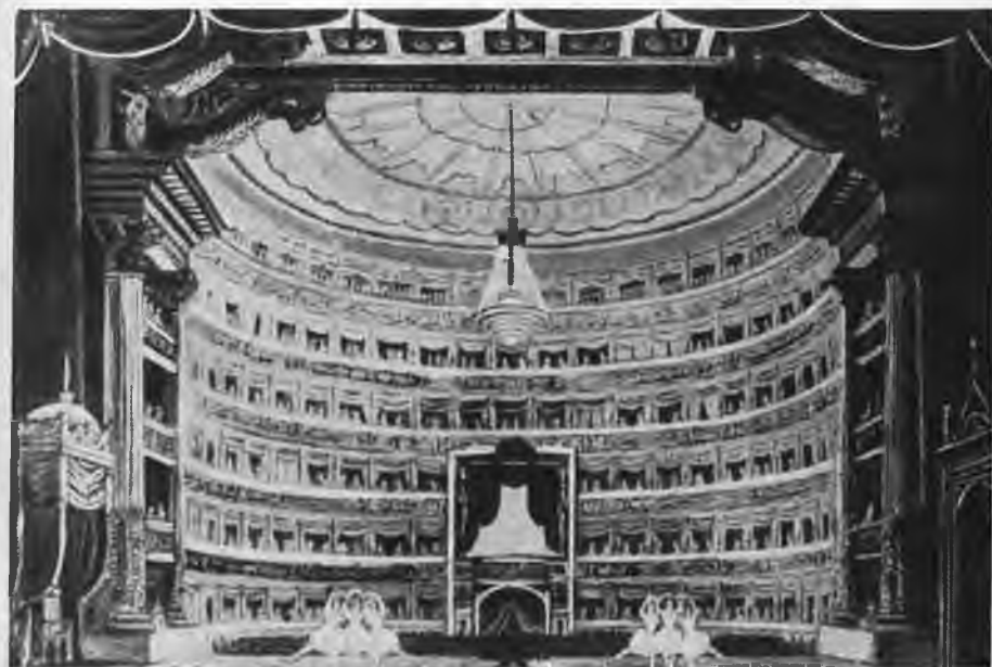
Миланский театр (Ла Скала).