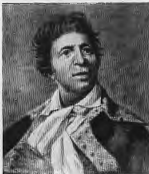
Марат. Портрет неизвестного художника Собрание Карнавале.