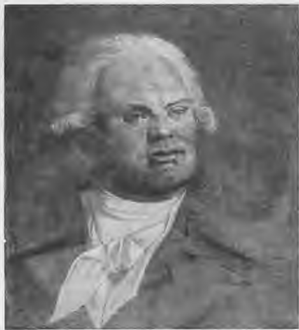
Дантон. С картины неиз- вестного художни- ка. Собрание Кар- навале.