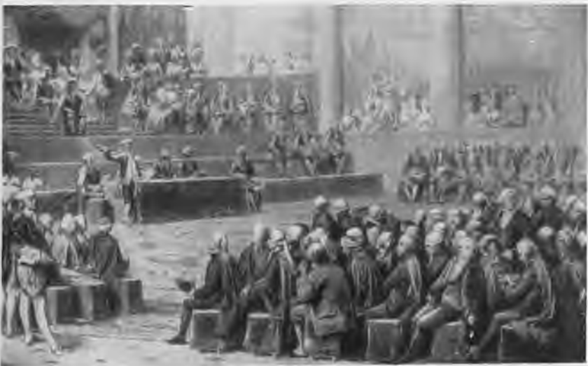
«Открытие Генеральных штатов в Версале 5 мая 1789 года». С картины Кудэ (Версальский музей)