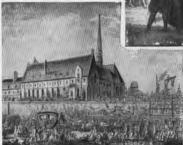
«Приезд короля в Париж 6 октября 1789 года». Гра- виюра Берто,