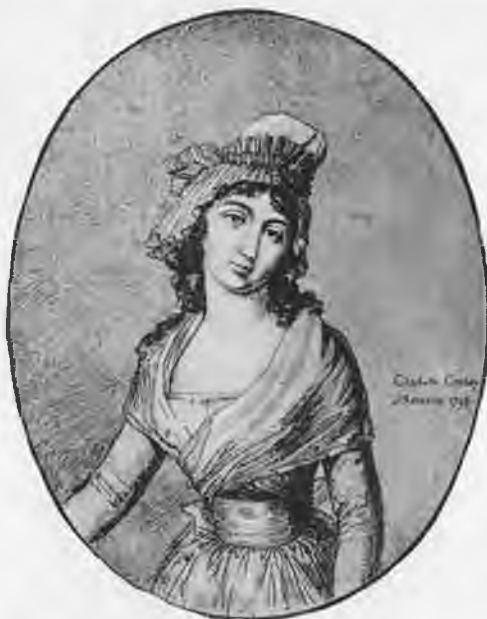
Шарлотта Корде. Карандашный рису- нок 1793 года. Кол- лекция Карнавале.

Декрет Национального Кон- вента о похоронах Марата.