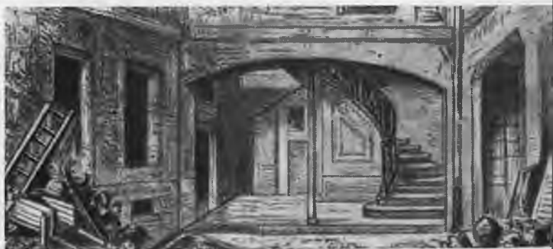
«Квартира Марата». Гравюра неизвестного автора.