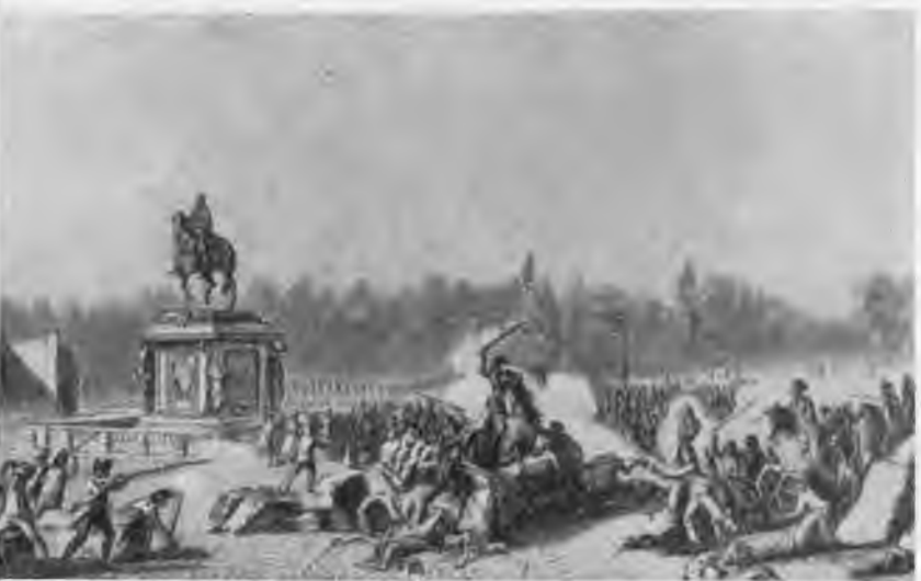
«События на площади Людовика XV 12 июля 1789». Гравюра Берто по рисунку Приера.