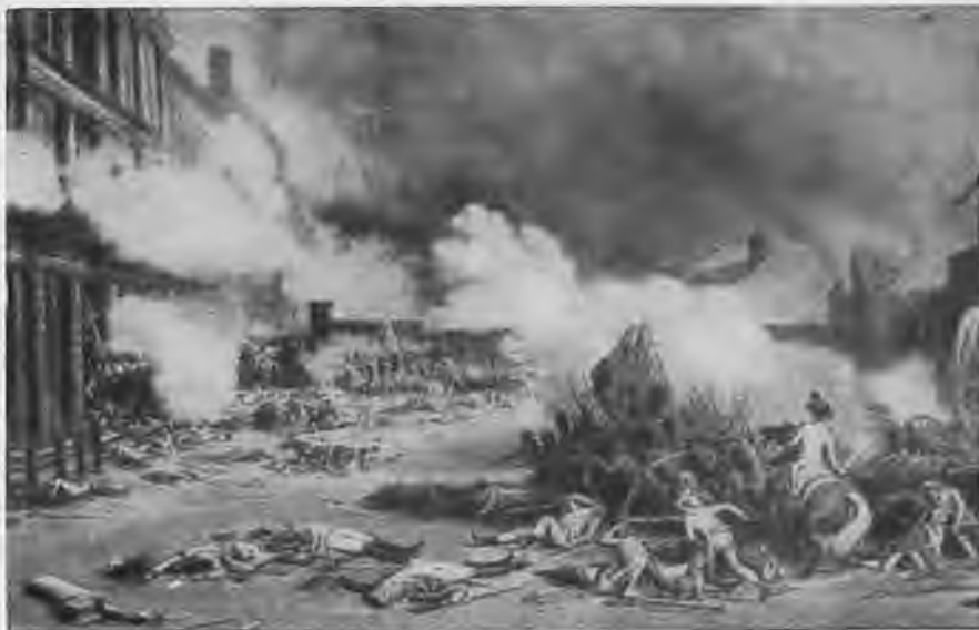
«Взятие Тюильри 10 августа 1792 года». Картина Дюплесси-Берто (Версаль).