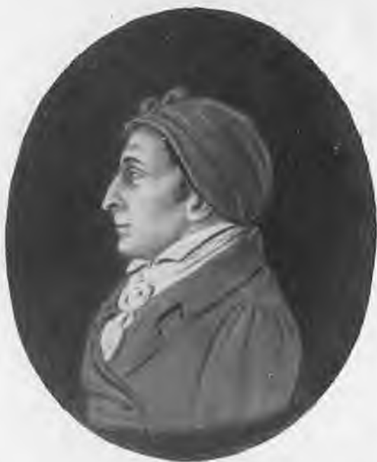
Жан Поль Марат. Восковой барельеф неизвестного худож- ника. XVIII век.