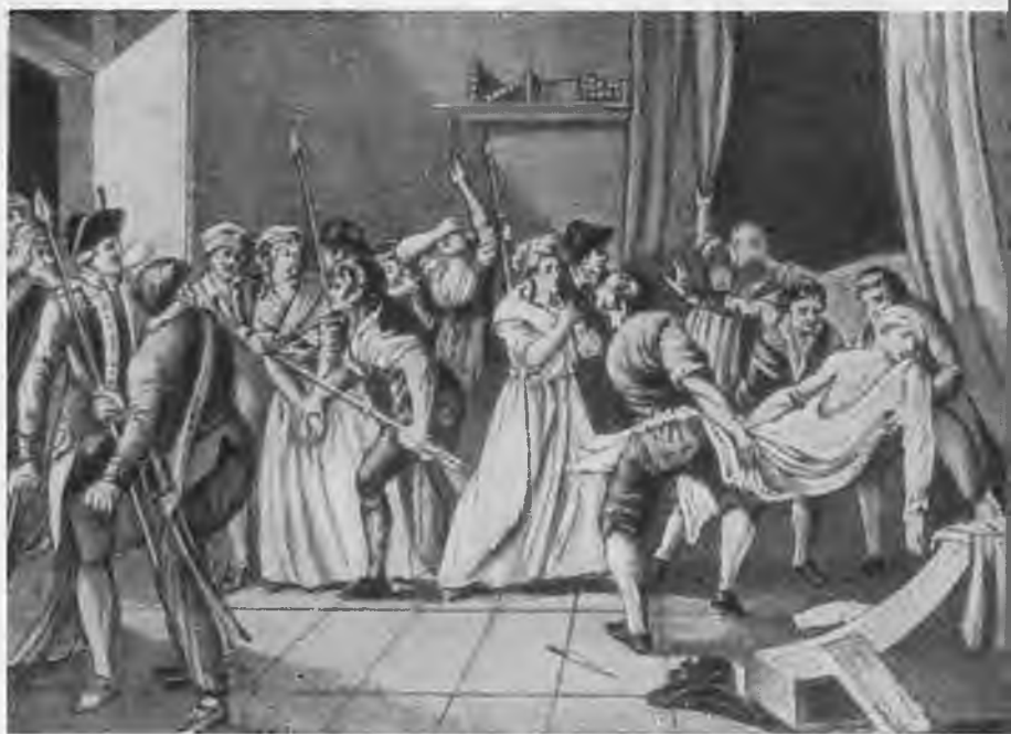
«Убийство Марата». Гравюра Винкелоса по рисунку Бриона.