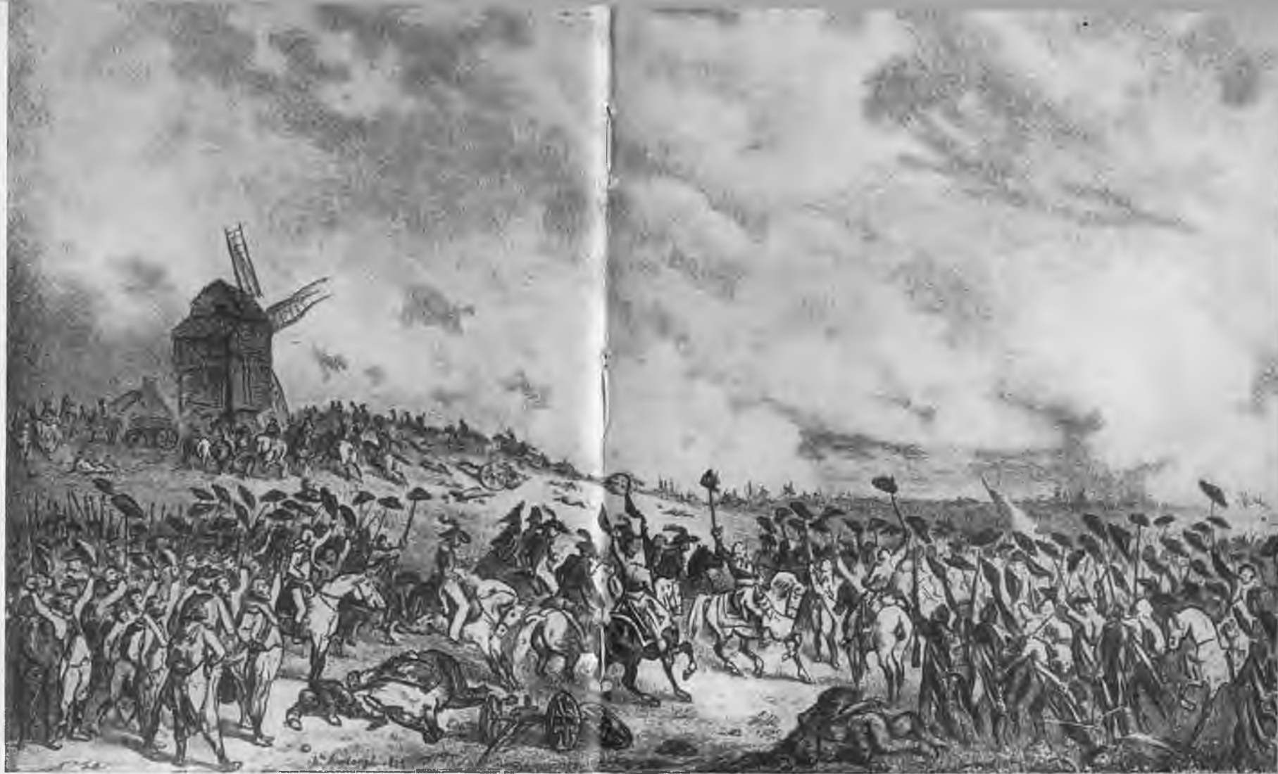
«Битва при Вальми 20 сентября 1792 года». Литография Белланже.