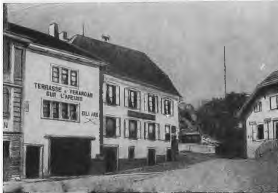
Дом, в котором родился Марат.