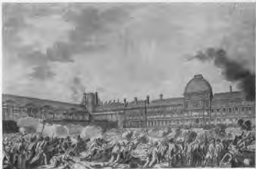
«10 августа 1792 года». Гравюра Хельмана по рисунку Монне.