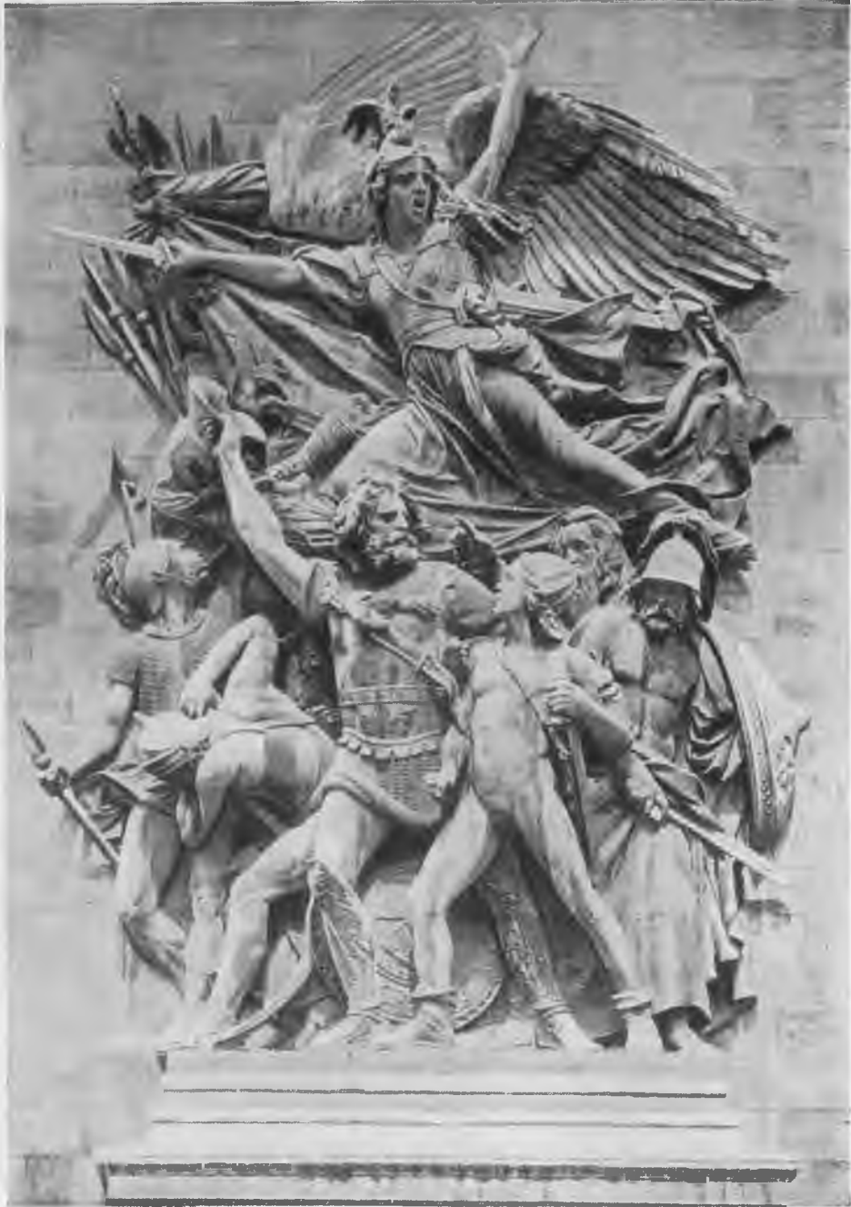
«Война». Скульптура де Рюда.