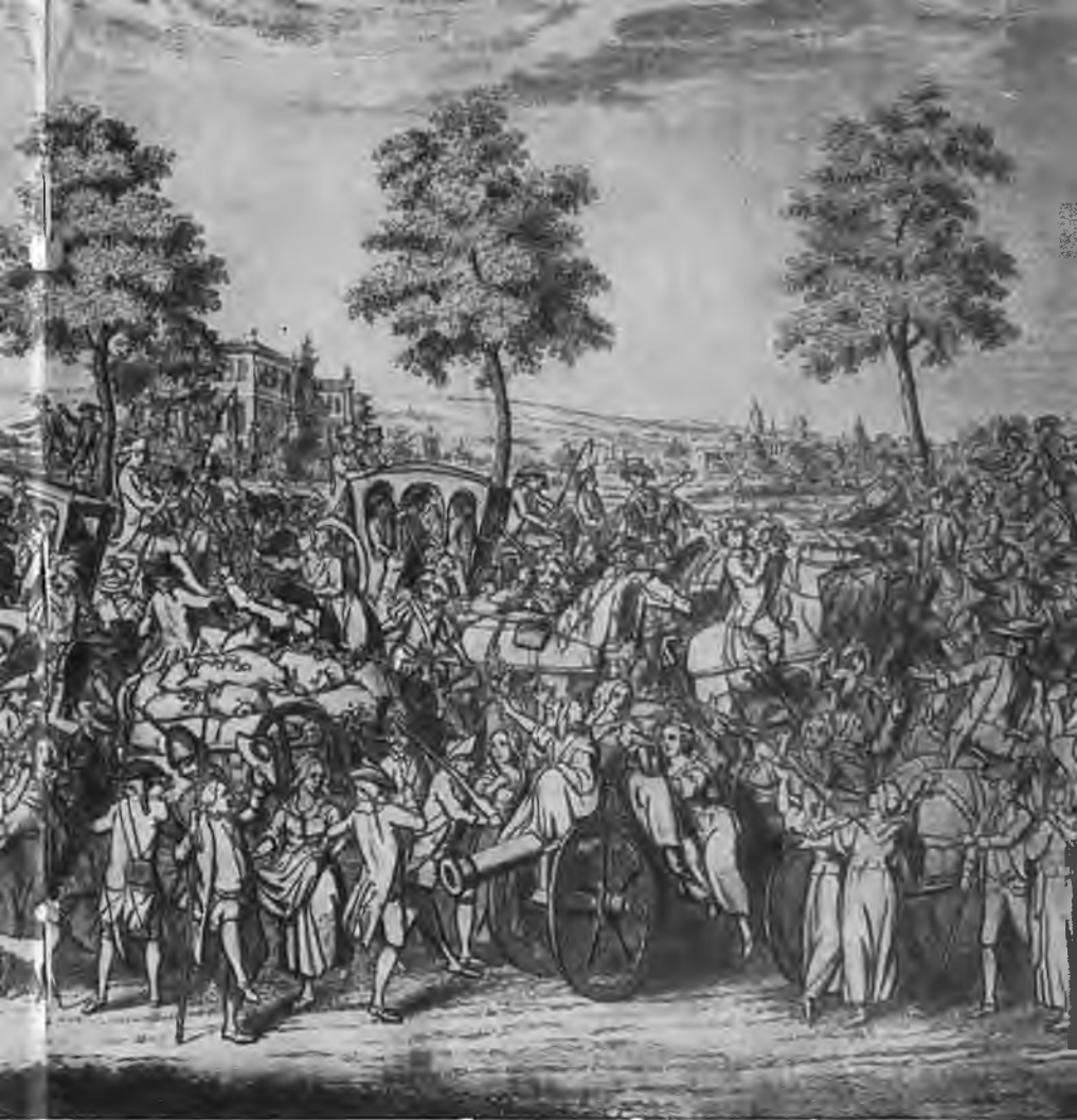
«Возвращение королевской семьи в Париж 6 октября» (современная гравюра).