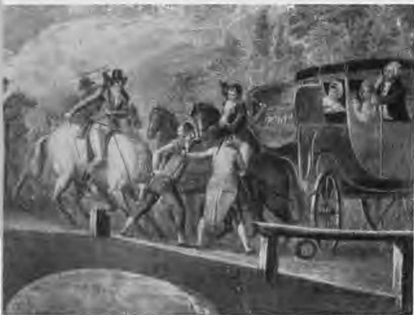
«Арест короля в Варенне 21 июня 1791 года». По гравюре М. Бови.