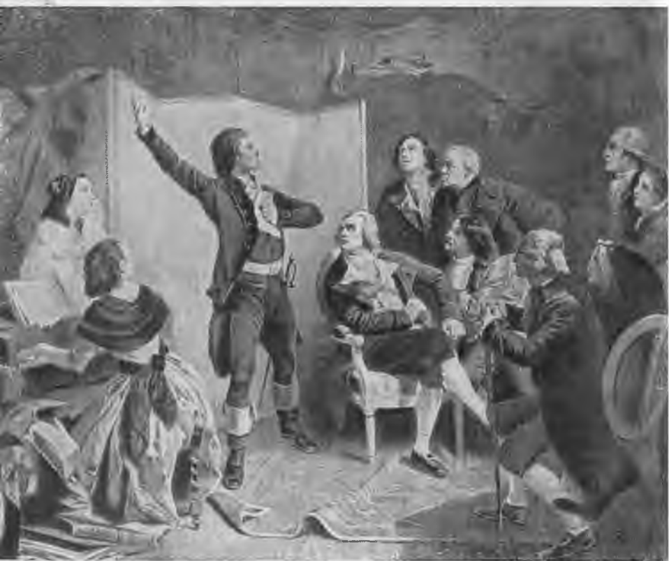
«Роже де Лиль поет впервые «Марсельезу» у мэра Страсбурга Д. Дитриха». По картине де Пиля (Лувр).