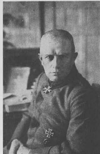
Фон дер Гольц, генерал-майор