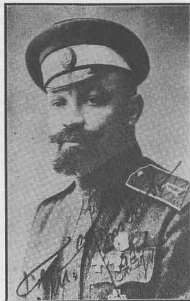
А. П. Кутепов, генерал-лейтенант