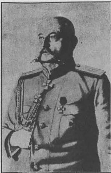
Н. Н. Юдин, генерал от инфантерии