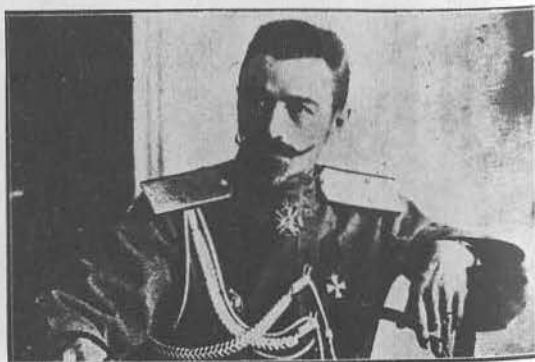
С. Л. Марков, генерал-майор