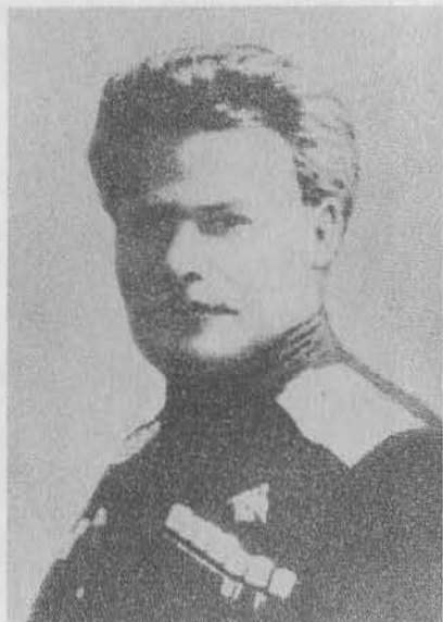
А. Г. Шкуро, генерал-лейтенант