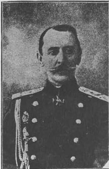
Д. Г. Шербачев, генерал от инфантерии