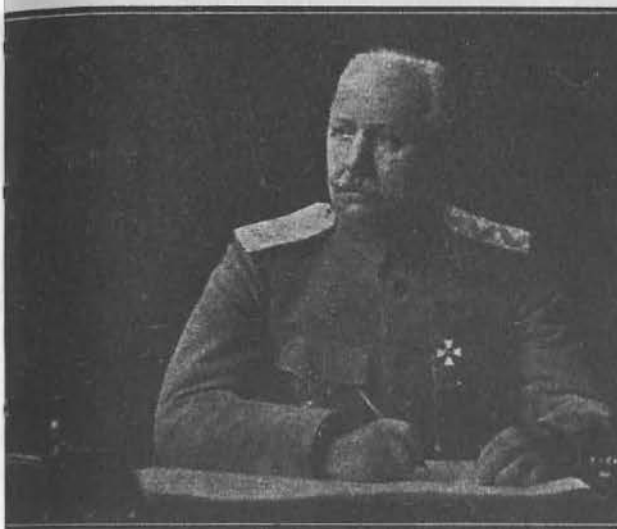
П. Н. Краснов, генерал от кавалерии