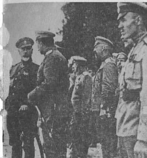
Генерал А. И. Деникин беседует с А. П. Богаевским, атаманом донского казачества. Позади него (с часами) заместитель начальника деникинского штаба генерал Ю. Н. Плющик-Плющевский. Ростов-на-Дону 1919 г.