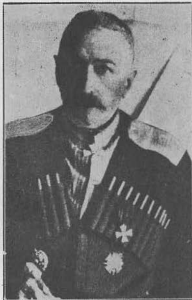
М. А. Пржевальский, генерал от инфантерии