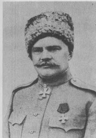
А. М. Драгомиров, генерал от кавалерии