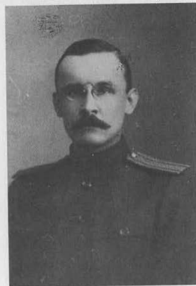
С. В. Трубецкой (1913 г.), князь, полковник