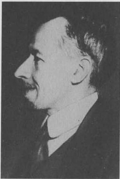
Г. А. Алексинский