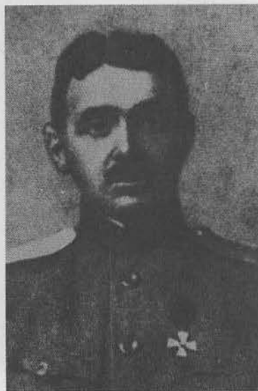
С. Г. Улитай, генерал-лейтенант