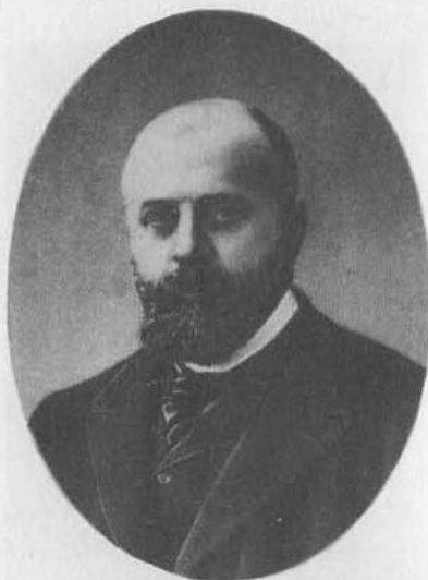
П. Д. Долгоруков

угольщика, сопровождающего и буксировщика малых судов, которые в этом будут нуждаться. Он может быть призван заправить углем под Пассеро части кораблей эскадры.