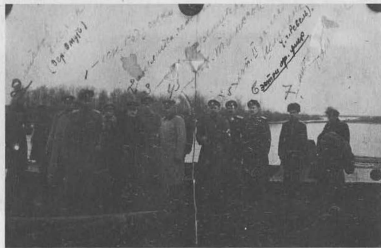
Генерал-лейтенант А. П. Родзянко в окружении офицеров