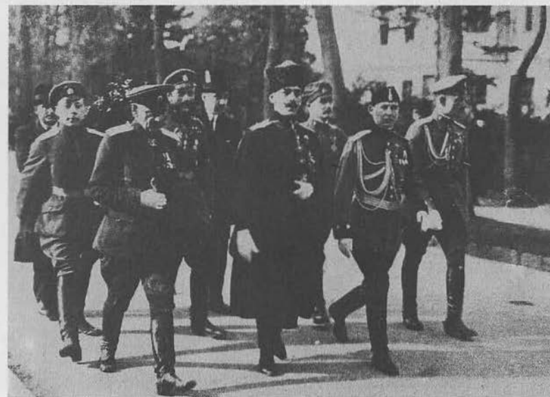
Князь П. М. Бермондт-Авалов с делегацией от Западной армии на похороонах императрицы Августины-Виктории