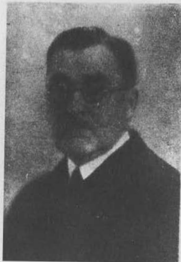
Н. Н. Головин, генерал-лейтенант