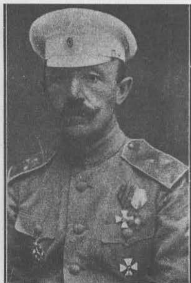
И. Г. Барбович, генерал-лейтенант