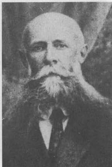
В. Г. Науменко, генерал-лейтенант