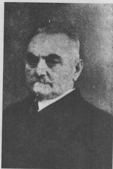
Г. Б. Андгуладзе, генерал-лейтенант