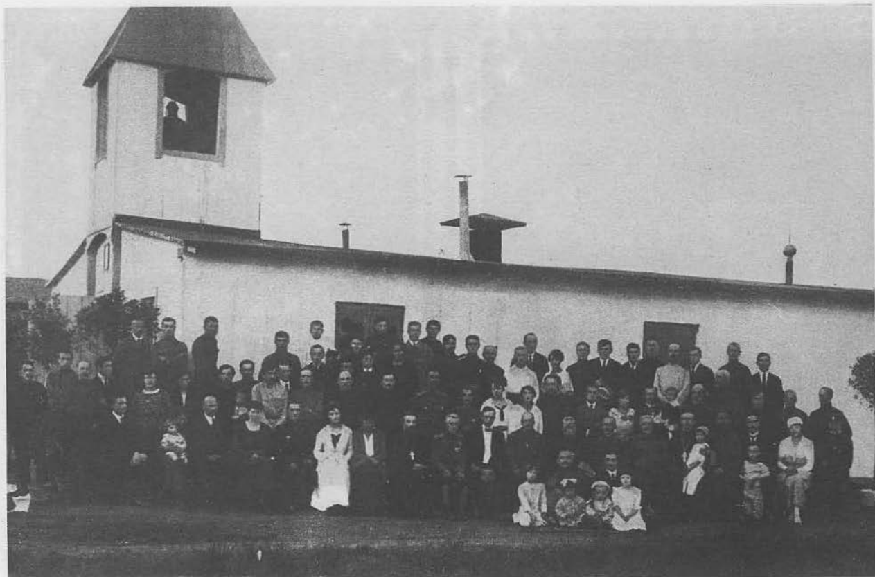
Митрополит Евлогий в лагере Альтенграбов среди офицеров, солдат и их семей