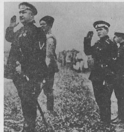
Командующий Добровольческой армией генерал-лейтенант В. З. Май-Маевский проводит смотр 2-го Корниловского полка. Лето 1919 г.