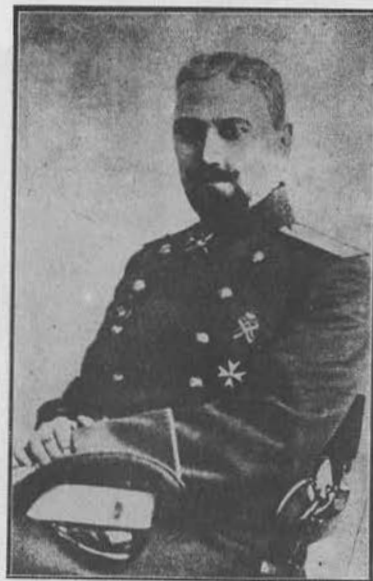
Б. В. Геруа, генерал-майор