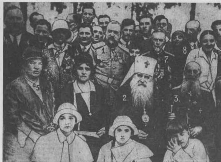
Е. К. Миллер, И. Г. Барбович, митрополит Антоний на юбилее Панчевского госпиталя