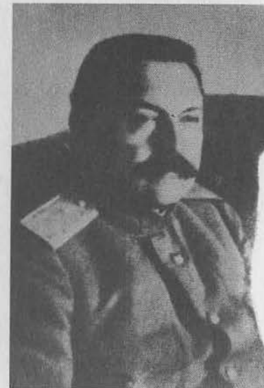
П. Х. Попов, генерал от кавалерии