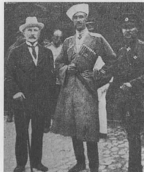
А. В. Кривошеин, П. Н. Врангель, П. Н. Шатилов. Крым 1920 г.