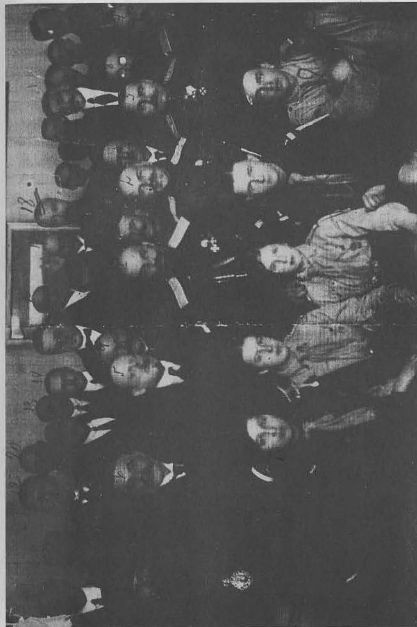
А. П. Кутепов среди скаутов