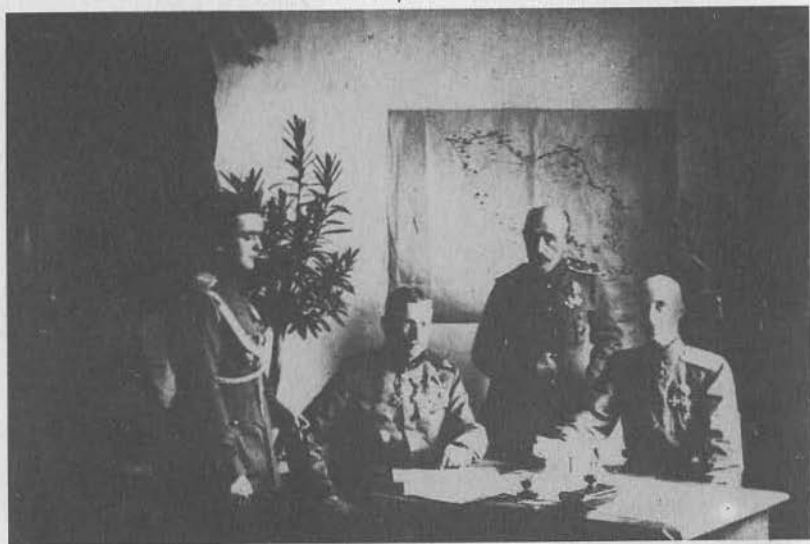
П. Н. Врангель, генерал-лейтенант со своим штабом