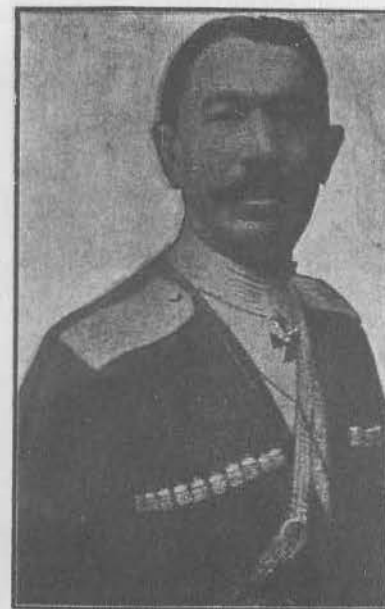
И. Г. Гулыга, генерал-лейтенант