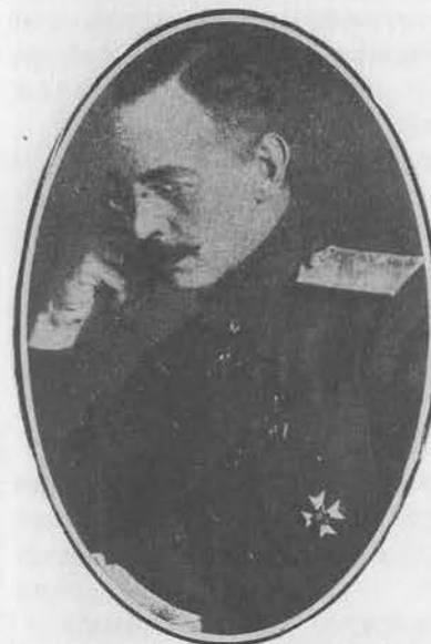
В. В. Буняковский, генерал-майор