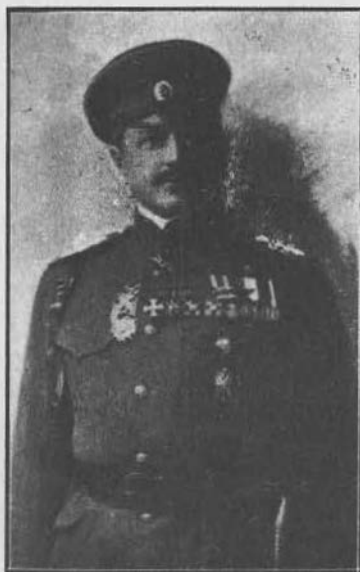
В. В. Бискупский, генерал от кавалерии