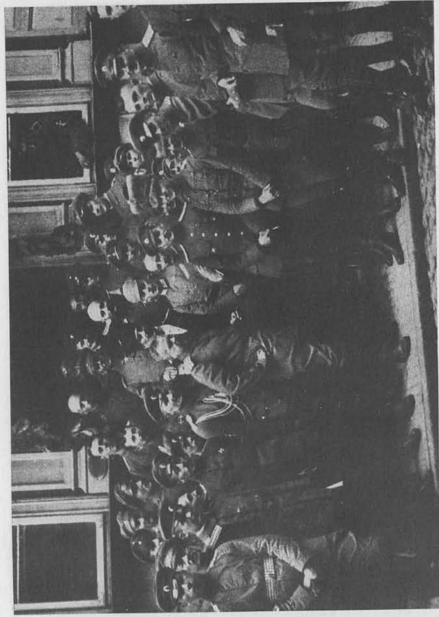
П. М. Бермондт-Авалов в день своих именин