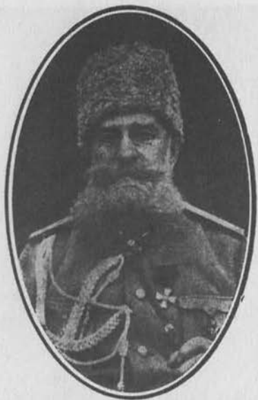
Г. А. Берхман, генерал от инфан- терии