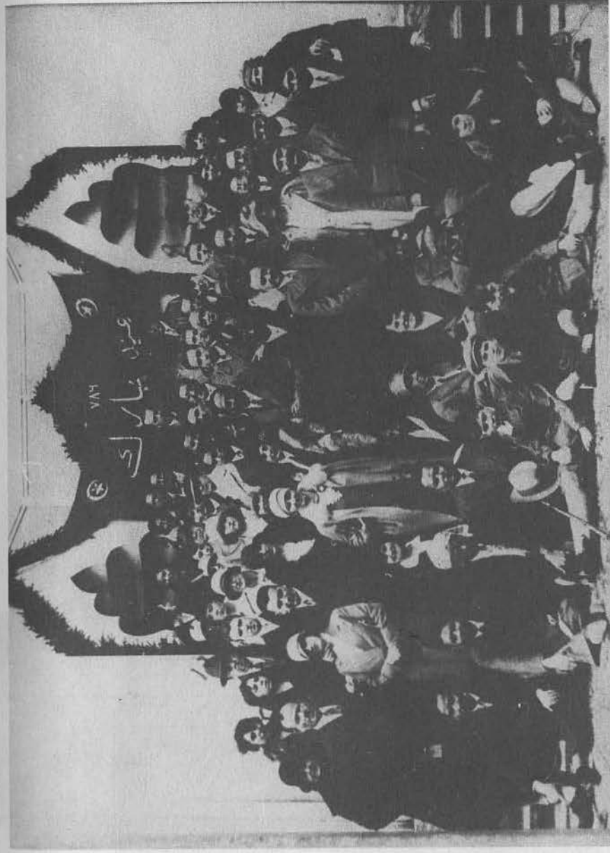
Группа мусульман-эмигрантов в Берлинской мечети