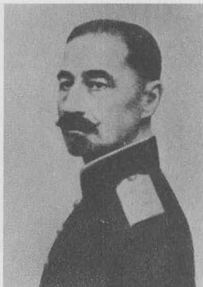
И. Г. Эрдели, генерал от инфантерии