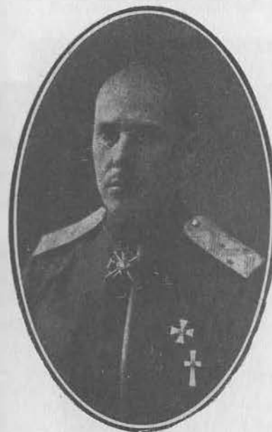
В. К. Витковский, генерал-лейтенант