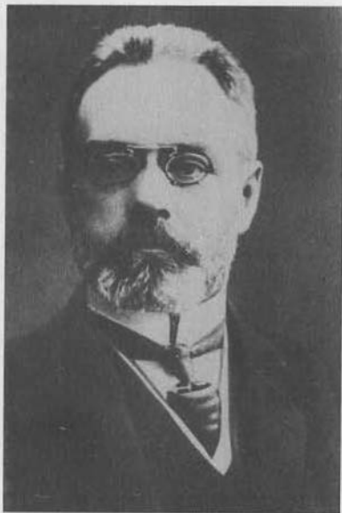
А. И. Гучков