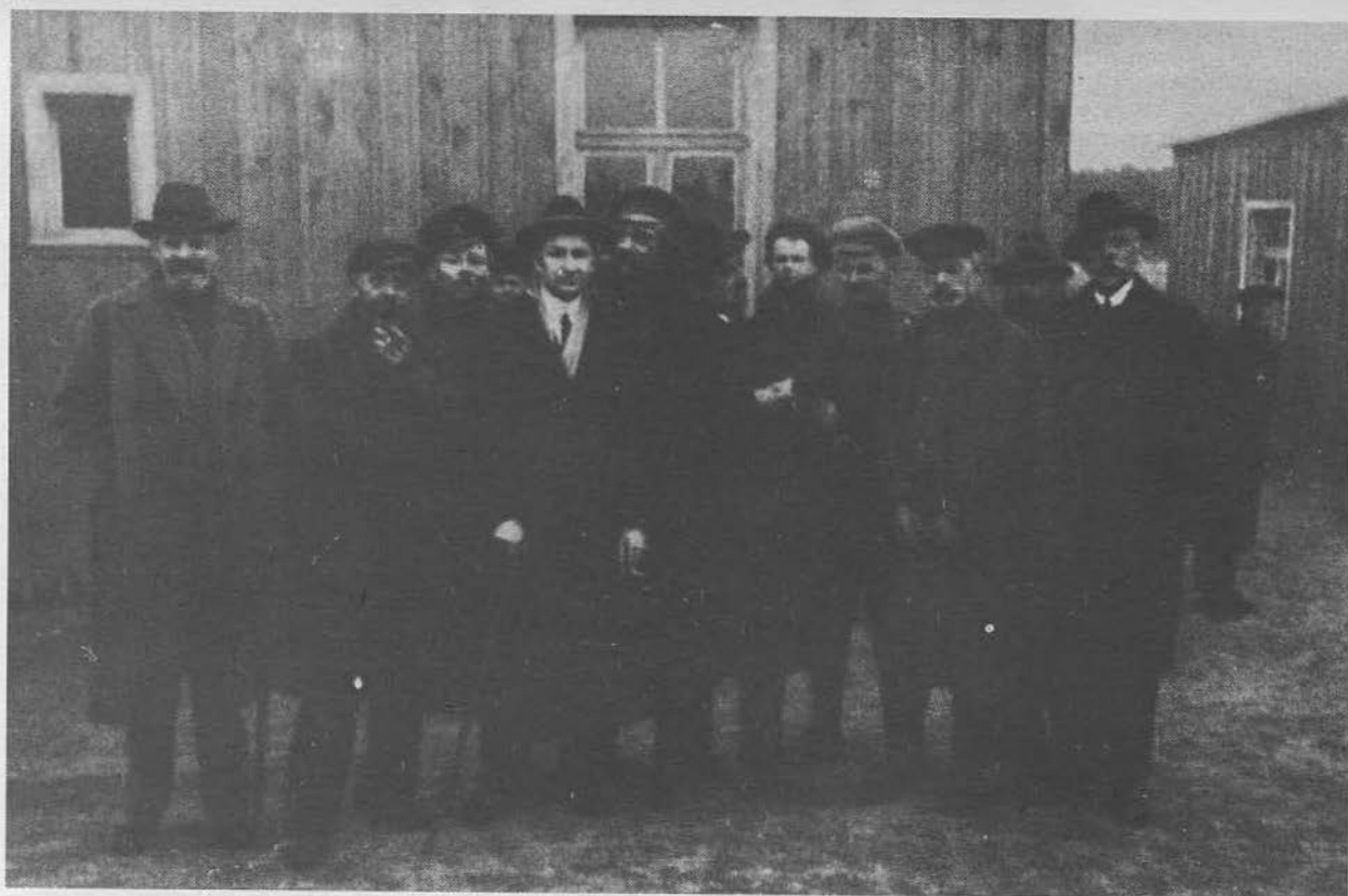
Князь П. М. Бермондт-Авалов в лагере Целле