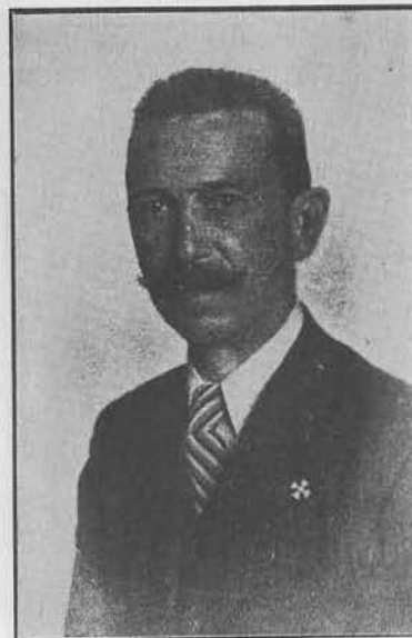
М. К. Добrorольский, генерал-майор