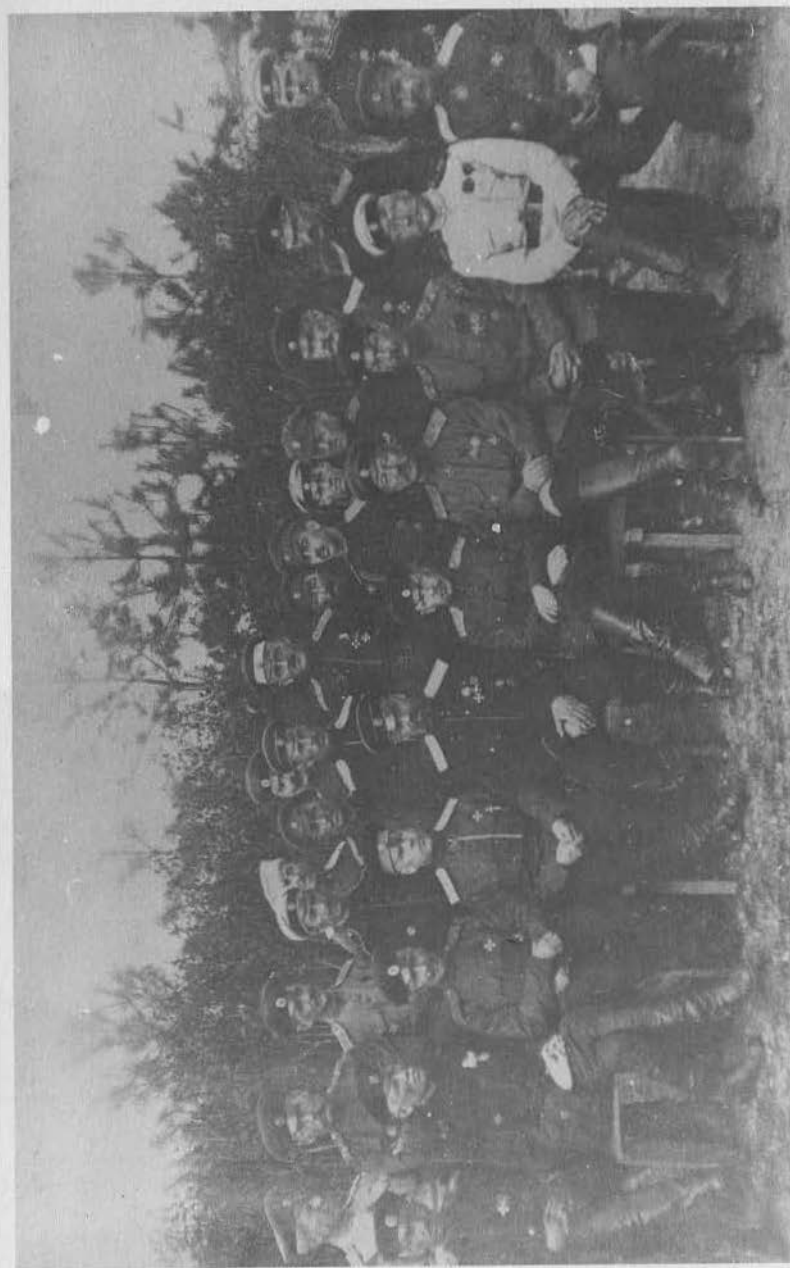
А. П. Кутепов с группой офицеров и генералов