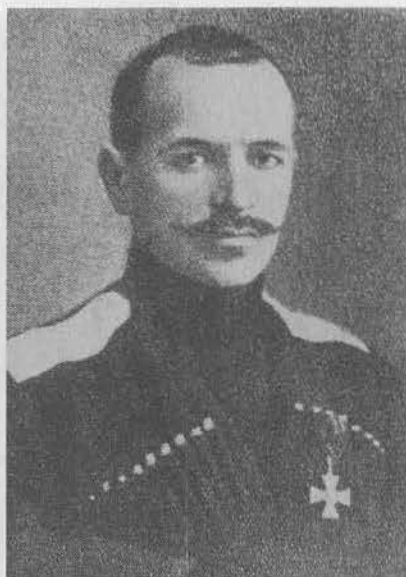
В. Л. Покровский, генерал-лейтенант