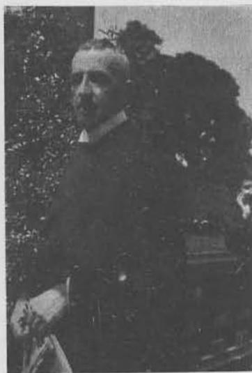
Рудольф фон Энгельсгард, барон