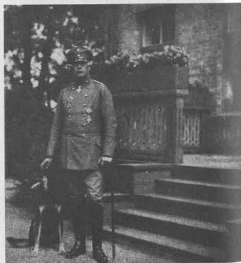
Макс Гофман, генерал-майор