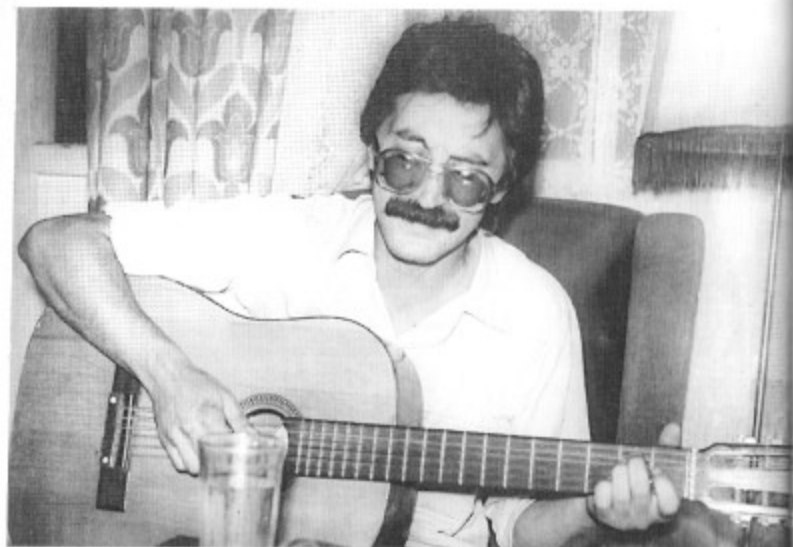
Юрий Шевчук, еще без бороды. (Начало 80-х.)