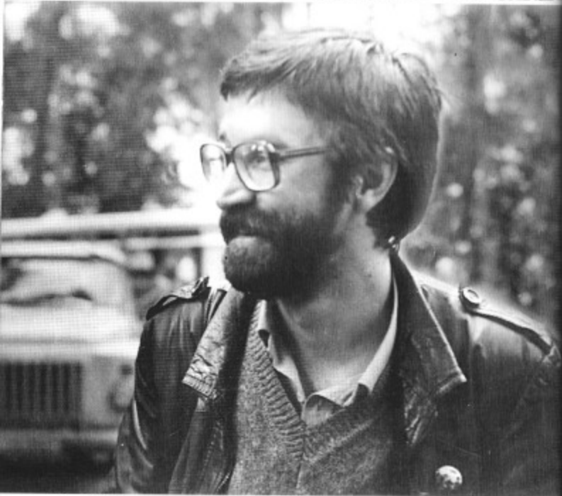
Юрий Шевчук — на рок-фестивалях 80-х и 90-х.