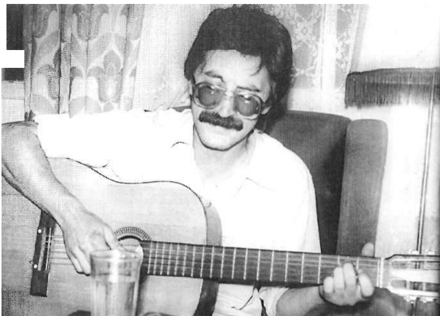
Юрий Шевчук, еще без бороды. (Начало 80-х.)