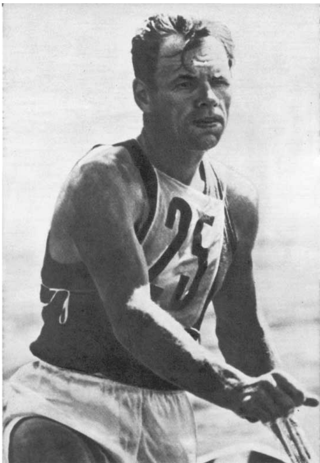
Неоднократный чемпион Мира и Европы, призер Олимпийских игр 1956 года в Мельбурне Геннадий БУХАРИН

всего понравился тренеру — желание во что бы то ни стало добиться наивысших результатов в гребле.