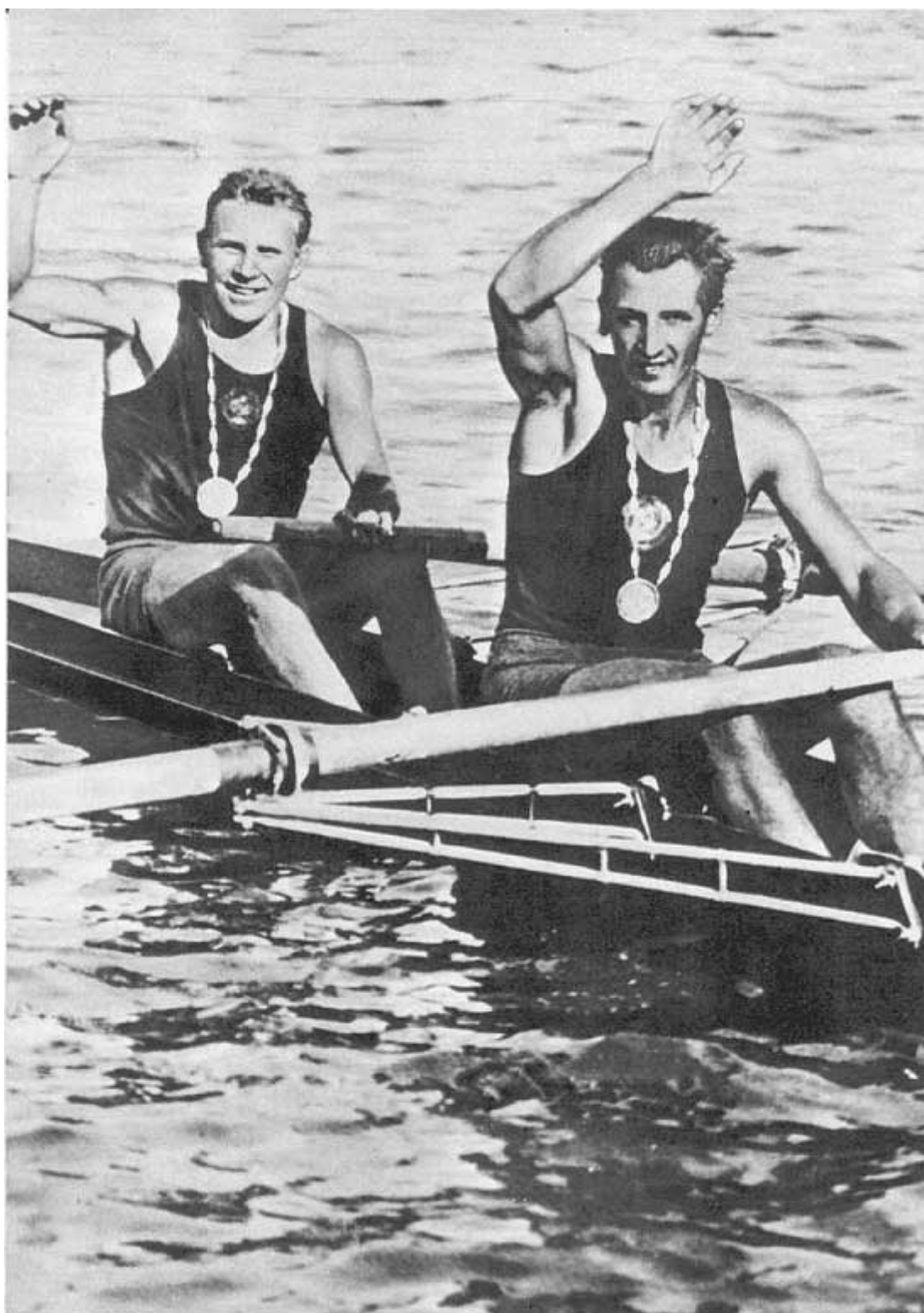
Валентин БОРЕЙКО (слева) и Олег ГОЛОВАНОВ (справа) приветствуют зрителей после победы на Олимпиаде в Риме, 1960 г.

Как люди они сразу не сошлись. Но поистине неисповедимы пути к олимпийским медалям: лодка не пошла, а полетела у них, и в 1962 году мы с Беркутовым поняли, что именно эти ребята заставят нас поставить точку.