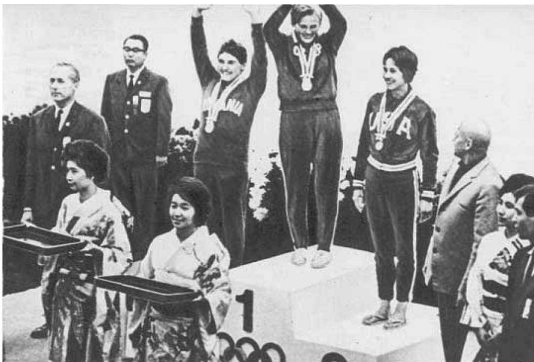
Людмила ПИНАЕВА Чемпионка Олимпийских игр 1964 года