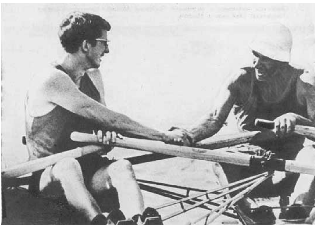
Вячеслав ИВАНОВ (справа) поздравляет нового чемпиона СССР в 1х, Виктора МЕЛЬНИКОВА с победой. Москва. 1968 год

сел в прекрасном расположении духа. На пути к старту едва успели поделиться своими соображениями о тактическом плане гонки.