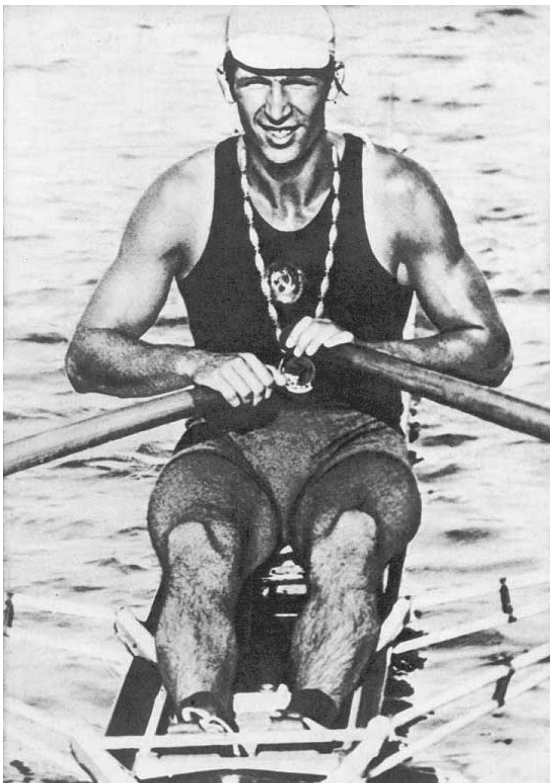
Вячеслав ИВАНОВ гордость советского спорта - трехкратный олимпийский чемпион вторая олимпийская медаль на римской олимпиаде 1960 года