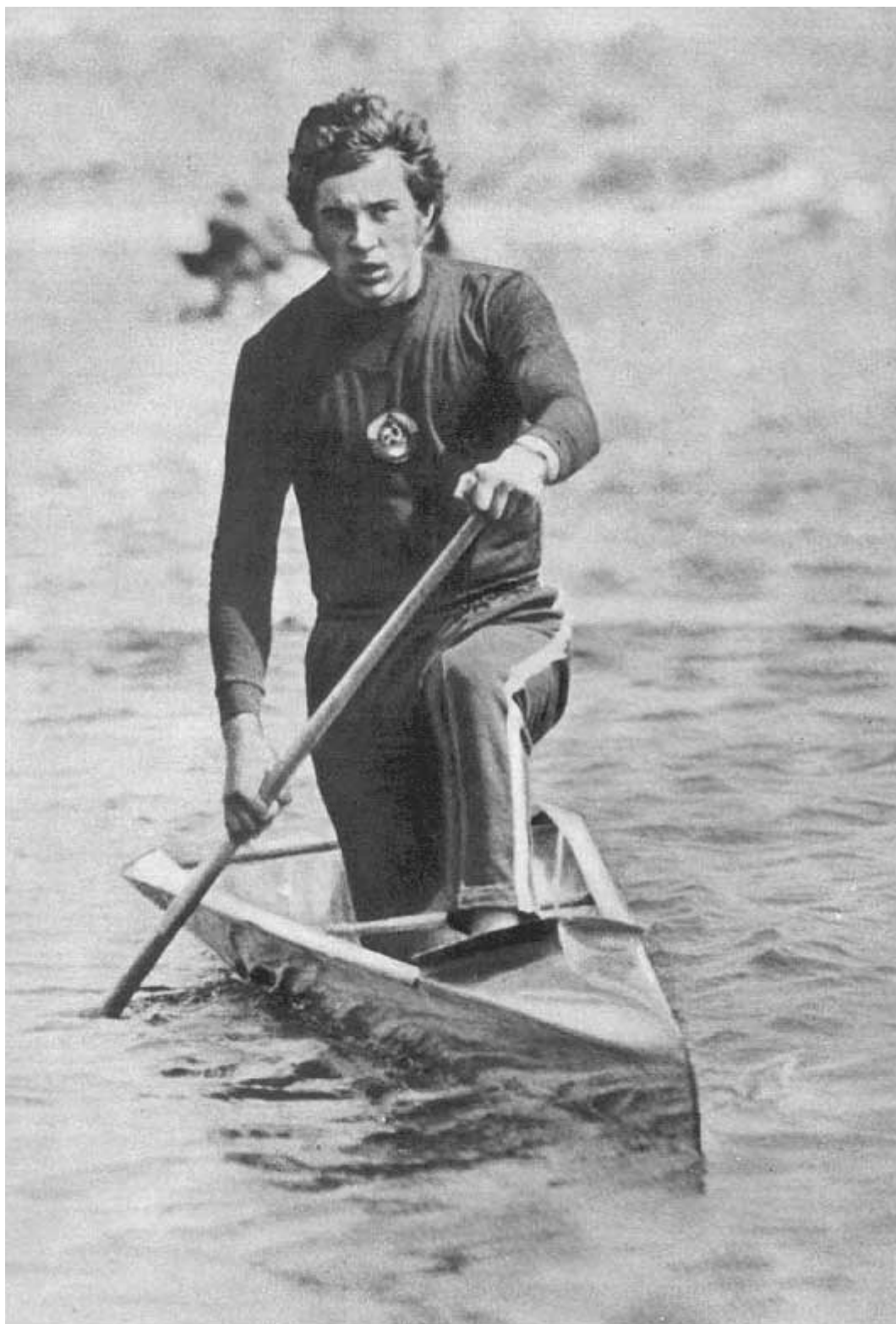
Первый Олимпийский чемпион на каноэ-одиночке Александр РОГОВ

Гонка на каноэ-одиночке вызвала огромный интерес у канадцев. В финале шел их соотечественник Джон Вуд, он имел превосходные шансы на золотую медаль, и в день решающей гонки толпы зрителей спешили на трибуны гребного канала, расположенного на островке Норд-Дам. Неслыханно упорным было состязание каноистов, всего какие-то сотые доли секунды разделили на финише Рогова и Вуда, но первым пересек створ наш каноист. Так было вознаграждено упорство тренеров, которые никак не желали смириться с печальной традицией в этом классе судов.