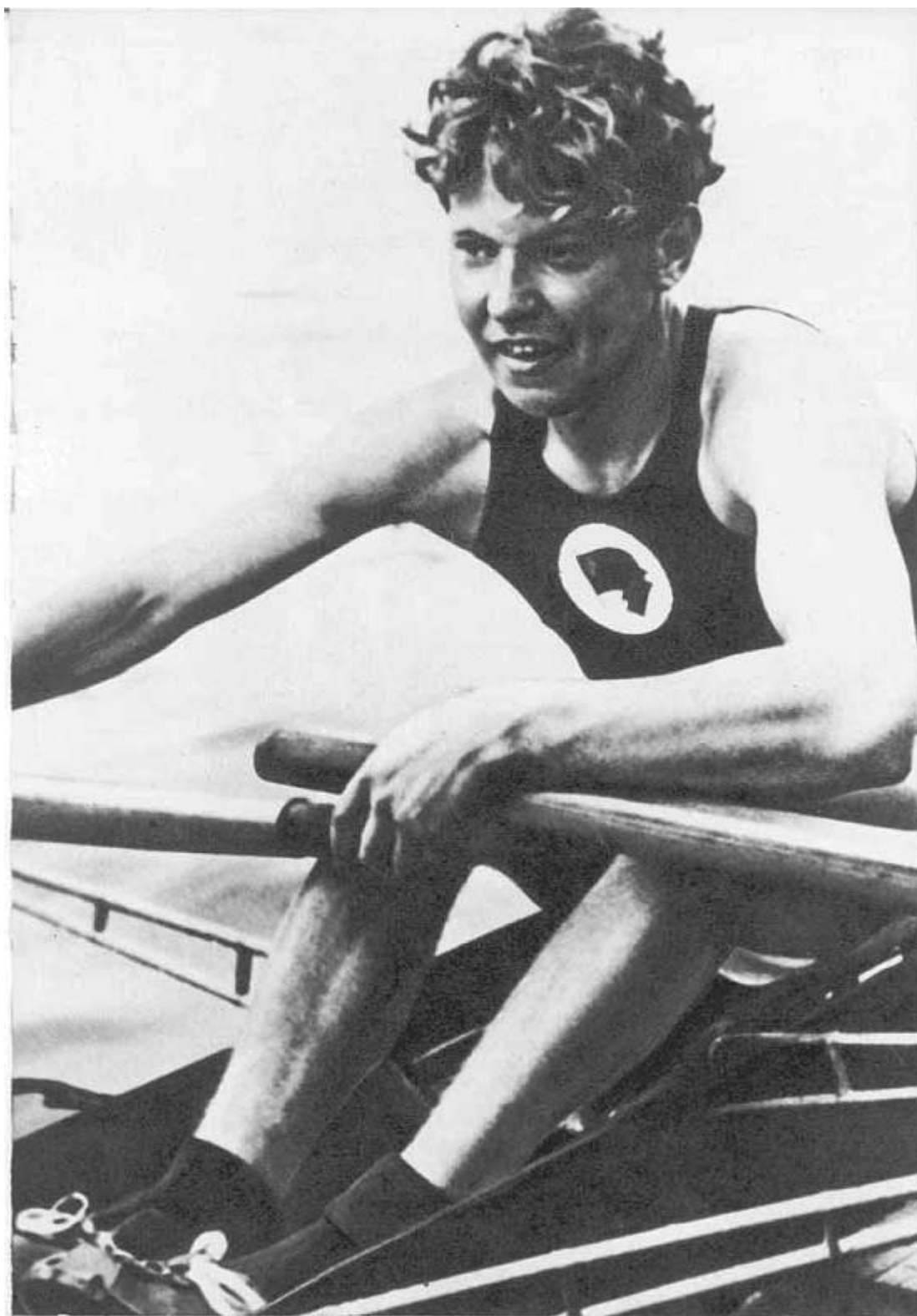
Юрий ТЮКАЛОВ Первый Олимпийский чемпион в академической гребле