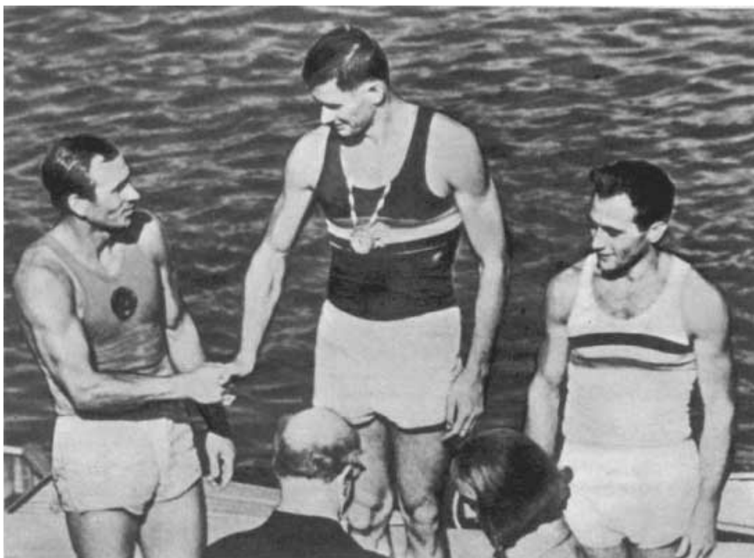
Александр СИЛАЕВ (слева) поздравляет венгра Яноша Парти после победы на римской Олимпиаде

В ту пору разгорались страсти между сторонниками двух школ гребли, каждая из которых опиралась на фундаментальные теоретические исследования, и доводы их подкреплялись победами лучших представителей. И одна самым решительным образом отвергала другую.