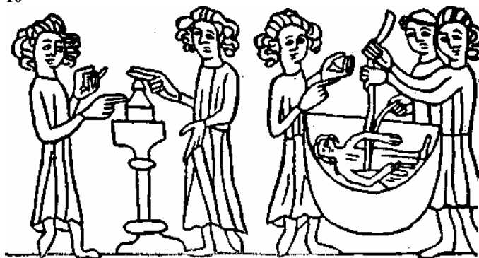
Испытание ведьм: слева — огнем, справа — водой. Рисунок середины XIII в.

оборачивают и делают худое и доброе по их произволу своим ближним, и сим обороченные люди называются оборотни» 17 . Считалось, что ведьмы «портят» коров (и те перестают давать молоко), пугают людей, посылают болезни, вызывают бури, непогоду и т. п.