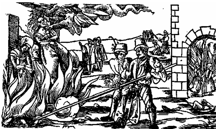
Сожженные «ведьмы» в Дернебурге в 1555 г.

пых и немых, идиотов, нервнопохрясенных, расслабленных. Демонология, вера в существование демонов, обратилась в демономанию, в страх перед вездесущностью бесовского начала 4 . Приведем несколько примеров из многих аналогичных рассказов Евангелий.