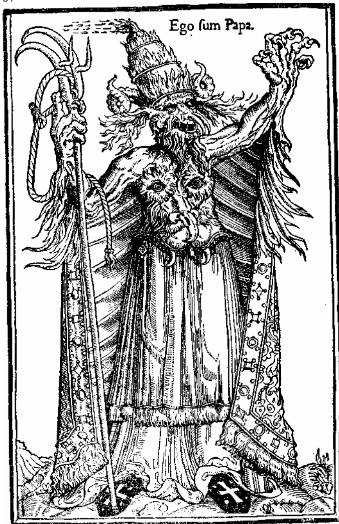
«Я — папа». Фришбургская иерархия конца XV в., на папу Александра VI

992 г. было отмечено, что даже в Риме среди духовенства трудно найти человека, который владел бы начатками знаний. В Испании во времена Карла Великого из тысячи священников едва ли один мог написать приветственное письмо».