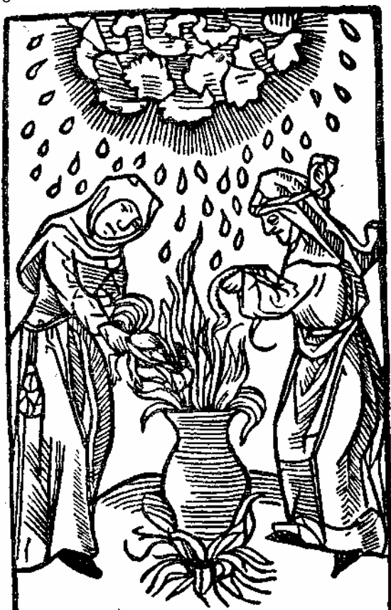
Ведьмы вызывают гром и град. Рисунок конца XV в.

христианство была перенесена часть языческих верований. Это «бессознательное двоеверие» сохранилось в народе, «ибо и до сих пор под именем суеверий, обычаев и обрядов, народных праздников и увеселений он еще весьма немало удерживает в своей вере и в своем быту остатков язычества»