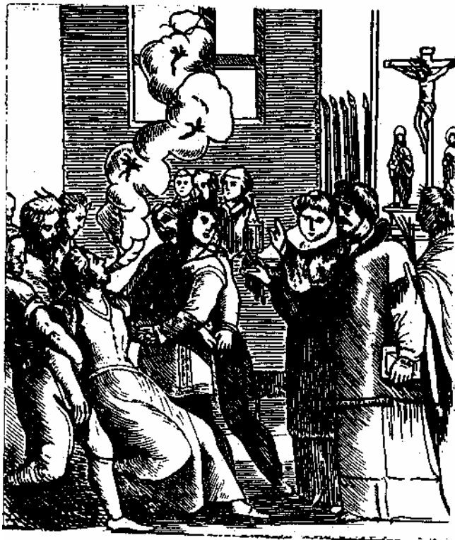
Католический поп изгоняет бесов из женщины. Средневековый рисунок

шой исторический памятник человеческого невежества и суеверия, богословской кровожадности и