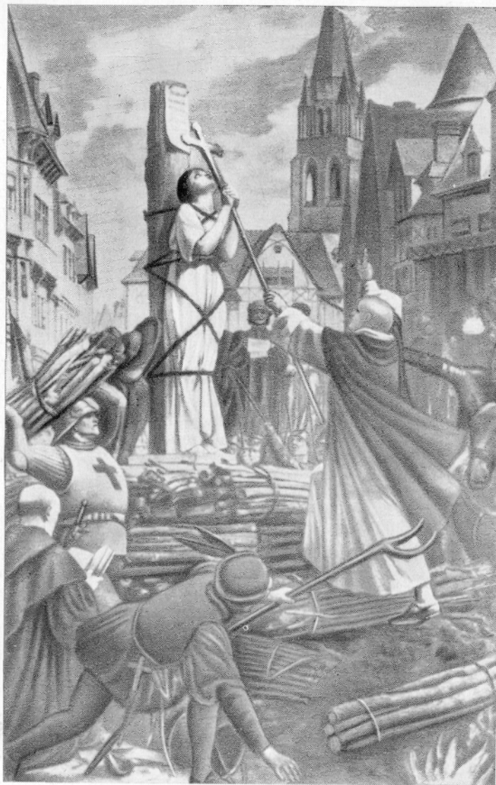
Сожжение Жанны д'Арк. Картина французского художника