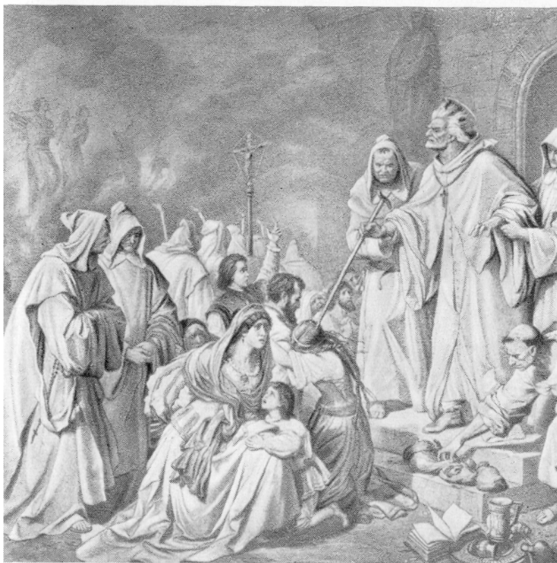
Инквизитор Арбуэс (Испания) приговаривает семью еретиков к сожжению