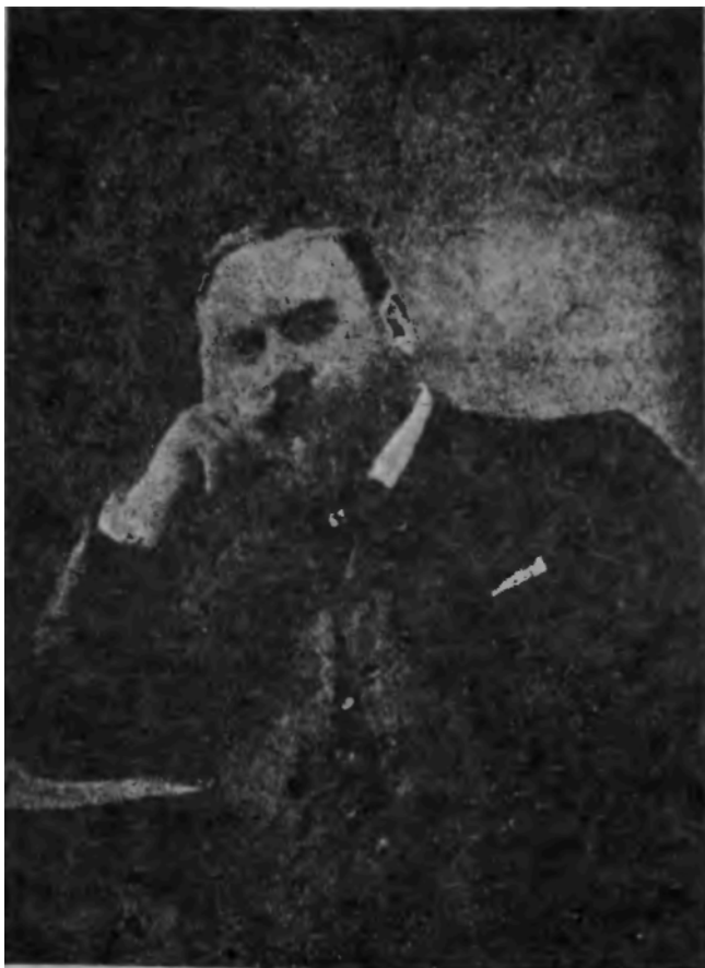
Проф. Ж. Фабиусъ де-Шанвиппъ.

зомъ, чувственные нервы приспособлены къ передачѣ колебаній центростремительныхъ. т.-е. идущихъ снаружи внутрь, а двигательные нервы передають центробъжныя колебанія, т.-е. идущія изнутри* наружу". [ Неопредѣленныя силы , стр. 554).